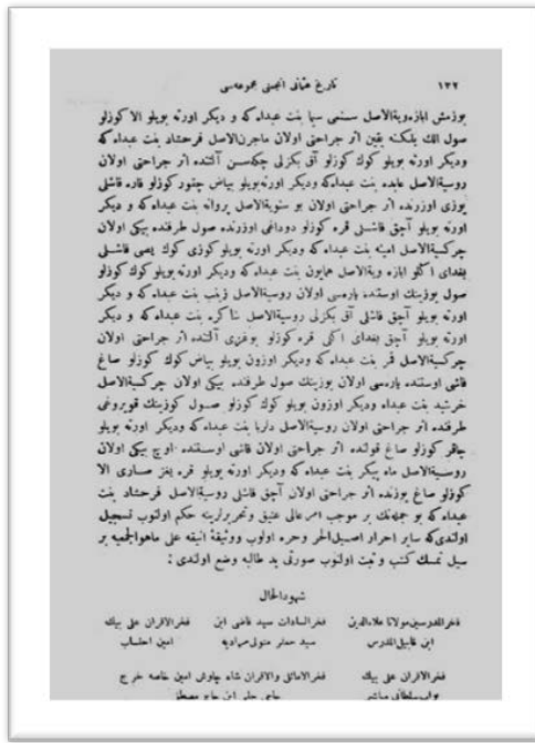
Tarih-i Osmani Encümeni Mecmuası , 11-13. Sene, 1 Teşrin-i Sani 1339, no.62:77, s.132.