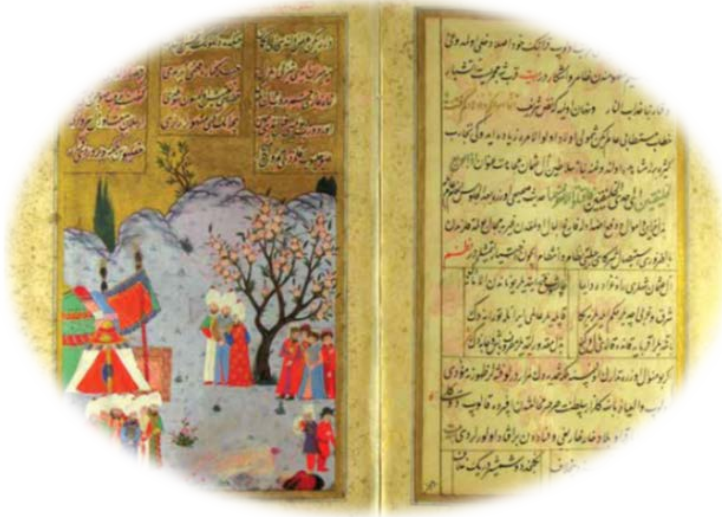
Hünarnâme , c.II, 182 a-b, Topkapı Sarayı Müzesi Kütüphanesi.

yolculuğuna uğurlayan şair, bu tür eserlerde âdet olduğu üzere son beyitte devrin padişahına görünüşte dua etme nezaketini de gösterir.” 2