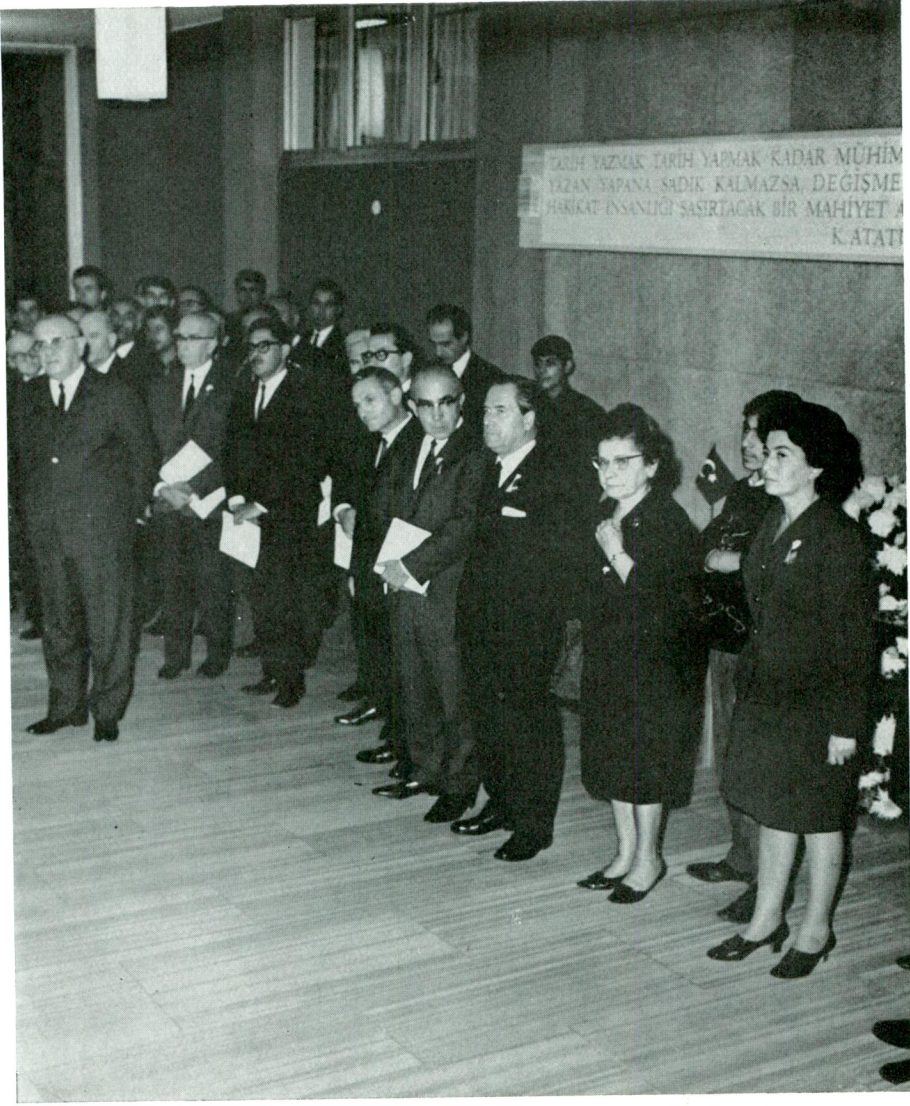
Sayın Cumhurbaşkanı Cevdet Sunay ve bir kısım davetliler Başkanın açış konuşmasını dinlerken.