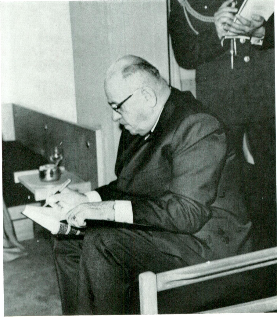
Sayın Cumhurbaşkanını Kurumun hâtırâ defterine duygularını yazarken.