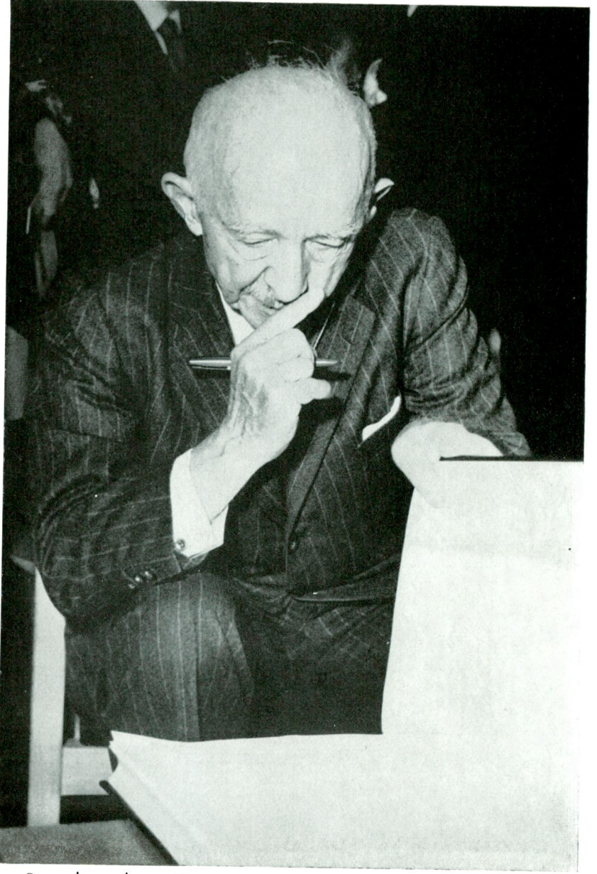
Sayın İsmet İnönü Kurumun hâtıra defterine yazdıklarını okurken.