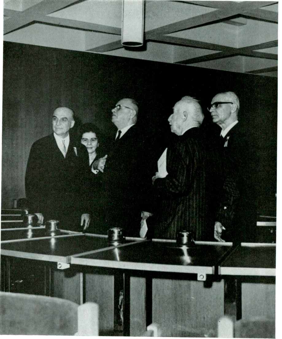
Sayın Cumhurbaşkanı ve Sayın İnönü toplantı salonunda Atatürk'ün sözlerini okurken.