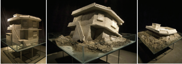
Görsel 4. Juree Kim, 2010, 124 Hwigyeong. Inter-Nallae. (2010). Seul: Sungkok Art Museum.

göz ardı etmek için yazıyı, yazılmışlığı mutlak bir olguymuş gibi algılamaya daha baştan istekliyizdir. Bu nedenle, bu fotoğraf (Görsel 5), İslami öğelerle ‘kadersel’ bir ideolojiye yönlendirir bizi ki bu başlı başına gerçeklik ideolojisini yürürlükte tutmak için bizim kendimize verdiğimiz en sabit duruştur. Bu sabitlemişliği arzulamamızın nedeni de gerçekliğin tutarsızlığını, irrasyonelliğini ve kimliğimizdeki boşluğu öncül, özcü ya da kadersel belirlenmişliklerle, doluluklarla tamamlayarak bertaraf etmektir. Bu nedenle bu çalışma daha baştan bir değiştirilemezliği onaylamakta ve İrandaki kadın üzerinden yürütülen ideolojinin bir yansısını bize sunmaktadır. Bununla birlikte yazı ile aktardığı yazılmışlık, kadersellik ile bu değiştirilemezliği onayladığını ele vermektedir.