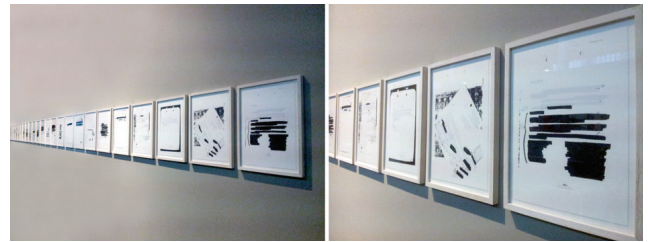
Görsel 1. Glenn Ligon, 2011, Bilgi Özgürlüğü Yasası Çizimleri / FOIA Drawings . 12. İstanbul Bienali. (2011). İstanbul: Antrepo

Aşağıda temsili olarak seçilen örneklerle sınırlı kalmadan da söylenebilir ki, güncel sanatsal çalışmaların öne çıkarılan örnekleri, aktarmaya çalıştıkları ideolojik bakışın ve ideolojik kimliklerin aslında birer fantezi olduğunu, yani var olmadığını ele vermektedir. Her ne kadar bunun aksini yapma amaçları olsa da, yani aslında kendilerini var ettikleri ideolojik bakış onlar için meşru, yani gerçek olsa da, ideolojik mistifikasyonun dışından bakılan bir analizle görülür ki bırakın ideolojik aktarımlarını ve kimliklerini meşrulaştırma girişimlerini, aksine bunların kurgusalıgını, fetişist cisimleşmelerini ve fantezi nesnelere olmalarını ele vermektedir.