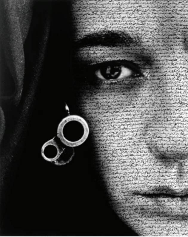
Görsel 3. Shirin Neshat, 1996, Dili Tutulmuş / Speechless . New York: Gladstone Gallery. http://www.gladstonegallery.com/artist/shirin-neshat/work#&panel1-4

Shirin Neshat, “Dili Tutulmuş” çalışmasında (Görsel 3), 1979 İslam Devrimi sonrası İran’a gittiğinde karşılaştığı silahlı çarşafli kadınlardan yola çıkar. Neshat, çoğu çalışmasında olduğu gibi burada da dine dayalı ideoloji ile birlikte cinsiyete dayalı ideolojinin, yani İslami ideoloji ile feminist ideolojinin bakışını birlikte aktarır. Burada işlediği kadınları, Allah aşkı, inanç ile şiddet ve suç arasında gönüllü olarak duran kadınlar olarak tanımlar (Neshat, 2010, 5’-5’10”). Bu nedenle Neshat, kadınlar üzerinden ülkenin yapısını ve ideolojisini okumanın mümkün olduğunu, yani kadınların tarihi olarak siyasî dönüşümü cisimleştirdiğini ifade eder (Neshat, 2010, 4’40”). Din ve cinsiyete dayalı ideolojik bakış da diğerleri gibi toplumsal gerçekliğin imkânsızlığındaki boşluğu maskelemek için kurguladığımız hiyerarşik ikiliklerdendir. Belli bir din ya diğer dinlerle ya da dinsizlikle karşıtlığı üzerinden var edilir. Öznenin kimliğindeki gibi, bir din fantezisi onu tehdit eden başka bir din ya da dinsizlik fantezisi üzerinden var edilebilir. Neshat örneğinde, din, varlığındaki boşluğu kadınla doldurur. Kadını kendi ideolojik kimliğine sıkıştırarak kimliğindeki boşluğu doldurması her ikisinin de fantezisini göz ardı etmesi ya da maskelemesi için ‘başarılı’ stratejilerdir. Böylece hem kadın, kendi kimliğini din üzerinden meşrulaştırma mücadelesi içinde kendini var eder hem de din, kadının