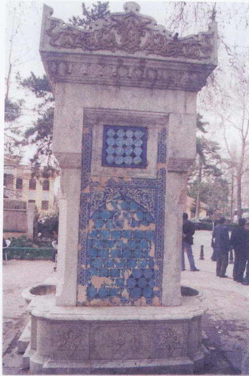
Foto. 8- Sait Bey Çeşmesi, güney cepheden görünüşü