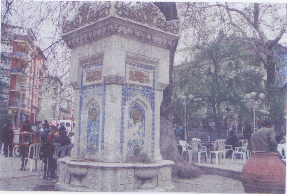
Foto. 4- Sait Bey Çeşmesi, genel görünüş