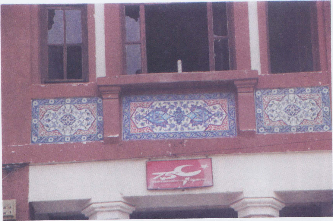
Foto. 10- Darü'l-eytam, cephedeki çini panolardan görünüş