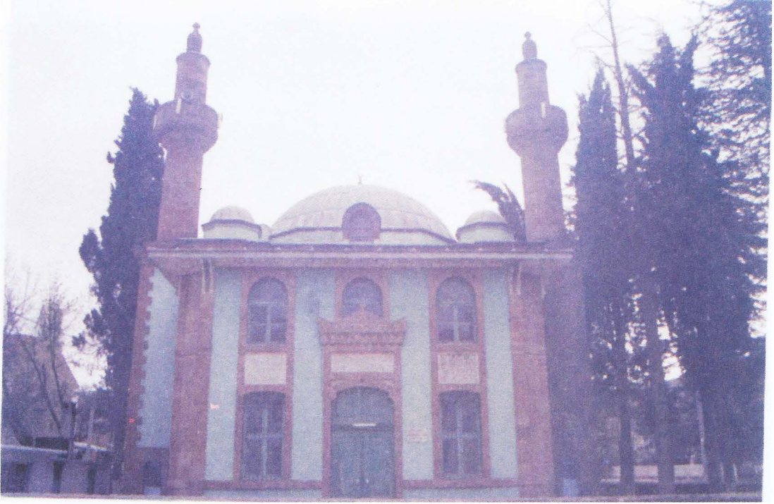
Foto. 1- Hamidiye Camii, cephe görünüşü.