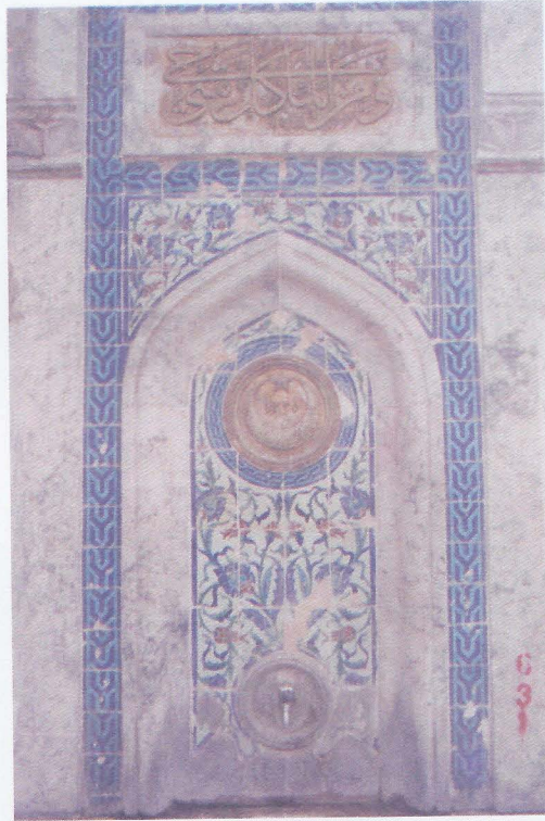
Foto. 6- Sait Bey Çeşmesi, doğu cepheden görünüşü.