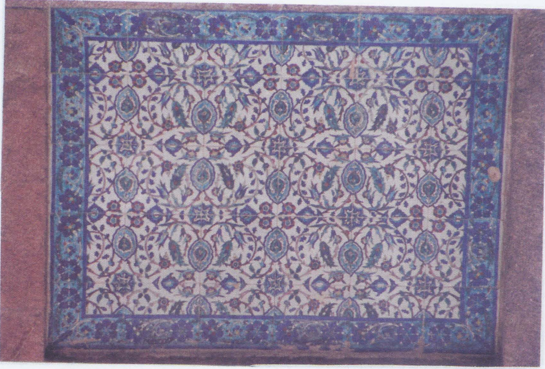
Foto 3- Hamidiye Camii, harim, çini pano, detay.