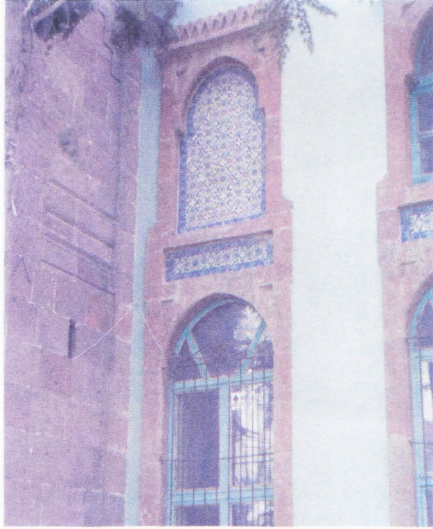
Foto 2- Hamidiye Camii, çini panolar, detay.