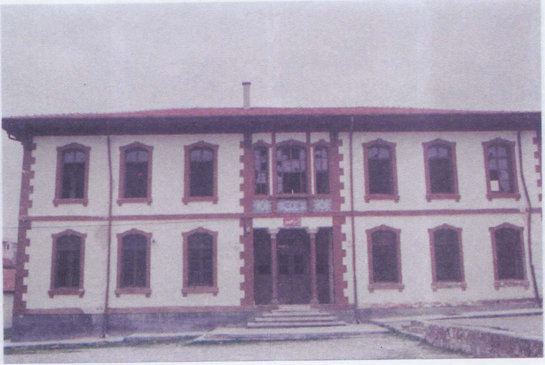
Foto. 9- Darü'l-eytam, cepheden görünüşü