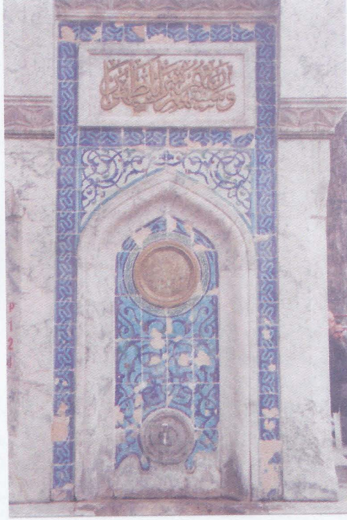
Foto. 5- Sait Bey Çeşmesi, kuzey cepheden görünüşü.