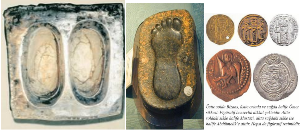
Resim 1: İbrahim'in Kabe'de Bulunan Ayak İzi