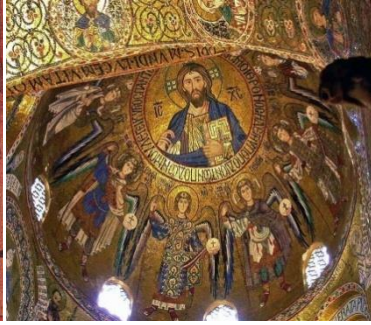
Resim 8: Sicilya Capella Palentine Kilisesindeki Samarra Etkili Duvar Resimlerinden