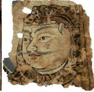
Resim 9: Leşker-i Bazar Duvar Resimlerinden Muhafız Tasviri