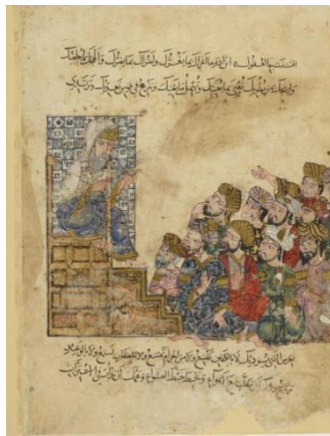
Resim 11: Hariri-Makamat Bibliothêque Nationale de France