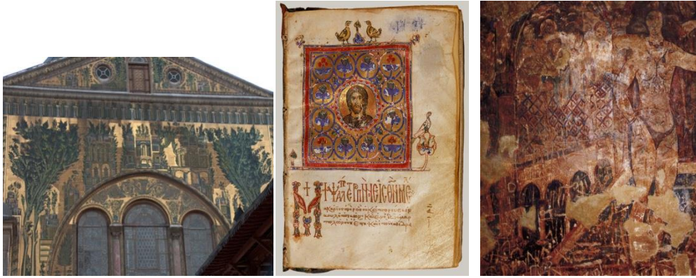
Resim 4: Şam Emeviye Camii 705-715. Cennet Tasvirli Dış Duvar Mozaik Süslemeleri