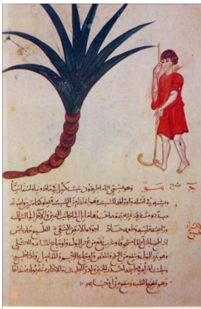
Resim 10: Dioscorides, Materia Medica, TKSM, A. 2127, 6r