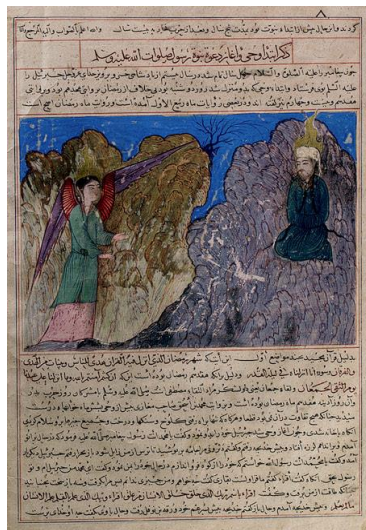
Resim 13: Hz Muhammed'e ilk vahiyin gelmesi 15. yy Timur-Herat ekolu