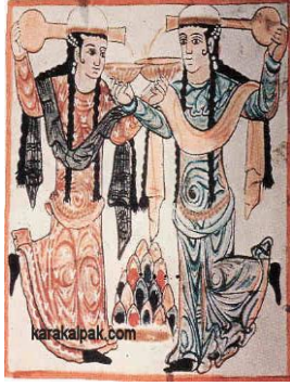
Resim 7: Cevsek-el Hakani Sarayında Bulunan Duvar Resimlerinden