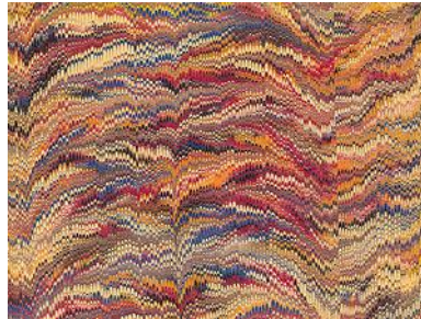
Resim 4: Taraklı Ebru

Taraklı Ebru: Gelgit ebrusu yapıldıktan sonra taraklardan birisinin son yapılan gelgitin yönüne dik yönde teknenin bir kenarından tarağın dişleri kitreye temas edecek kadar sokulup diğer kenarına doğru çekilmesiyle yapılır. Levha kenarlarında ara pervaz olarak kullanılır (Resim 4).