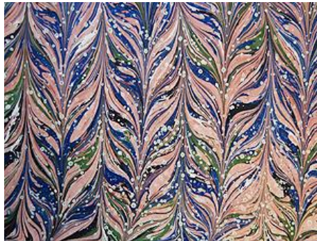
Resim 2: Gel-Git Ebru

Gel-Git Ebrusu: Battal ebru yapıldıktan sonra kalınca bir bizle teknenin önce bir kenarına sonra diğer kenarına paralel bir ileri bir geri karıştırılarak yapılır. Levha kenarlarında ara pervaz olarak kullanılır (Resim 2).