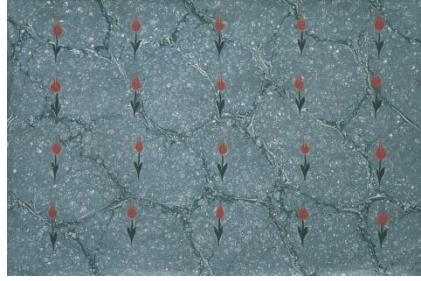
Resim 8: Koltuk Ebru

Koltuk Ebru: Hüsn-ü hat levhaların koltuk tabir edilen boşluklarında kullanılmak üzere hatip ebrusundaki her hatip deseni yerine küçük bir çiçek yapılır. Aşağıda kumlu ebrunun kullanımına örnek olarak verilen levhada gösterildiği gibi kullanılır (Resim 8).