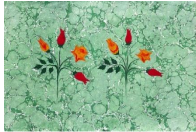
Resim 7: Çiçekli Ebru

Çiçekli Ebru: Zemin ebrusu yapıldıktan sonra önce hazırlanan yeşil boyadan damlatılarak oluşturulan yuvarlaklara, uygun kalınlıkta bir biz kullanılarak sap şekli verilir. Daha sonra sapların uçlarına yapılacak çiçeğe uygun renk damlatılarak yine uygun kalınlıkta iğne ve bizlerle bunlara çiçek şekli verilir. Yan kâğıdı olarak kullanılacak çiçekli ebrulara, cilt kapağı kaldırıldığında birisi kapak üzerinde birisi de karşısında kullanılmak üzere birbirinin aynısı iki çiçek yapılır. Necmeddin Okyay ve Mustafa Düzgünman tarafından bu şekilde lale, karanfil, menekşe, sümbül, gül ve gelincik çiçekleri, son derece başarılı olarak stilize edilmişlerdir. Mustafa Düzgünman, bu çiçeklere papatyayı ilâve etmiştir (Resim 7).