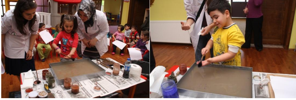
Resim 10: İstiklal Anaokulu Öğrencilerinin Ebru Yapımı

Çocukların ebru sanatına ilgileri çok yoğun. Kâğıdın suya yatırılıp ebrunun alınması anında herkes çok heyecanlanıyor ve nefesini tutuyor. Burada dikkatimi çeken bir husus var. İstemeyerek gelen çocukların bazıları ise teknenin başına oturduklarında çok eğlenceli, zevkli buluyorlar ebru yapmayı, bu çalışmaya geldikleri ve ebru yaptıkları için memnun oluyorlar. Çalışma bittiğinde hemen herkes bir sonraki çalışmanın ne zaman olacağını soruyor. Güzel ebru yapmak için birbiriyle tatlı bir rekabete giriyor. Bu rekabet sırasında gerçekten çocuklar eğleniyorlar. Tekneden çekilen her ebru alkışla karşılanıyor.