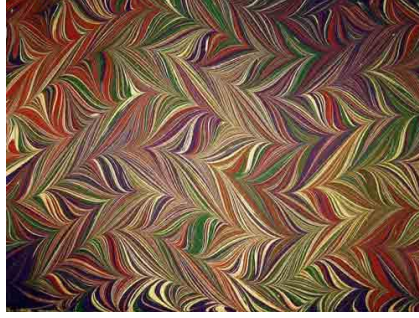
Resim 3: Şal Ebru

aynı kalın bir şekilde kullanılarak rast gele makul miktarda karıştırılmasıyla yapılır. Yan kâğıdı olarak ya da levha kenarlarında dış pervaz veya ara pervaz olarak kullanılır (Resim 3).