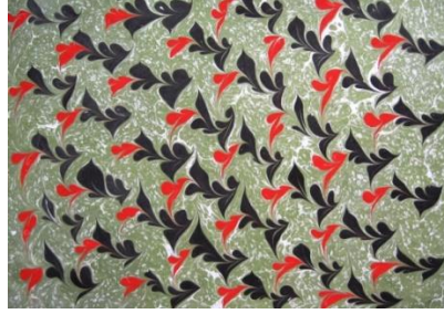
Resim 6: Hatip Ebru

Hatip Ebru: Önce zemin ebrusu yapılır. Zemin ebrusunun üzerine, 35x50 cm boyutlarında bir tekne için teknenin uzun kenarı boyunca beş, kısa kenarı boyunca da dört sıra olacak şekilde eşit aralıklarla öd ayarı hatip ebrusuna göre yapılmış bir renk damlatılır. Kitrenin üzerinde dört sıra halinde ve her sırada beş olmak üzere hazırlanan renklerin ortalarına ikinci ve daha sonra üçüncü ve istenirse daha fazla sayıda renk damlatılarak iç içe halkalar elde edilir. Bu halkalara bir iğne yardımıyla şekil verilerek yapılan hatip ebrusunda yürek, taraklı yürek, çark-ı felek, yonca gibi hatip desenleri yapılmaktadır (Resim 6).