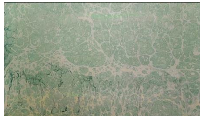
Resim 5: Zemin Ebru

Zemin Ebrusu: Aynı boyadan az ödlü, çok ödlü ve nefli olarak üç kavanoz boya hazırlanır. Bunlar kullanılarak battal ebru yapılır (Resim 5).