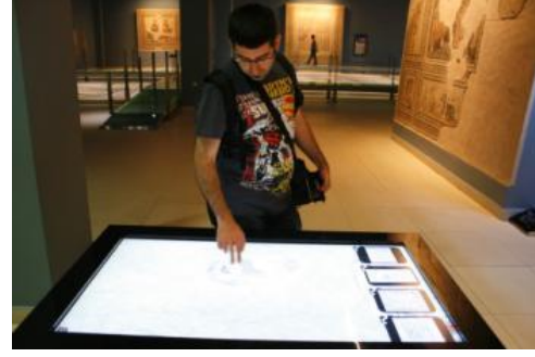
Resim 7. Great Masters Sergisi, Tophane-i Amire Binası / İstanbul Resim

8. Zeugma Mozaik Müzesi Gaziantep/Türkiye