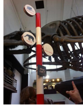
Resim 2. Natural History Museum / Londra