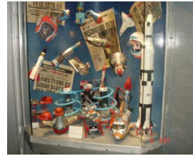
Resim 6. Oyuncak Müzesi / İstanbul