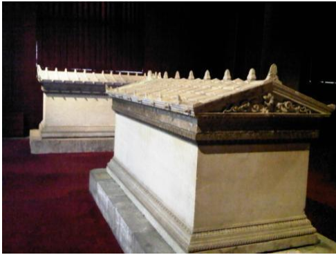
Resim1. Arkeoloji Müzesi / İstanbul

Londra'daki National Gallery, Victoria&Albert Museum, British Musuem gibi dünyaca ünlü müzelerin, her ne kadar sabit sergilenen koleksiyonlarının arasına yeni gelen bazı eserleri ekleseler dahi kalıcı ve uzun süreli sergileri vardır.