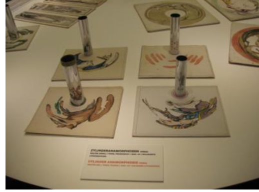
Resim 3-4. 2012, Frankfurt Film Müzesi/Frankfurt