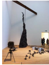
Resim 5. 2012, Tate Modern / Londra

Konu veya dönem bazında müzeciliğe örnek olarak İngiltere’nin Londra kentinde bulunan Tate Museum’u örnek verebiliriz. Tate, 2000 yılından sonra Tate Britain ve Tate Modern olarak ikiye ayrılmıştır. Tate Britain’da İngiliz sanatçıların yapıtlarına yer verilirken Modern’de ise 20.yüzyılın başından günümüze kadar üreten sanatçıların eserleri sergilenmektedir.