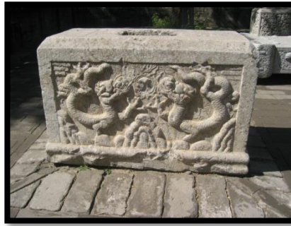
Fotoğraf 5: Pekin, Dongyue tapınağı bahçesi Pahsia ejderha örneği.