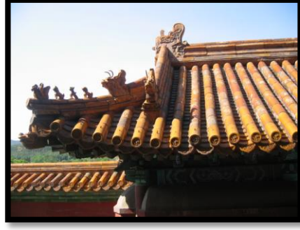
Fotoğraf 6: Pekin yazlık saray Chaofeny ejderha örneği, Ö.Aydın2007.