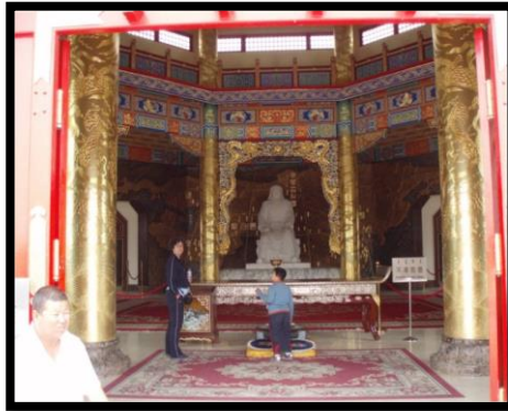
Fotoğraf 9: Moğolistan Cengiz Han Müzesi Suanni ejderha örneği, Ö.Aydın2007.