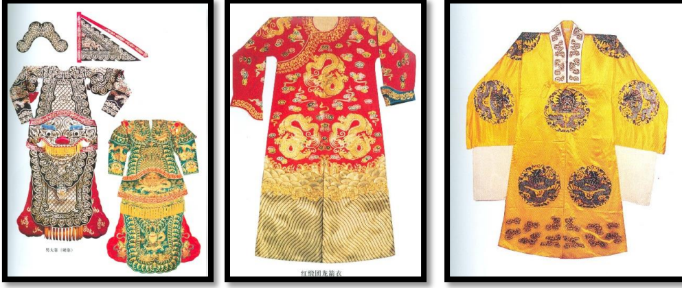
Fotoğraf 10-11-12: İmparator ve imparatoriçeye ait ejder desenli ipek giysiler, Ö.Aydın 2009.

güçlüdür, beşincisi yemek sever, altıncısı su sever, yedincisi cesur ve dövüştür, sekizincisi aslan gibi kuvvetlidir, dokuzuncusu keskin bir gözlemcidir. 5