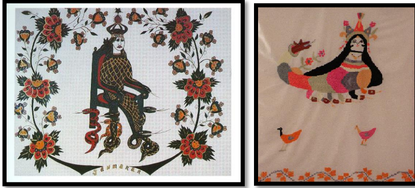
Fotoğraf 17-18: şahmeran desenli işleme örnekleri, Ö.Aydın, 2009.

Bu uzun hikâyede ayrıca, Şahmeran’ın etini yiyen hasta hükümdarın iyileşmesinden de anlaşıldığı gibi, yılanın canlandırıcı, yani yaşatıcı özellikleri olduğu da vurgulanır. Halk resimlerinde şahmeran başında boynuzlu süslü tacı, yine taçlı yılanbaşı kuyruğu ve yılanbaşlarından oluşmuş birçok ayaklarıyla mitolojik bir yaratık olarak gösterilmiştir.