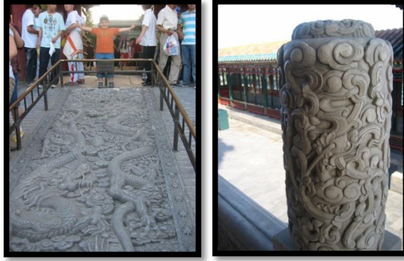
Fotoğraf 7-8: Pekin yazlık sarayı bahçesi Chihwen ejderha örneği, Ö.Aydın2007.