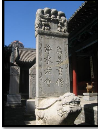
Fotoğraf 4: Pekin, Dongyue tapınağı bahçesindeki pihsi ejderha örneği, Ö.Aydın2007.