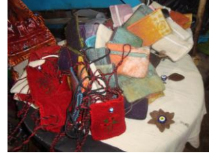
Resim 28: keçe çanta Resim 29:keçe şal Resim 30:keçe takı-toka Resim 31: keçe süs eşyaları