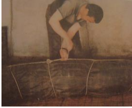
Resim 19: Tepme işine hazır dürüm