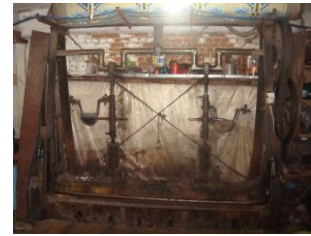
Resim13: Yünü kalitesi Resim 14: Yünün atılmasında