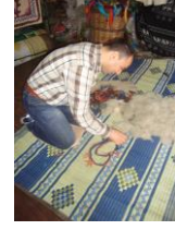
Resim 21:Hasır Şalı Resim 22: Makas Resim 23: Sabun kazanı Resim 24: Desenleme