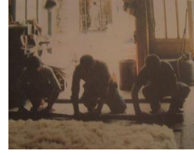
Resim 18: Dürülme aşaması