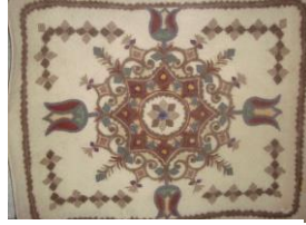
Resim 9:Keçe Paspas