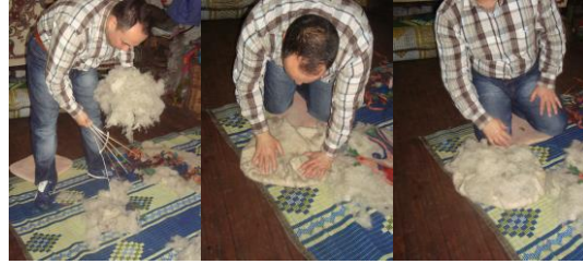
Resim 20: Çatkısı yapılan keçe