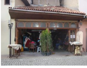
Resim 11: Tire'de keçe atölyesi