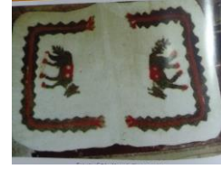
Resim 10:Keçe Belleme (eyer), (S.Ekici,s.58)

Keçenin haricindeki tüm keçe çeşitlerinin zeminleri desen ile kaplıdır. Desenler stilize bitkisel ve geometrik formlardan oluşmaktadır. Keçeneklerin ön yüz, üst göğüs hizasındaki bölümlerinde renkli çiçek motifi ve alt kısmında da keçe ustasının müşteri kayıt defterindeki sıra numarası almaktadır. 6