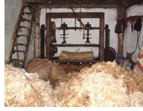
Resim 12: Yünlerin toplanması