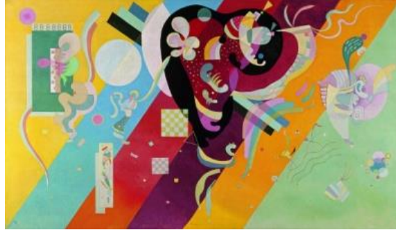
Resim 8. Wassily Kandinsky “Kompozisyon IX”1936,Yağlıboya,113x195cm, Paris

Kübizm’de nesnelerin geometrik parçalanması soyut sanatta bütün dış gerçeklerle bağların kopması şeklinde kendini göstermektedir. Soyut sanat düş gücüyle ya da doğadaki bir nesnenin biçiminin artırılmasıyla elde edilebilir. Arıtılan biçimle oluşan imge nesneyi çağrıştırabileceği için soyutlama olarak tanımlanması daha doğrudur. “Resim sanatı ile ilgili soyutlama terimi altında, ressamın gerçek nesne, figür ve doğa görüntülerine ait biçimleri, çağına ve kişiliğine özgü bir görüşle resimsel biçimlere dönüştürmesi anlaşılmaktadır” (Berk ve Turani: 1981, s.224). 20. Yüzyılın başlarında W.Kandinsky’nin (Resim 8) çalışmalarıyla yönlenmeye başlayan Soyut sanat, doğanın ve nesnelerin ifadesi ya da taklidi değil, sanatçının renk, çizgi ve biçimlerle oluşturduğu doğa ve nesnelere ilgili olmayan bir ifade tarzıdır (Tunalı, 1984: 176).