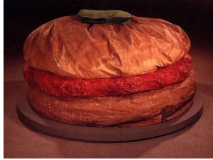
Resim 11. Claes Oldenburg "Dev Hamburger" Köpük Ve Yelkenbezi, 1929, 213x132, Toronto

Pop sanat tüketim yaşamına giren her şeyi sanat olarak niteleyen endüstri toplumunun yarattığı, yeni gençliğin kültürü ve sanatı olarak karşımıza çıkmaktadır. Örneğin, Claes Oldenburg çeşitli gereçlerden yararlanarak tüketim ekonomisine ait nesnelere kendine konu olarak seçmiştir. Sanatçı dev daktilo makineleri, hamburgerler (resim 11) banyo küvetleri gibi nesnelere; tahta, kumaş ve plastik gibi çeşitli nesnelere kullanarak çalışmalarını gerçekleştirmiştir.