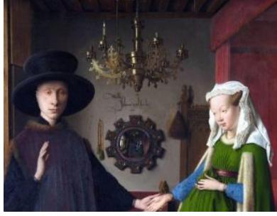
Resim 2. Jan Van Eyck Arnolfini'nin Evlenmesi (detay) 1434 yağlıboya, 82x60cm Londra

Rönesans resminin olanaklarıyla birlikte kent-soylu insanın yaşamı, gösterişi, zenginliği, yaşama biçimi resimlere konu olmuştur. Resimlerde gözlenen nesnelere; değerli kumaşlar, müzik aletleri, çeşitli meyveler, porselenler, cam ve kristal eşyalardır. Rönesans'ta nesnelere en ince ayrıntısına kadar girilerek titiz bir incelikle işlendiği gözlenmektedir (Resim 2).