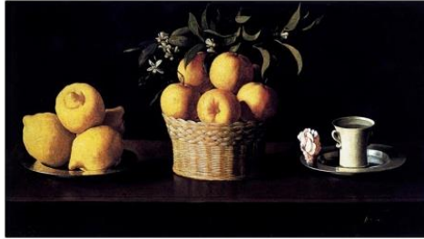
Resim3. Francisco de Zurbarán'ın "Natürmort" 1633,yağlıboya, 60x107cm, Pasadena

Rönesans sonrası oluşan Barok sanatta, Rönesans'ın denge ve uyum konusunda eriştiği ölçüden çok, abartı ve hareketlilik hâkimdir. Çiçek , meyve gibi nesnelere belli bir düzende ele alındığı ölüdoğa resmi bu dönemde ortaya çıkmıştır. Sanatçılar nesnelere bütün görünüşleriyle ortaya çıkarmak istemişlerdir (Resim 3).