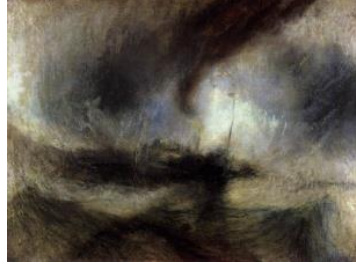
Resim 5. William Turner’ın “Fırtına’da Gemi” 1842, Yağlıboya, 91x121cm, Londra

Romantik dönemde sanatçılar, kendilerini ve hayallerini özgürce ifade edebilmektedir. Eserler sanatçıların iç dünyasını yansıtmaktadır. Resimlerde ifadeyi güçlendirmek için nesnelere çizgilerden çok renk kütleleri ile ortaya koyulmaktadır. Akıma egemen olan manzara resmine örnek olarak William Turner’ın “Fırtına’da Gemi”(Resim 5) adlı tablosu verilebilir.