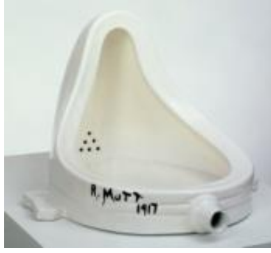
Resim 9. Marcel Duchamp "Çeşme" 1917

Dada hareketinde her türlü nesneden yararlanıldığı ve bunların belli bir tekniğe bağlı kalınmadan montaj, fotomontaj, asamblaj, kolaj gibi tekniklerle ve hatta seri üretim nesnelere bizzat alınıp sanat eseri olarak sergilendiği görülmektedir.