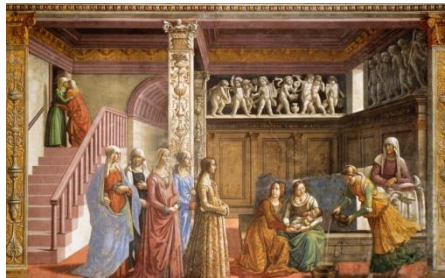
Resim1. Ghirlandaio "Meryem'in doğuşu" 1486-90 fresco,cappella Tornabuoni,Florence.

Rönesans'la başlayan bireyin özgürleşme hareketi, düşünce tarihinde olduğu gibi sanat alanında da görülmektedir. Rönesans'la birlikte birey artık kendini ortaya koyabilmektedir. Sanatçılar konularını ve düşüncelerini aktarmasına yardımcı olacak nesnelere kendileri seçebilmektedir. Perspektifin uygulanması ve yüzeylere yapılan resimlerde üç boyutlu gerçek görünümün yansıması ile nesnelere gerçek görünümüne kavuşmaktadır (Resim 1).