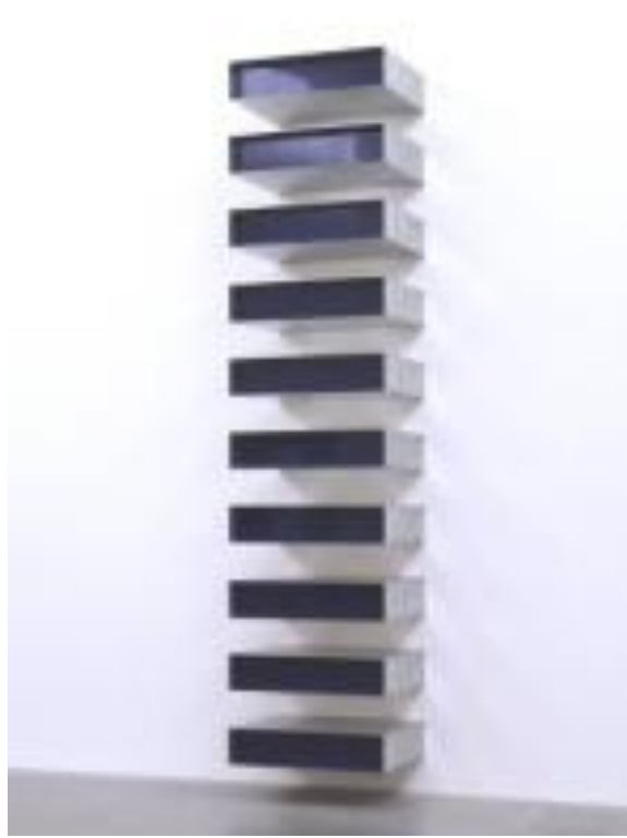
Resim 12. Donald Judd "Duvar Rafları" 1969, Aliminyum,9x40x31cm,Los Angeles

1960'lı yıllarda Amerika'da ortaya çıkan bir başka sanat anlayışı da Minimal sanat olarak bilinmektedir. Soyut sanatın varmış olduğu en uç nokta olarak görülen Minimal sanatla birlikte, nesnenin olabildiğince az çizgi ve renk kullanımı ile geometrik formlara dönüştürülme eğilimi, nesneyi yalın bir maddeselliğe götürmüştür. Minimal sanat temel bir nesne aracılığıyla, seyirci ve onu çevreleyen mekan arasında yeni bir ilişki başlatmayı amaçlamıştır. Minimal sanatta form endişesi olmayıp anlatım öğeleri aza indirilmiştir. Sanat eserinin sürekliliği söz konusu değildir, gelip geçici denemelerdir (Mant,1997:46). Robert Morris'in küpleri ve Donald Judd'ın duvar rafları (Resim 12) Minimal sanatın en yalın örnekleridir.