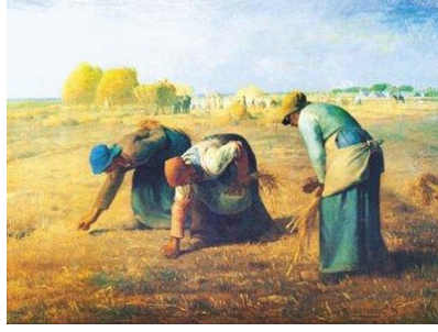
Resim 6. Jean Franois Millet "Başak Toplayan Kadınlar"1857, Yağlıboya,84x111cm,Paris