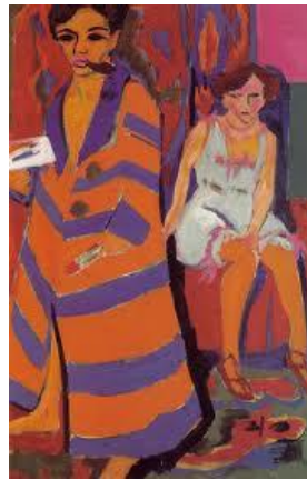
Resim 7. E.Ludwing Kirchner "Sanatçı Ve Modeli" 1910,Yağlıboya, 100x149cm, Hamburg

20. yüzyılın başlarında görülen Expresyonizm'de sanatın asıl amacı, sanatçının duygularını ve iç dünyasını, renk, çizgi, düzlem ve kütle aracılığıyla ifade etmesidir. Bu duyguları daha güçlü yansıtabilmek için sanatçılar, tasarımda denge ya da güzellik gibi geleneksel kavramlardan uzaklaşarak biçim bozma yöntemini yaygınlıkla uygulamışlardır. L. Kirchner'in "Sanatçı ve Modeli" (Resim 7) tablosunda modelin ve pipo, fıra, palet gibi nesnelere biçimlerini ortaya çıkarmaktan çok yüzeylerin boyandığı görülmektedir.