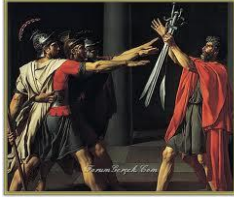
Resim 4. Jacques Louis David “Horas Kardeşlerin Yemini”1784, Yağlıboya, 330x425cm, Paris

nesnelere olmaktadır (Resim 4). Kullanılan nesnelere Roma döneminin kılık kıyafetleri, miğferleri, mızrak ve babanın üç oğula uzattığı üç kılıçtır.