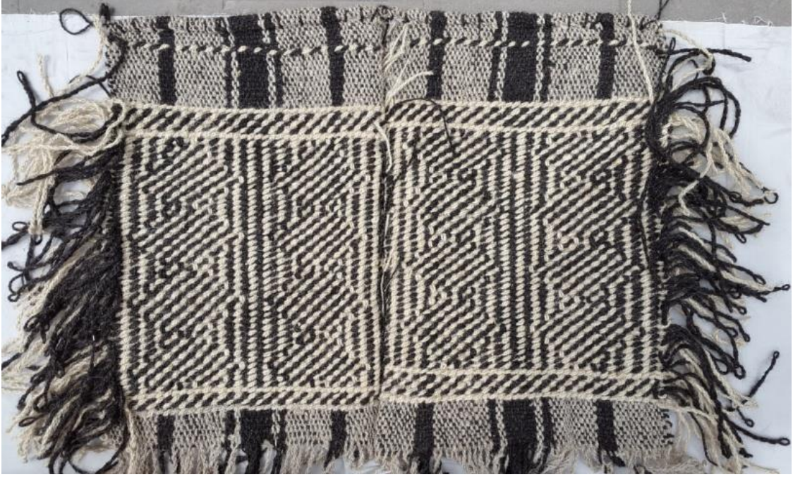
Res. 7b: Mazman Dokuma Arka Yüz