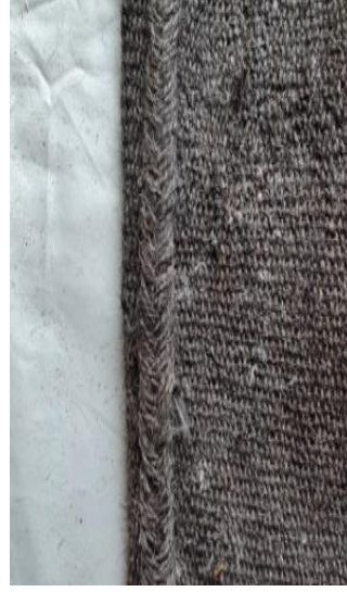
Res. 5b: Palaz Dokumada Kenar Dikişi (Foto, Beyza Demir, 2015)