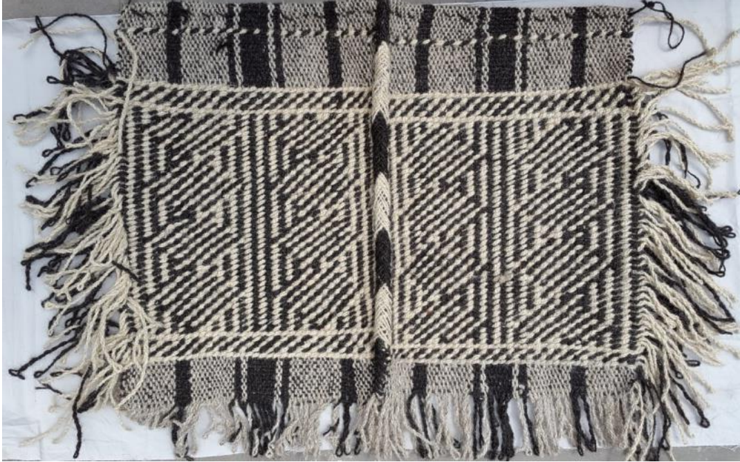
Res. 7a: Mazman Dokuma Ön Yüz, 83 x 66 cm, 1 cm'de 4 çözü teli Z2S

Desenleme siyah beyaz renkli desen atkılarından yapılır. Atkılar iki el ile üçlü çözü gruplarının üstünden ve altından geçirilerek yapılır (Res. 7c). Her atlamadan sonra alt ve üst desen atkılarını yer değiştirir (Şek. 1). Desenli alanlarda ayrıca zemin atkısı yoktur. Desen atkılarını zemin atkılarının iki kat yapılmasından oluşur (Res. 7d). Bu nedenle desen alanı yumuşak ve kalındır. Mazmanın deseni ön ve arka yüzde aynı görünür (Res. 7b). Mazman at ve eşekler eyerlendiği ya da semerlendiği zaman, eyerin ya da semerin arkasında kuyruğa kadar olan açıkta kalan kısma örtülür. Göze hoş görünmesi için çözüden ve desen atkılarında saçak bırakılmıştır (Res. 7a). Yeni bir dokumada desenleme önceden yapılmış olan mazmana bakılarak yapılır. Daha kolay anlaşılması için burada deseni kareli ağıt üzerine aktarmayı yararlı bulduk (Şekil 2). Her kare bir çözü telini temsil eder. Mazmanın iplerinin eğrilip bükülmesi ve dokuması erkekler tarafından yapılır.