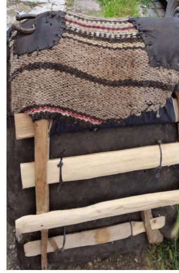
Res. 6: Semer üzerinde Palaz Dokuma (Foto, Beyza Demir, 2015)

Bölgede bazı dokumalar kadınlar, bazıları da erkekler tarafından dokunur. Bazı dokumaların ipleri (iplikleri) kadınlar, bazı dokumaların ki erkekler tarafından yöresel çyırık (çıkırık), iğ gibi aletlerle eğrilir bükülür.