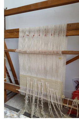
Res. 3b: Dikey Tezgâh