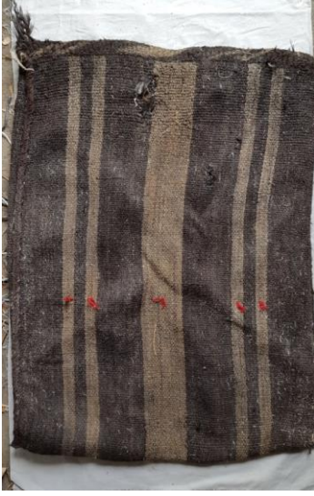
Res. 5a: Palaz Dokuma