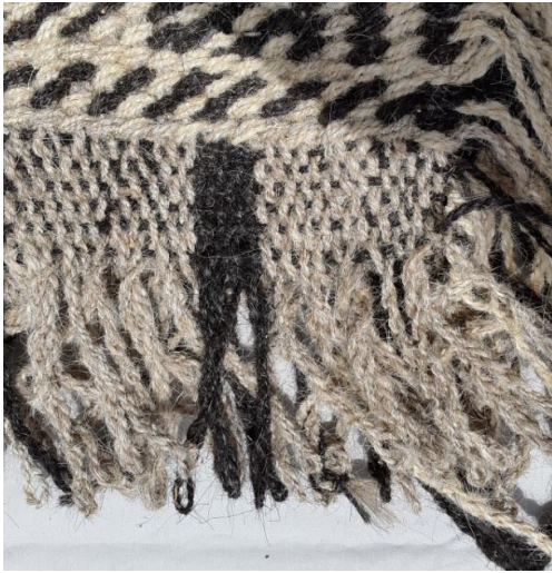
Res. 7c: Mazman Dokuma Detay