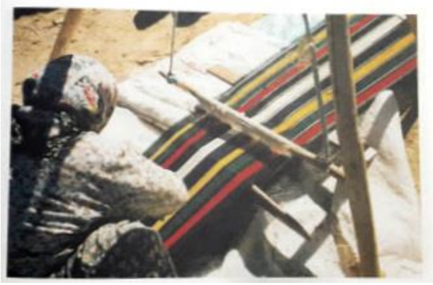
Res. 3a: Yatay Tezgâh

çeşitli renklerden çözüğü şeritleri halindedir (Acar, 1975: 56). Önceleri kıldan dokunduğu bilinen palaz; bölge halkının; köylere gelen çerçi'lere (pazarlamacılar) eski eşyalarını verip karşılığında aldıkları orlon ipliklerle palaz dokunmaya başlanmıştır (Res. 4a, 4b). Palazlar çözüğü yüzü dokumalar oldukları için diğer halı ve kilimlere göre daha ensiz dokunurlar. Çünkü bunlarda çözüğü sık olduğundan enli olurlarsa ağızlık açmak güçleşir. Genellikle yer tezgâhında dar dokunurlar, dokunduktan sonra şeritler istenilen ölçüde kesilip, özel bir dikiş ile yan yana birleştirilirler. Çözüğü yüzü dokumalar kullanıldıkları yere göre; yaygı ise palaz, at eşek örtüsü ise mazman, azık (yiyecek) torbası, heybe, çuval (Res. 5a, 5b, 6) gibi isimler alırlar. Bölgede kullanılan kıl çuvalların, örtülerin boyutları genellikle aynıdır (75-80 x100-115 cm).