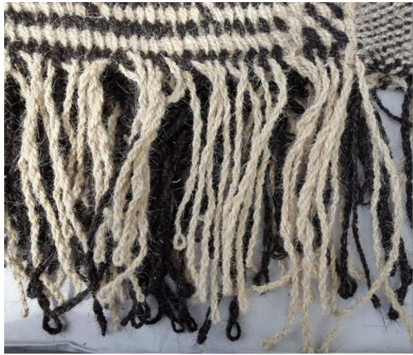
Res. 7d: Mazman Dokuma Detay