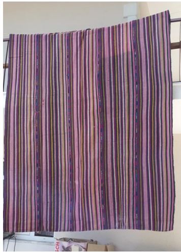
Res. 4a: Palaz Dokuma