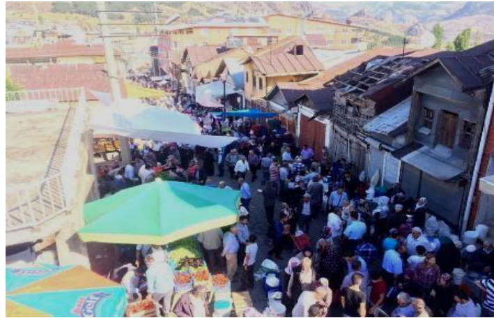
Res. 2: Şebinkarahisar Pazar