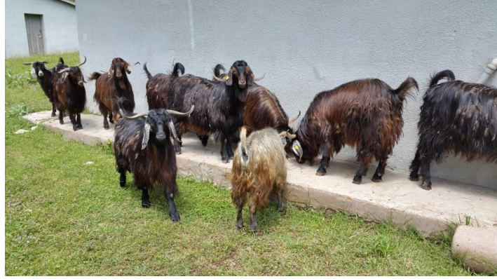
Res. 1: Keçi Sürüsü, (Foto, Beyza Demir, 2015)

çantası, palaz, kilim, mazman dokuma ve halı), üzerlerine renkler ve desenler konarak güzel bir görüntü kazandırılmıştır. İhtiyaç fazlası pazarlarda satılmaktadır (Res. 2).