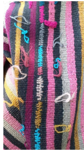
Res. 4b: Palaz Dokuma Birleştirme ve dikiş (Foto, Beyza Demir, 2015)