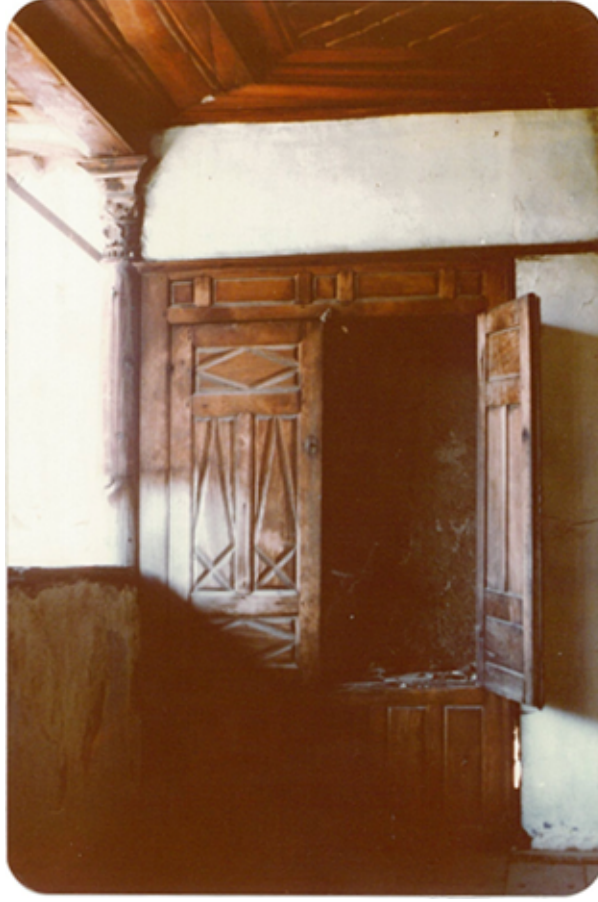
Şekil 3. Beyoğlu Evi sofa alanı dolap kapakları (Yıldız, 1977)

Beyoğlu Evi'nin sofa alanında uygulanan ahşap tavanlar ağır işlemelidir (Şekil 4). Süslemeli çitalar, kalın ahşap profillerle çevrili düz ahşap kaplama zemin üzerine monte edilmiştir.