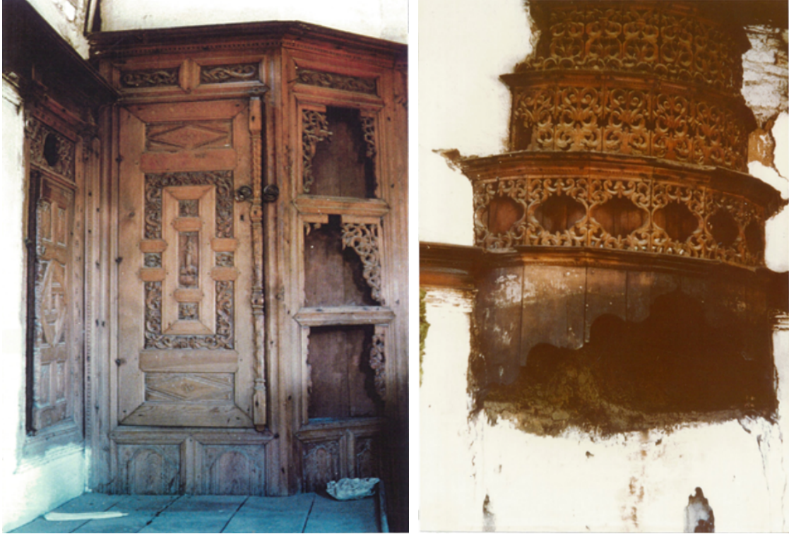
Şekil 12. Kula Kömür Evi dolaba gizlenmiş gusülhane alanı ve ahşap davlumbaz (Yıldız, 1977)

Odaların bir başka özelliği olan Gusülhane, dolabın içinde gizlenmiş yıkanma yeridir. Ağır kapak süslemesi ve yanındaki elemanlarla uyum içinde, duvar yüzeyinde yer alır (Şekil 12). Kula Kömür evinde, başodada yer alan ahşap ocak davlumbazı (Şekil 12), bombeli yatay kayıtların arasına aplike edilmiş ahşap oyma parçalardan oluşmaktadır. Duvar yüzeyinde rölyef çalışması görünümünde, sanat eseri güzelliğinde ve işlevsel özelliği ile yerini almıştır.