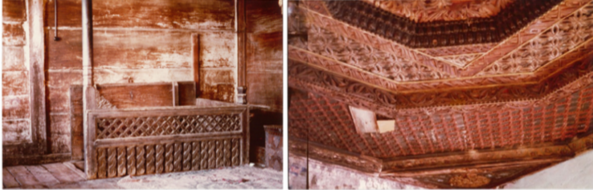
Şekil 17. Memiş Ağa Konağı merdiven korkulukları ve ahşap tavan (Yıldız, 1977)

Tavanın ortasında yer alan ahşap göbek kısmı hareketlidir. Manuel hareket ettirilir ve eğimli yiv üzerinde uzun bir süre dönerek odada pervane görevi yapar (Şekil 17).