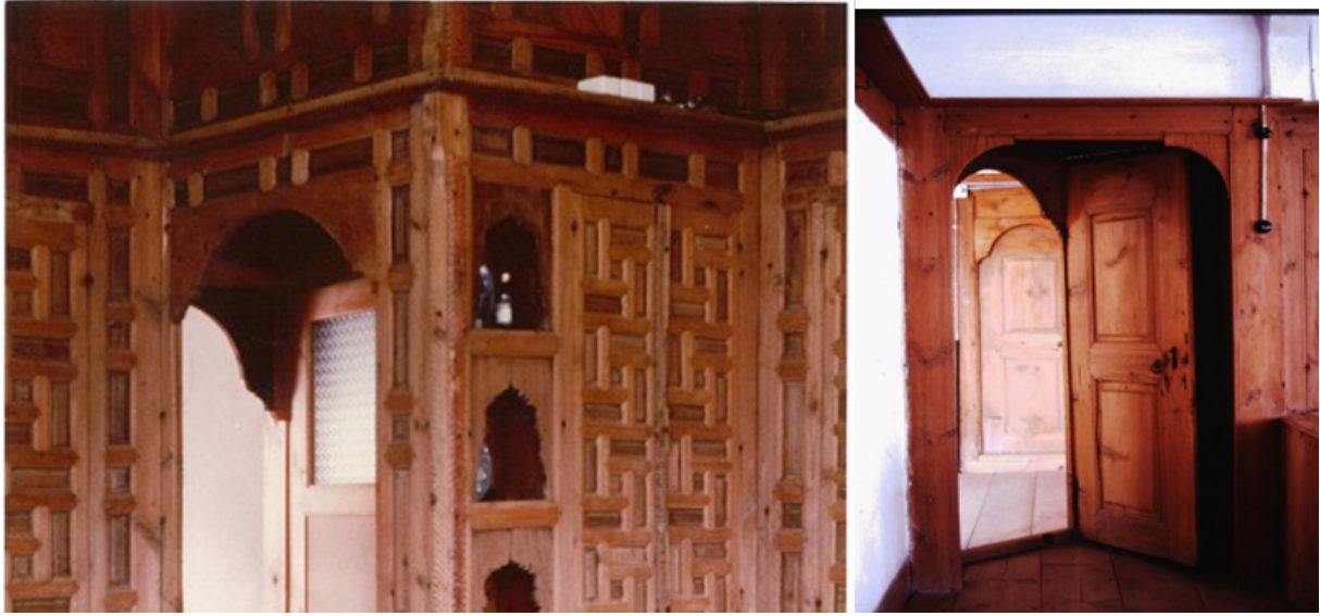
Şekil 15. Safranbolu yöresinde bulunan Emir Hocazade Ahmet Bey Evi ve aynı yörede yer alan Asmazlar Bağ Evi (Yıldız, 1977)

Safranbolu'da yer alan Asmazlar Evi'nin başodasında yer alan ocak-dolap ilişkisinde ahşap dolap, tasarımı ve beyaz boyalı ocak formu ile bir tablo görünümünde duvar yüzeyinde yer alır. Yüzeylerin, dolu boş dengesi ve birim sistem uygulaması ile son derece doğru ve dengeli tasarlanmış olduğu görülür. Yan odada yer alan ocakta (Şekil 16), farklı bir yüzey tasarımı uygulanmıştır.