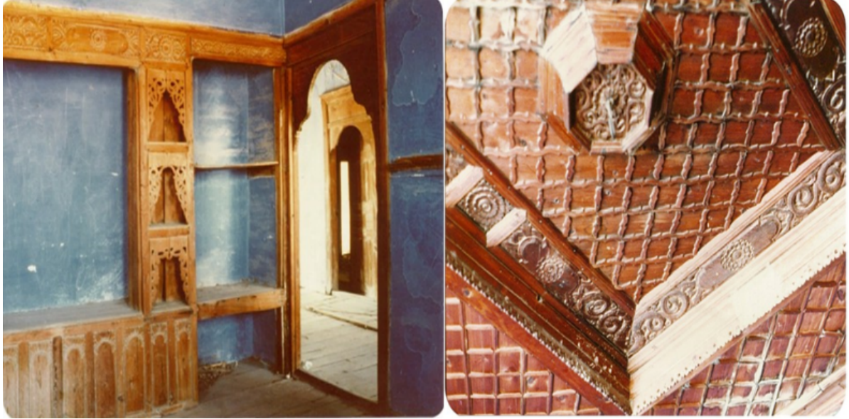
Şekil 14. Çivit mavisinin duvar yüzeyinde kullanımı ve el işçiliği (Yıldız, 1977)

Türk evinin bir başka karakteristik uygulaması, çivit mavisi denilen doğal boyanın duvar yüzeylerinde kullanılmasıdır (Şekil 14). Özellikle Kula, Milas Evleri'nin cephelerinde ve mekânlarında kullanılan, bölgeden elde edilen toprak boya ahşap donanımların arkasında inanılmaz güzellikte bir fon oluşturmaktadır. Ağır süslemeli oda tavanı, ters tekne tavan tabir edilen düzende tasarlanmıştır. Taban halısı karakterinde tavana uygulanan tavan, sedirde uzanan kişi için, seyrettiği bir tablo görünümündedir. Bordür şeklinde düzenlenen el oyması çiçek motifleri aynı düzende kapı ve dolap alınlık bölümlerinde de uygulanmıştır (Şekil 14).