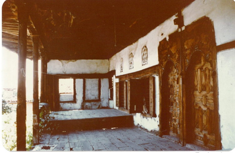
Şekil 11. Kula Kömür Evi sofa alanı (Yıldız, 1977)

Kula'da Kömür Evi olarak anılan bir başka evin sofa alanı Beyoğlu Evi'ne benzer özelliktedir. Ağır işlemeli ahşap kapılar alınlık kısımları ile ihtişamlı bir görüntü sunar (Şekil 11).