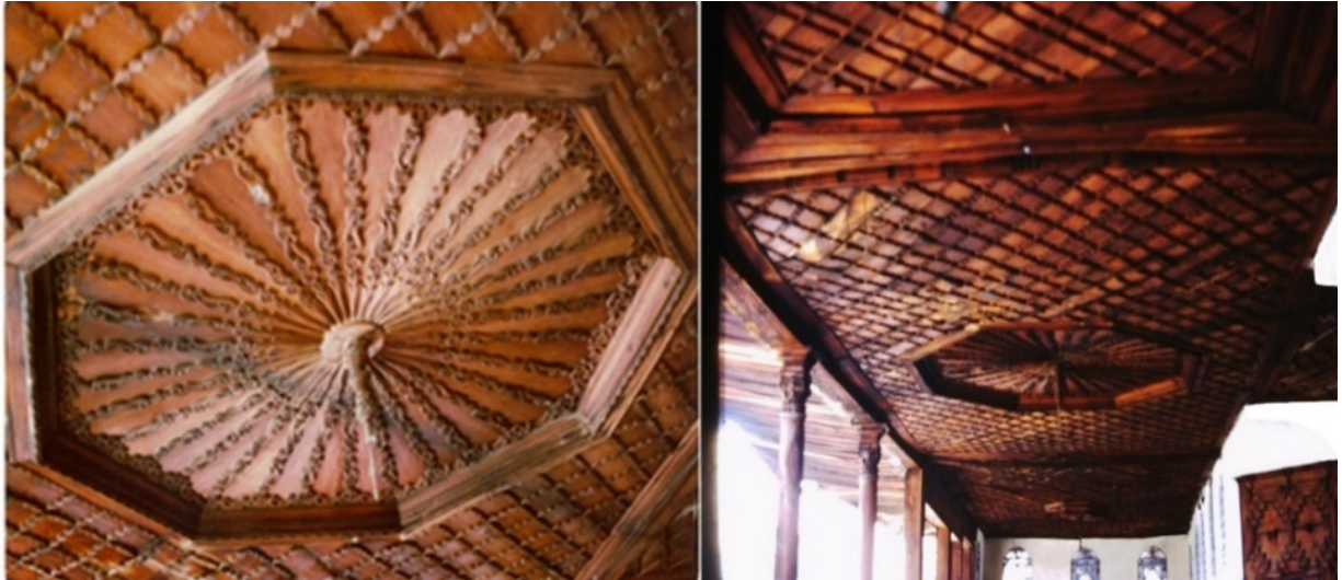
Şekil 4. Beyoğlu Evi ahşap tavan işlemleri (Yıldız, 1977)

Beyoğlu Evi'nin sofa alanında uygulanan ahşap tavanlar ağır işlemelidir (Şekil 4). Süslemeli çitalar, kalın ahşap profillerle çevrili düz ahşap kaplama zemin üzerine monte edilmiştir.