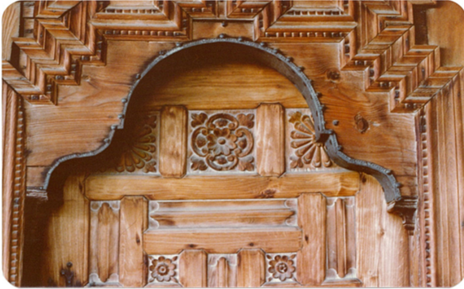
Şekil 7. Beyoğlu Evi kapı alınlıkları (Yıldız, 1977)

Kapıların alınlık bölümleri, işçiliği ve süslemeleri ile özellik taşımaktadır. Geometrik süslemeli alınlığın alt kısmında yer alan demir kasnak, iri başlı demir çivilerle ahşaba monte edilmiştir. Kendinden avadanlı ahşap kapı kanatları birbirine geçmeli kayıtlardan oluşmuştur. Kayıtların arasında ayna tabir edilen bölümler çiçek motifleri ile süslenmiştir (Şekil 7).