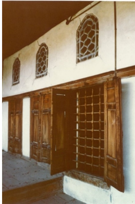
Şekil 2. Beyoğlu Evi sofa alanına bakan pencereler (Yıldız, 1977)

Beyoğlu Evi'nin 2. katında yer alan ve bahçeye bakan sofa alanı ile oda arasında yer alan pencere boşlukları, ahşap kasaya yerleştirilen geçme masif ahşap çubuklardan oluşmaktadır. Geçme kapak sistemi ile bütünleşen tasarımda, ahşabın beyaz duvar yüzeyindeki leke değeri keyifli bir ortam oluşturmaktadır (Şekil 2). Ailenin özel yaşam mekânı olan oda, bu pencere boşlukları ile ışık almakta, aynı zamanda odada oturanlarla sofa alanında oturanlar arasında diyalog ilişkisi sağlanmaktadır.