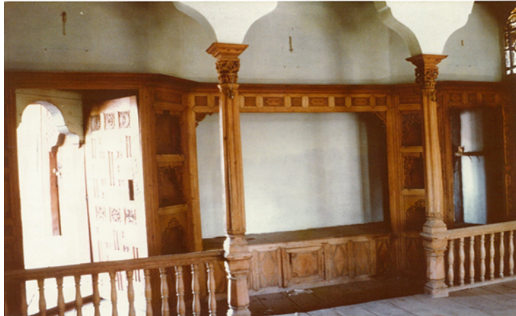
Şekil 10. Beyoğlu Evi oda cepheleri (Yıldız, 1977)

Beyoğlu Evi dolap yüzeyinde, kullanım doğrultusunda oluşan dolu-boş ilişkisi belli bir birim sistemle çözümlenmiştir (Şekil 10). Türk evinin karakteristik özelliği olan, sofa ve oda yüzeylerinde uygulanan sergen; mekân öğelerini disipline eden bir sınır olarak yüzeylerde yer alır. Kapı, pencere, dolap, ocak, gusülhane vb. donatılar, bu ahşap sınırın altında işlevsel ve estetik ilişki içindedir.