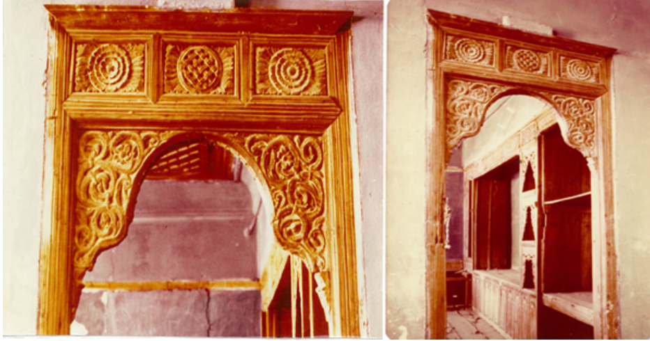
Şekil 13. Milas Evi ahşap kapı pervazları (Yıldız, 1977)

Türk evinin bir başka karakteristik uygulaması, çivit mavisi denilen doğal boyanın duvar yüzeylerinde kullanılmasıdır (Şekil 14). Özellikle Kula, Milas Evleri'nin cephelerinde ve mekânlarında kullanılan, bölgeden elde edilen toprak boya ahşap donanımların arkasında inanılmaz güzellikte bir fon oluşturmaktadır. Ağır süslemeli oda tavanı, ters tekne tavan tabir edilen düzende tasarlanmıştır. Taban halısı karakterinde tavana uygulanan tavan, sedirde uzanan kişi için, seyrettiği bir tablo görünümündedir. Bordür şeklinde düzenlenen el oyması çiçek motifleri aynı düzende kapı ve dolap alınlık bölümlerinde de uygulanmıştır (Şekil 14).