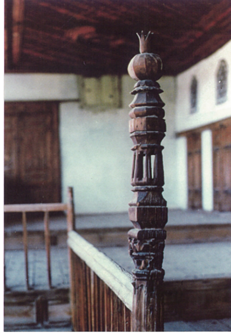
Şekil 1. Merdiven babası (Yıldız, 1977)

Beyoğlu Evi'nin 2. katında yer alan ve bahçeye bakan sofa alanı ile oda arasında yer alan pencere boşlukları, ahşap kasaya yerleştirilen geçme masif ahşap çubuklardan oluşmaktadır. Geçme kapak sistemi ile bütünleşen tasarımda, ahşabın beyaz duvar yüzeyindeki leke değeri keyifli bir ortam oluşturmaktadır (Şekil 2). Ailenin özel yaşam mekânı olan oda, bu pencere boşlukları ile ışık almakta, aynı zamanda odada oturanlarla sofa alanında oturanlar arasında diyalog ilişkisi sağlanmaktadır.