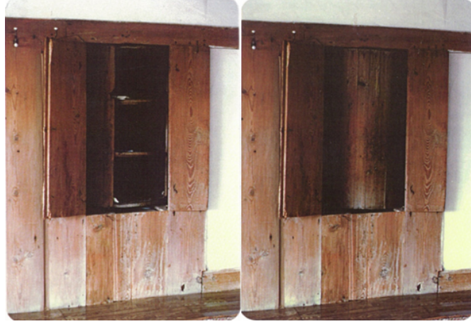
Şekil 8. Beyoğlu Evi ahşap dönme dolap (Yıldız, 1977)

Türk evi bir sistemler bütünüdür. Bu sistem ilişkisi, yapının dış kabuğundan mekânlar arası ilişkiye ve tüm donatıların yüzey tasarımında kendini ifade etmektedir (Şekil 9).