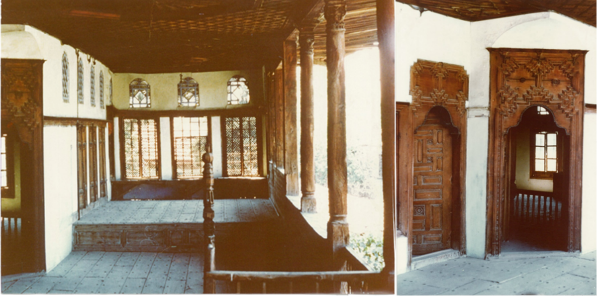
Şekil 5. Beyoğlu Evi sofa alanı ve sofa alanından odalara giriş kapıları (Yıldız, 1977)

Sofa alanından odalara girişte bir tablo görünümünde yer alan süslemeli kapılar, hiyerarşik bir ilişki içindedir. Kapıya yüklenen simgesel anlam, kapının boyutu ve süslemesi ile kendisini ifade eder. Büyük olan başoda kapısındaki özenli işçilik, mekânın içinde yer alan dolap, tavan vb. donanımlarda da aynı özenle devam etmektedir (Şekil 5).