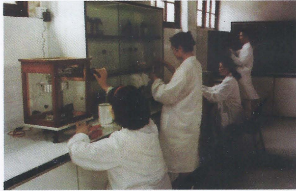
Foto. 1. 2. 3- Suzhou İpek Müzesi, Restorasyon laboratuvarı, Ö. Aydın - 2007