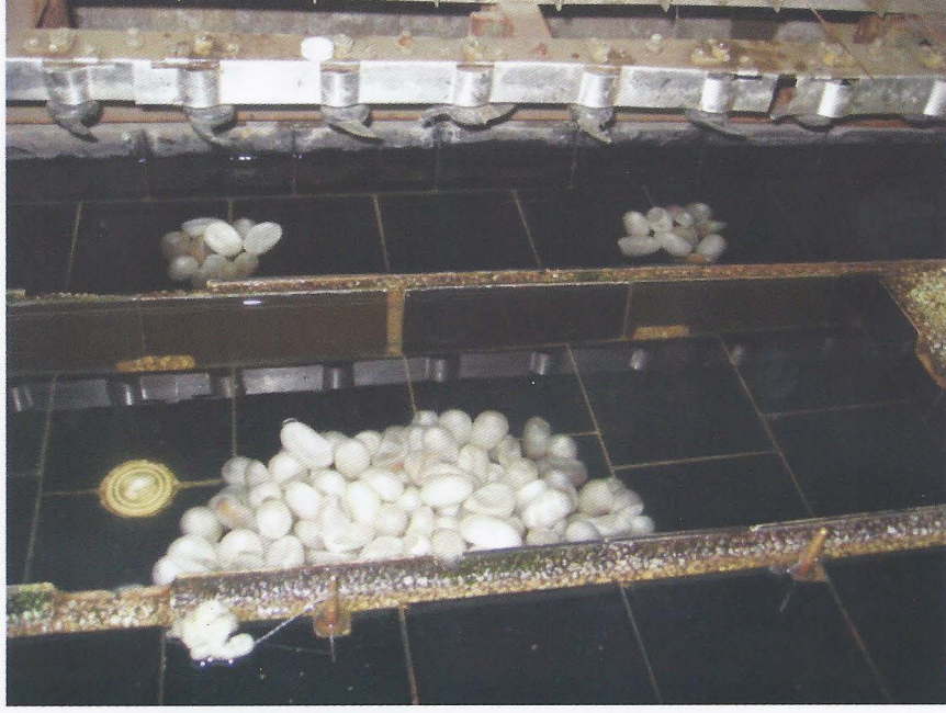
Foto. 6- Suzhou İpek Müzesi, İpek böceđi kozasının iplik haline dönüřtürölme aşaması, Ö. Aydın - 2007