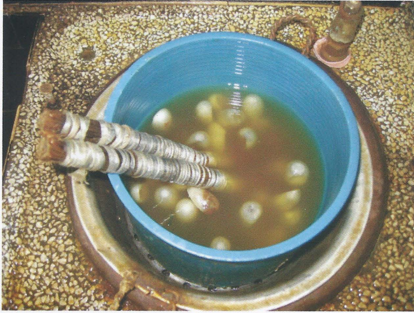
Foto. 5- Suzhou İpek Müzesi, İpek böceği kozasının ıslatılması, Ö. Aydın - 2007