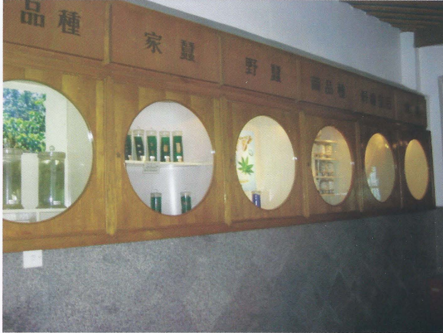
Foto. 13- Suzhou İpek Müzesi, Kültür holü