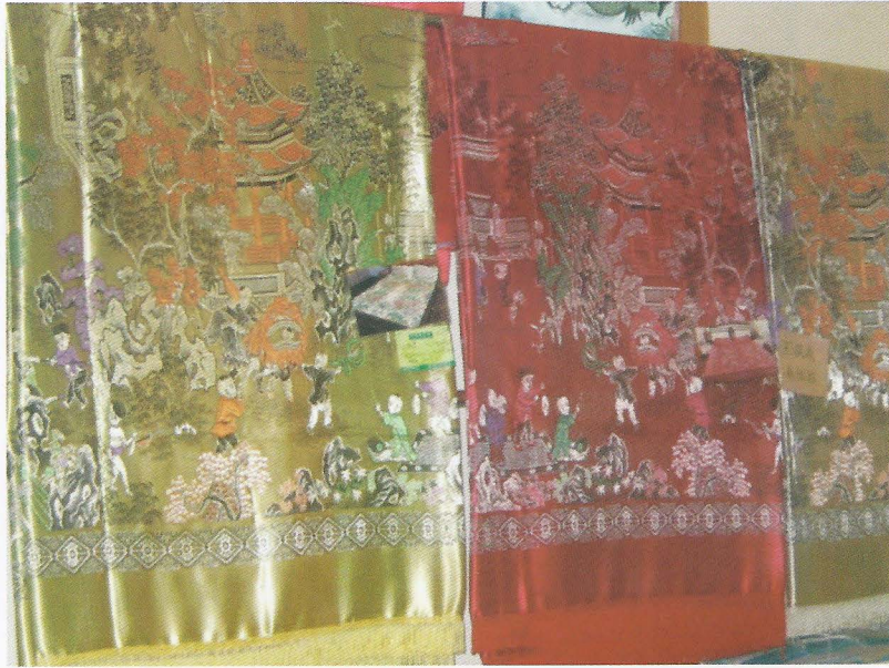
Foto. 14- Suzhou İpek Müzesindeki eski dokumaların yeniden üretilmiş örnekleri, Ö. Aydın - 2007