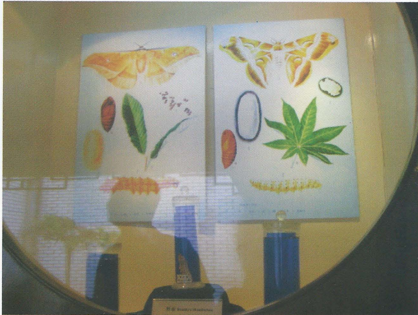
Foto. 9- Suzhou İpek Müzesi, Mulbery Yaprakları