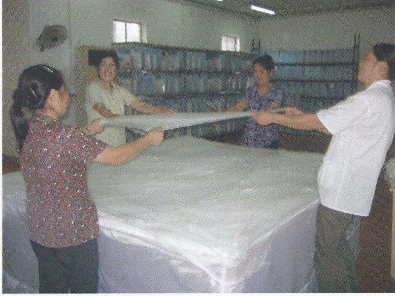
Foto. 14- Suzhou İpek Müzesi, İpek film tabakalarının dörtkişi tarafından çekilmesi, Ö. Aydın - 2007