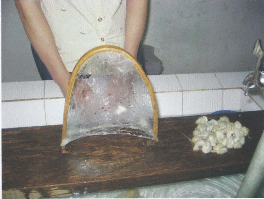
Foto. 7- Suzhou İpek Müzesi, İpek böceđi kozasının ıslatıldıktan sonra kasnađa gerilmesi, Ö. Aydın - 2007