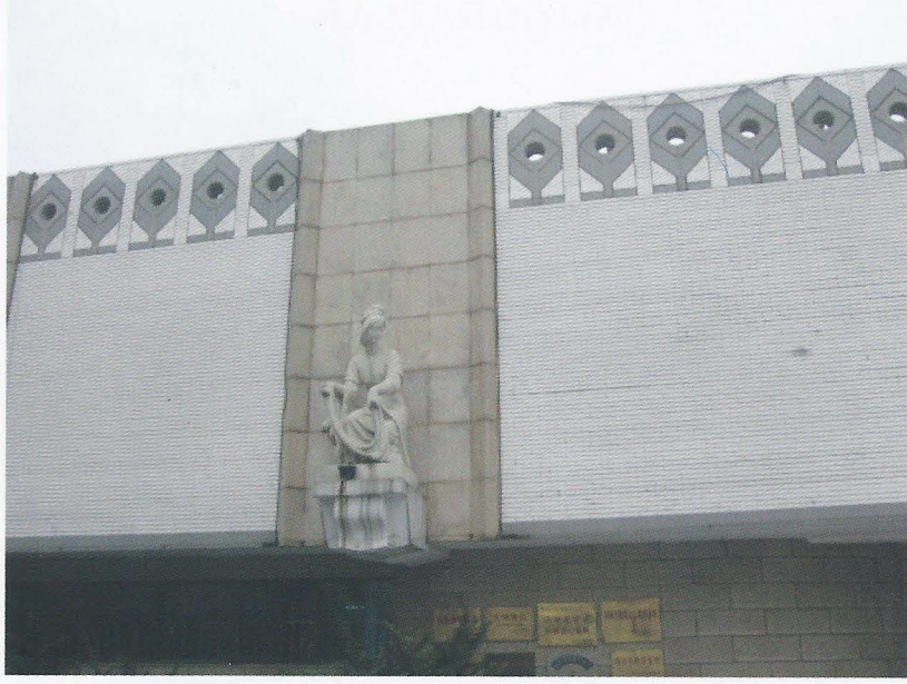
Foto. 4- Suzhou İpek Müzesi