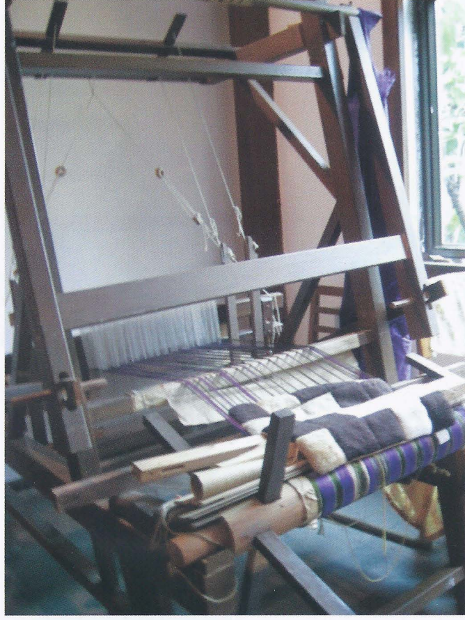
Foto. 10- Suzhou İpek Müzesi, Dokuma Tezgahı