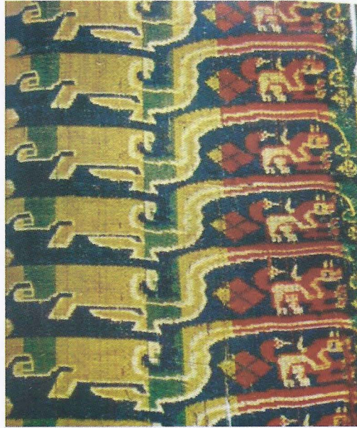
Foto. 11- Suzhou İpek Müzesi, Çin karakterli ipek parçası, Ö. Aydın - 2007