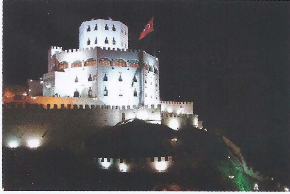
Foto. 2- Estergon Türk Kültür Merkezi