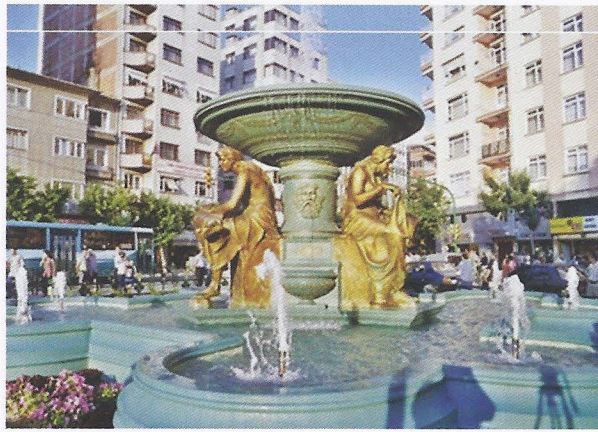
Foto. 3- Havuz içinde heykel