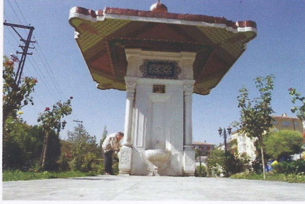
Foto. 1- Osmanlı Çeşmesi