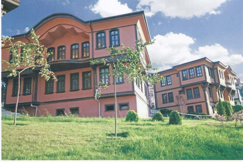
Foto. 4- Tarihi Odunpazarı Evleri