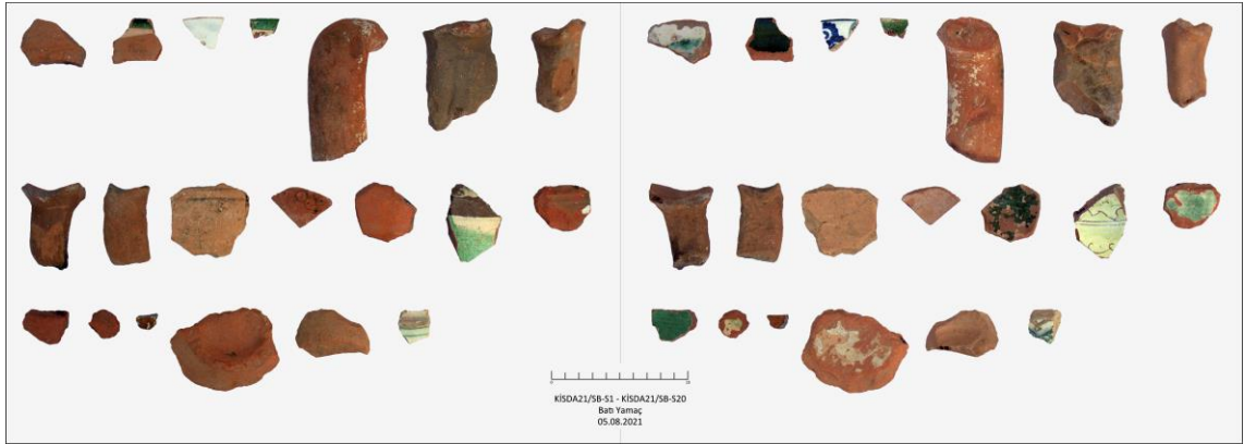
Fig. 4. Soğucak Mahallesi'nin Batı Eteklerinde Bulunan Bizans ve Osmanlı Dönemlerine Tarihlendirilen Seramik Parçalarından Örnekler