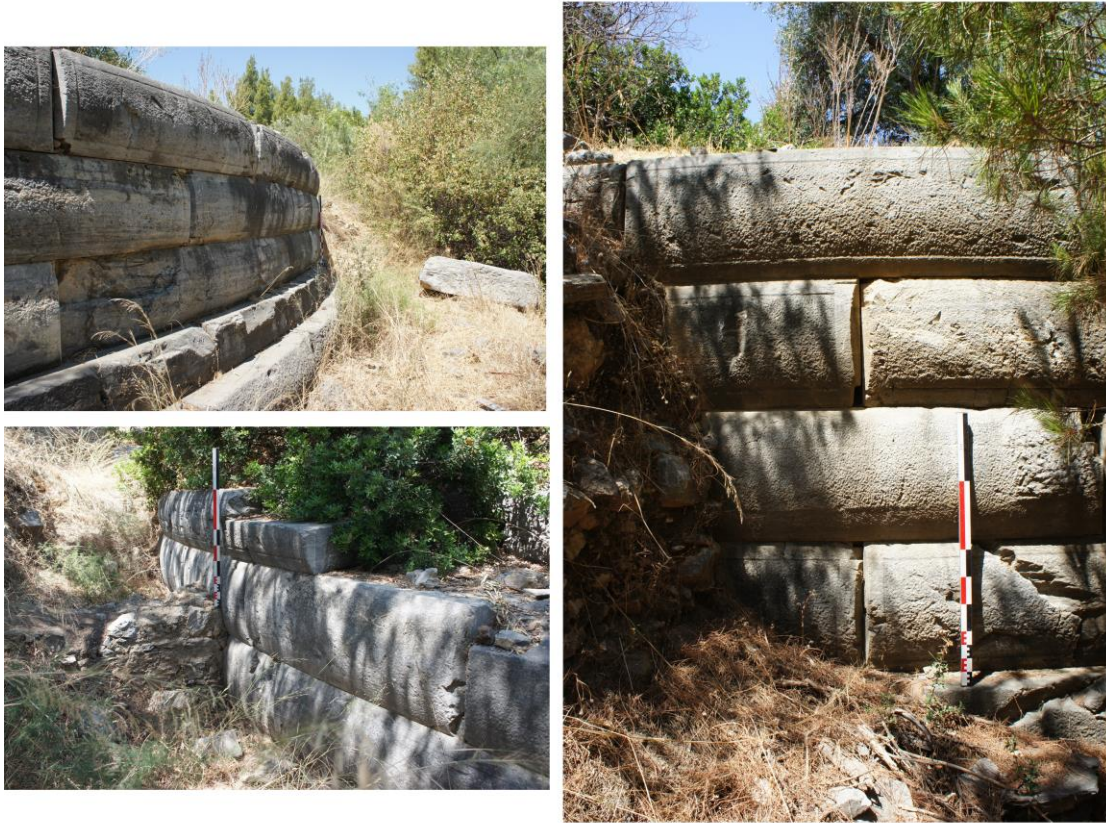
Fig. 17. Tümülüs Duvarından Genel ve Detay Görüntüler

Pygela Antik Kenti'nin kurulu olduğu arazi ve kalıntılar incelendiğinde yerleşimin bir liman kenti mantığıyla oluşturulduğu anlaşılmaktadır. Yerleşimin kuzeyinde Adagöl civarında yapılan araştırmalarda liman kalıntıları tespit edilmiştir. Ana kayaya oyulmuş mekanların erken dönemlerden başlayarak Bizans Dönemi'ne kadar kullanıldığı anlaşılmaktadır.