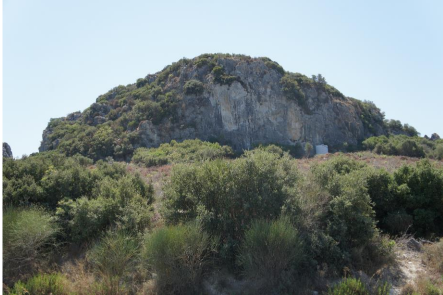
Fig. 22. Çataltaş Mevkii'nin Genel Görünüşü

Çataltaş Mevkii olarak adlandırılan arazi Kırkayak Merdiven Tepesi'nin güneyinde yer almaktadır. Kuşadası sınırları içerisinde erken dönem iskan konusunda önemli buluntular veren yerleşim alanlarından bir tanesidir 32 . Arazide kuzeybatı-güneydoğu yönünde iki kayalık alan bulunmaktadır. (Fig. 22). Çataltaş Mevkii'nde geçmiş yıllarda gerçekleştirilen araştırmalarda MÖ 3. binyıldan başlayan buluntularla karşılaşmıştır 33 . 2021 yılı çalışmaları sırasında yüzeyde Kalkolitik Çağ'a ve MÖ 6.-5. yüzyıl arasına tarihlendirilen seramik parçaları tespit edilmiştir (Fig. 23). Kalkolitik Çağ'a tarihlendirilen seramikler güneydoğudaki kayalık alanın içerisinde ve çevresinde bulunmuştur. Söz konusu seramikler bölgenin Kalkolitik Çağ iskanına katkı sağlaması açısından oldukça önemlidir.