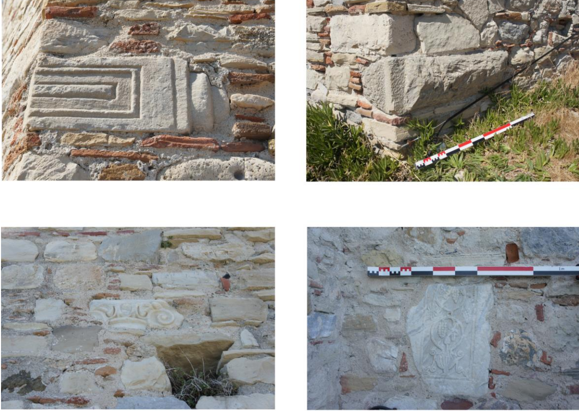
Fig. 13. Güvercinada Kalesi'nin İnşasında Kullanılan Devşirme Parçalardan Örnekler

2021 çalışmaları sırasında kalenin kurulu olduğu ada ve çevresi detaylı olarak araştırılmıştır. Güvercinada'nın surlarında ve kalenin duvarlarında devşirme olarak kullanılmış çok sayıda mimari yapı parçası tespit edilmiştir (Fig. 13). Ada üzerinde yapılan incelemelerde bir adet geç döneme tarihleyebileceğimiz sırlı seramik parçası bulunmuştur.