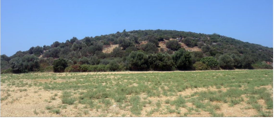
Fig. 5. Ilıca Tepe'nin Genel Görünüşü

Tepe'nin zirvesinde iki adet dikdörtgen planlı yapı temel kalıntıları bulunmuştur. M1 ve M2 olarak adlandırılan alanların işlevi konusunda bir şey söylemek oldukça zordur. Ilıca Tepe'nin doğu eteklerinde geç dönem iskanını kanıtlayan yeşil ve kahverengi sırlı seramik parçaları ile çatı kiremidi parçaları saptanmıştır. Söz konusu seramikler form ve bezeme özellikleri dikkate alınarak MS 13. yüzyılın ikinci yarısına tarihlendirilmiştir.