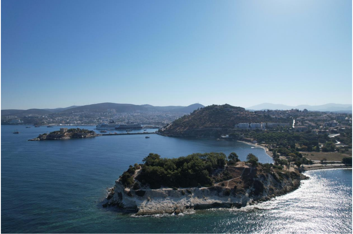
Fig. 7. Yılandıcı Burnu Mevkii'nin Genel Görünüşü

Marathesion'a 13 ait olabileceğini iddia etmektedirler. Neopolis ve Marathesion kentlerinin lokalizasyonu hala kesin değildir. Yüzey araştırması çalışmalarımızın ana hedeflerinden bir tanesi lokalizasyon sorununu çözmektir. Bu amaçla Yılandıcı Burnu çevresindeki çalışmalara daha fazla önem verilmiştir.