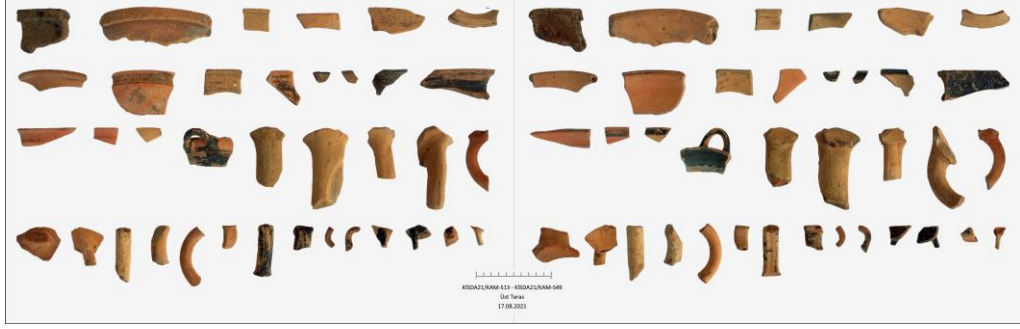
Fig. 21. Kırkayak Merdiven Tepesi Mevkii'nde Bulunan Seramiklerden Örnekler