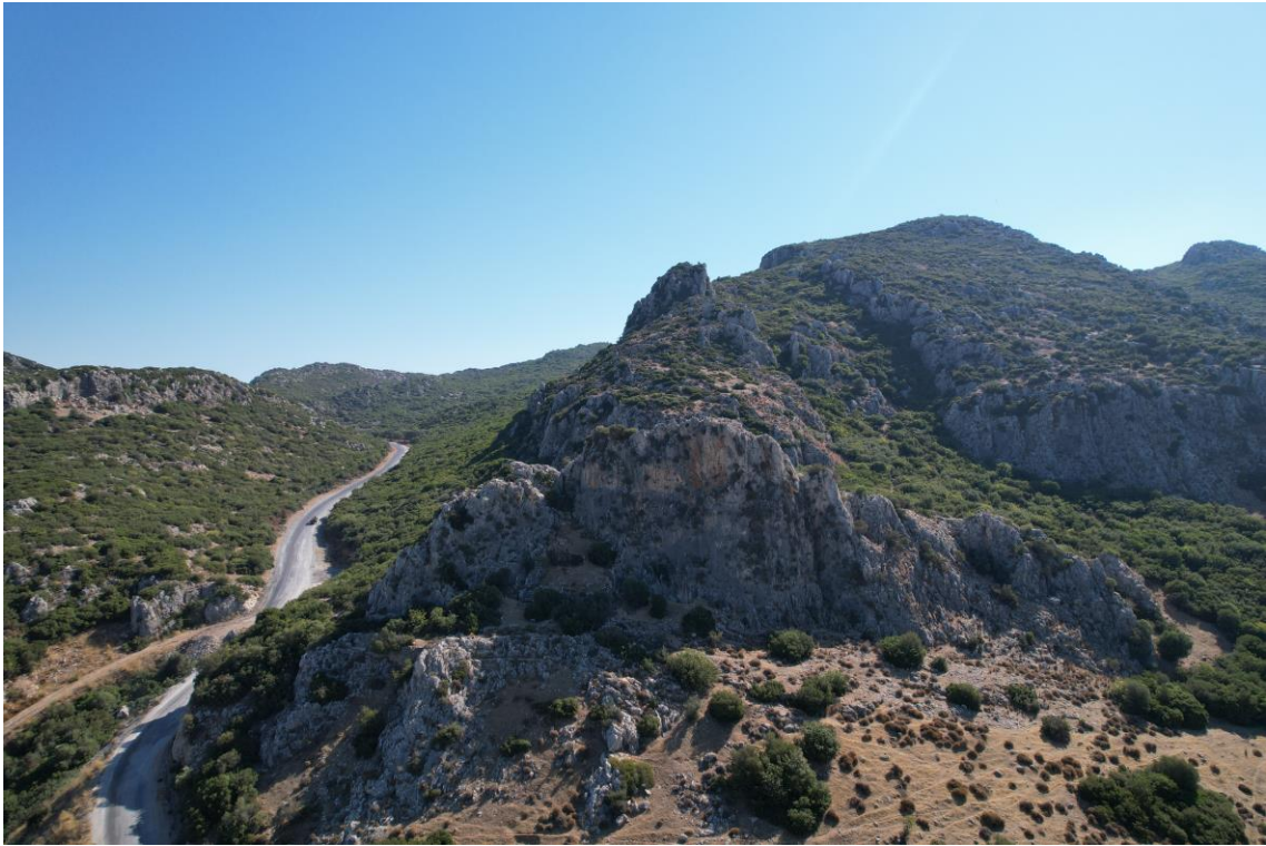
Fig. 18. Kırkayak Merdiven Tepesi'nin Genel Görünüşü

Kırkayak Merdiven Tepesi, Kirazlı Mahallesi'nden Yaylaköy'e bağlanan yolun doğusundaki Sırca Tepe eteklerindeki kayalık alan üzerinde yer almaktadır (Fig. 18). Kuşadası Körfezi'ne hâkim bir noktada yer alan kalıntı ve buluntular bölge tarihi açısından oldukça önemlidir. Oldukça stratejik bir noktada yer alan yerleşim bölgede geçmiş yıllarda incelemeler gerçekleştirmiş olan araştırmacıların da ilgisini çekmiştir. J. Keil 26 , S. Günel 27 ve İ. Gezgin-L. Kutbay 28 Kırkayak Merdiven Tepesi'nde incelemelerde bulunmuşlardır. Söz konusu araştırmacıların önemli bir bölümü Kırkayak Merdiven Tepesi kalıntı ve buluntularını Hellenistik, Roma ve Bizans dönemlerine tarihlendirmişlerdir.