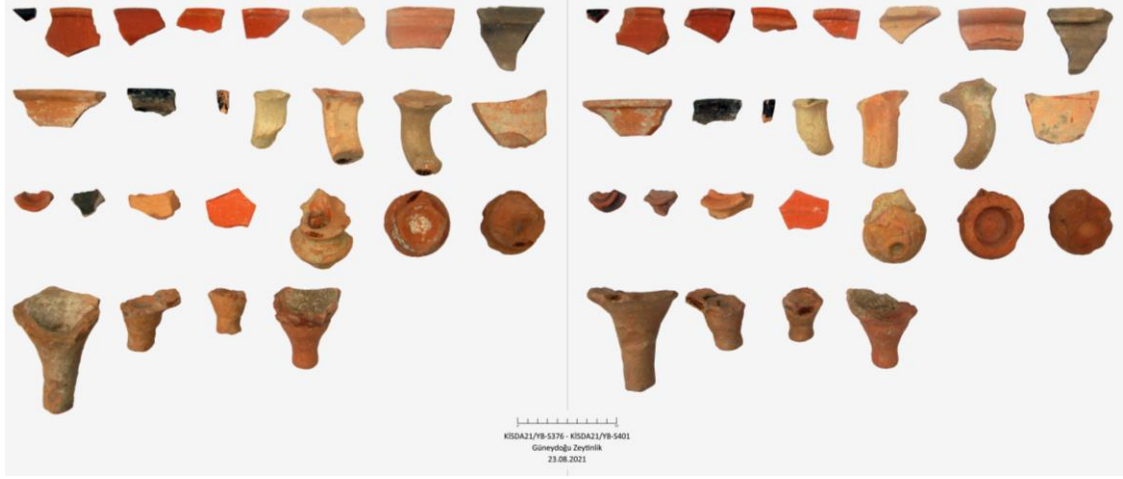
Fig. 10. Yılanıcı Burnu'nun Güneydoğusunda Bulunan Seramiklerden Örnekler

sırasında çok sayıda seramik parçası ile karşılaşmıştır. MÖ 6.-5. yüzyıl, Hellenistik, Roma ve Bizans dönemlerine tarihlendirilen buluntuların önemli bir bölümünü yine Roma Dönemi seramikleri oluşturmaktadır (Fig. 10). Hellenistik Dönem'den başlayarak iskanın yarımadanın doğusuna doğru kaydığı anlaşılmaktadır. Yerleşimin doğu yönündeki sınırını tespit etmek amacıyla çalışmalar Sevda Tepesi'ne kaydırılmıştır. Söz konusu alanda az sayıda Bizans Dönemi'ne tarihlendirilen seramik, çatı kiremidi ve cam bilezik parçalarına rastlanılmıştır.