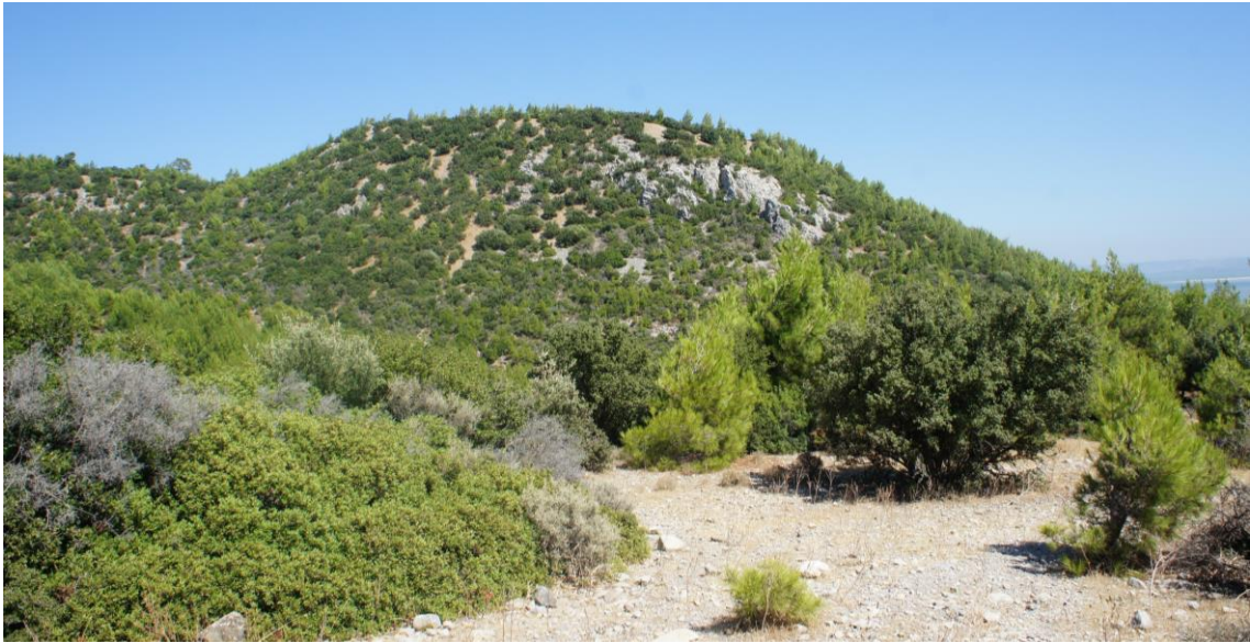
Fig. 26. Thebai'nin Genel Görünüşü

Thebai Antik Kenti Samsun (Mykale) Dağı'nın güneybatısında yer almaktadır. Denizden yaklaşık olarak 2 km uzaklıkta yer alan yerleşimin oldukça korunaklı bir arazi üzerinde inşa edildiği anlaşılmaktadır (Fig. 26). Thebai yüzey araştırması çalışmalarımızın ilk sezonunda incelenmeye başlanmıştır 37 . Samsun (Mykale) Dağı üzerindeki "Kar Tipi" yerleşimlere güzel bir örnektir. Kurulduğu alan ve kalıntılar dikkate alındığında erken bir yerleşim alanı olması muhtemeldir. Bölgede geçmiş yıllarda çalışmalar gerçekleştiren araştırmacılar Thebai'yi küçük bir kent olarak tanımlamışlardır. H. Lohmann Mykale araştırmaları sırasında kentte incelemelerde bulunmuştur 38 .