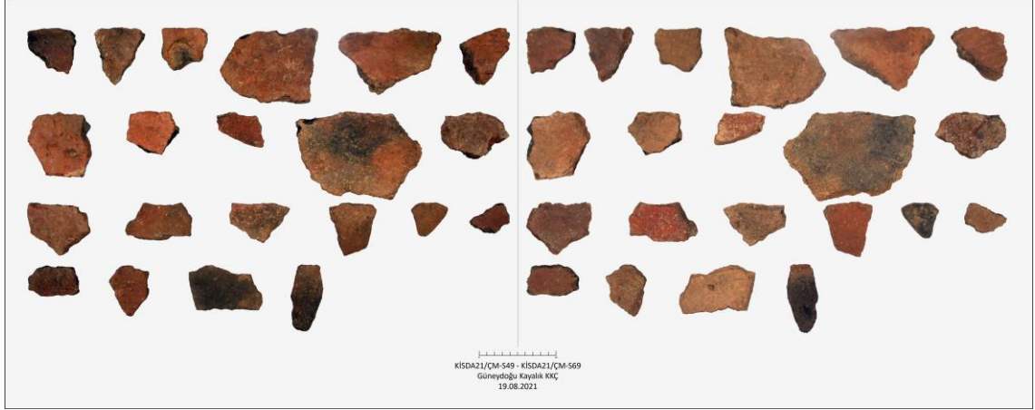
Fig. 23. Çataltaş Mevkii'nde Bulunan Seramiklerden Örnekler