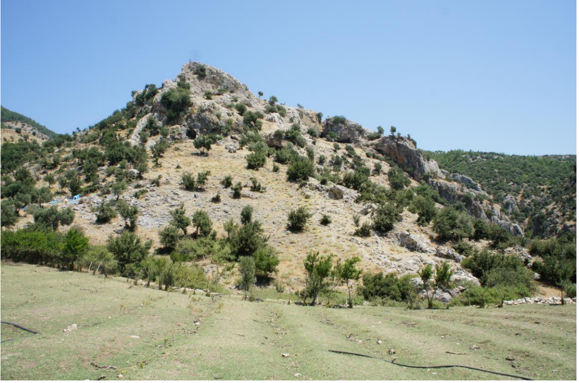
Fig. 24. Atburgazı Lamba Tepe Mevkii'nin Genel GörünüŖü