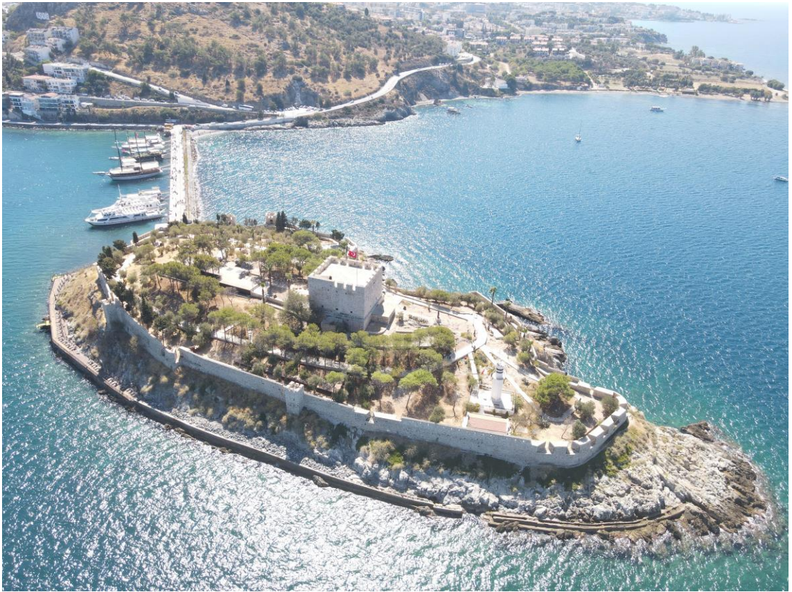
Fig. 12. Güvercinada Kalesi'nin Genel Görünüşü.