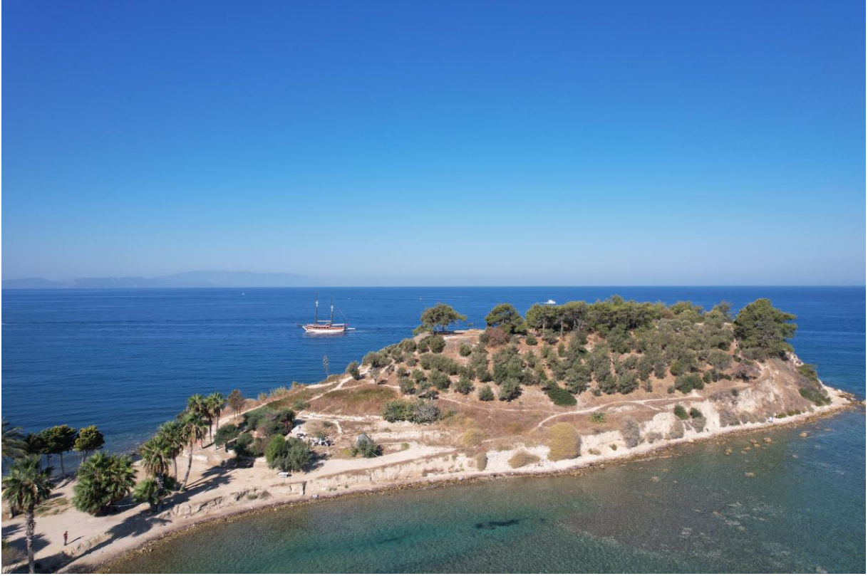
Fig. 8. Yılanıcı Burnu Mevkii'nin Genel Görünüşü

etmiştir 14 . Fakat C. Özgünel'in söz konusu seramiğin Yılanıcı Burnu'ndan olduğuna dair şüpheleri vardır 15 .