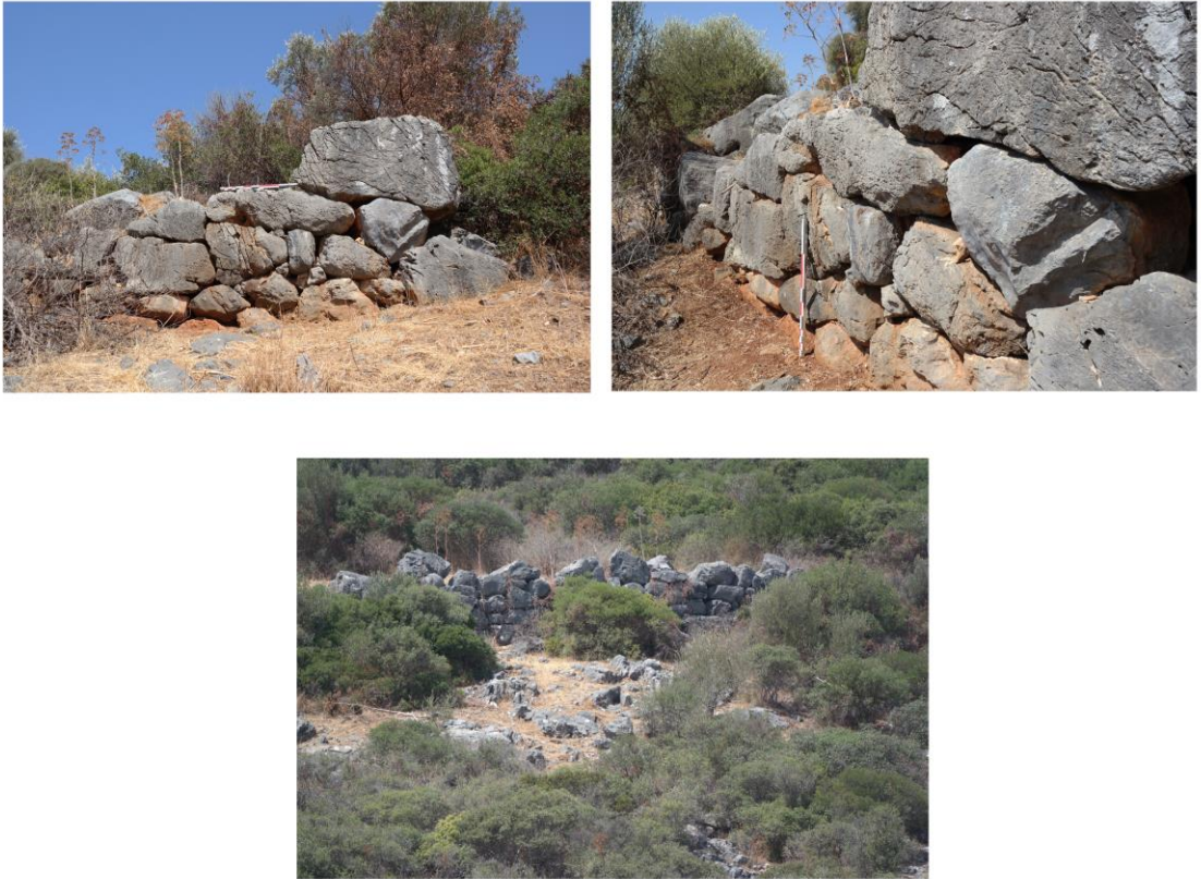
Fig. 6. Ilıca Tepe Surlarından Görüntüler