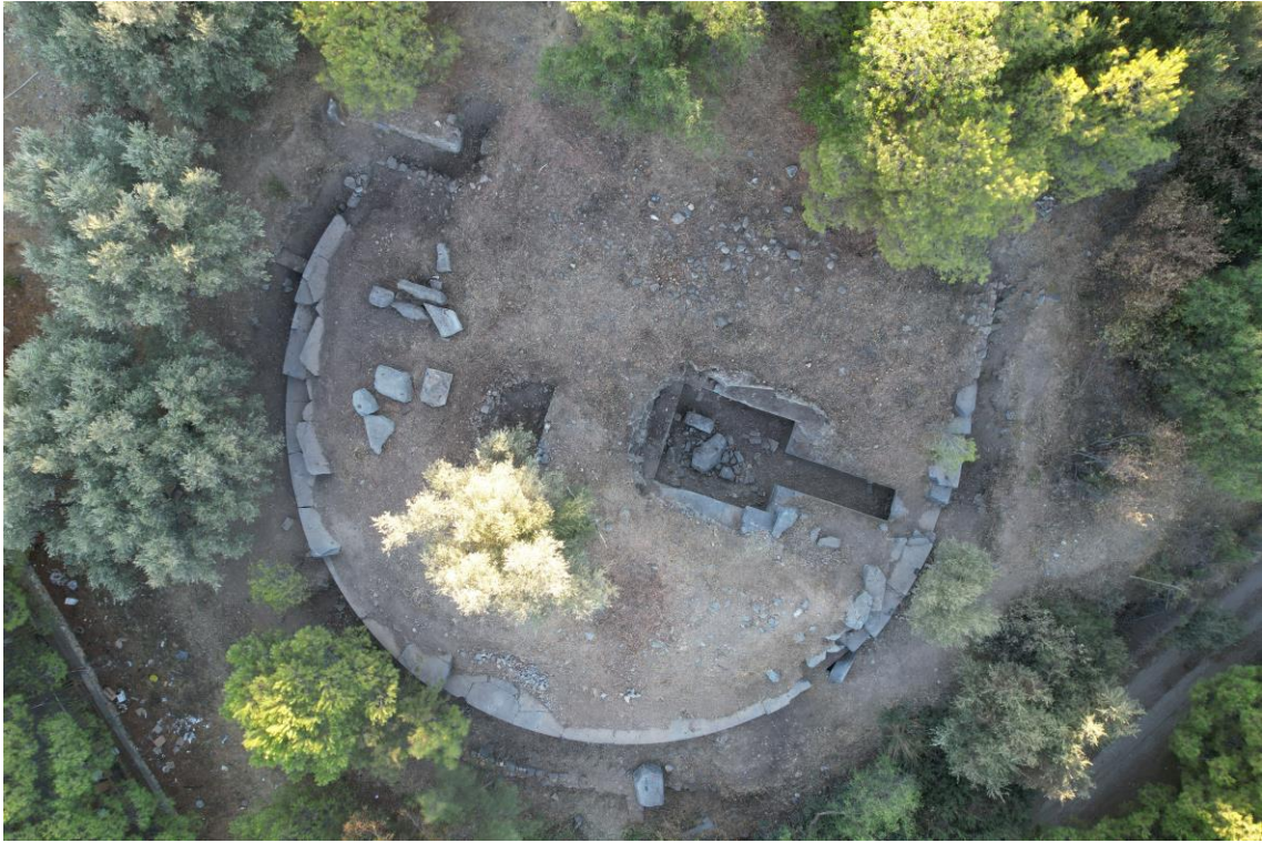
Fig. 16. Kuştur Tümülüsü'nün Havadan Genel Görünüşü

Höyük alanının batı eteğinde Hellenistik Dönem'e tarihlendirilen oldukça iyi durumda korunmuş bir tümülüs kalıntısı bulunmaktadır (Fig. 16). "Kuştur Tümülüsü 22 " olarak adlandırılan yapının bosajlı çevre duvarları oldukça dikkat çekicidir (Fig. 17). Dromos ve mezar odasının duvar işçiliği de oldukça kalitelidir. Tümülüs ve çevresinin geç dönemlerde iskân için tercih edildiği anlaşılmaktadır. Yapının üzerinde ve çevresinde tespit edilen harçlı duvar kalıntıları bu durumu kanıtlamaktadır. Kuştur Tümülüsü'nde ayrıntılı fotoğraflama ve belgeleme çalışmaları yapılmıştır 23 . Höyüğün Hellenistik ve Roma dönemlerinde bir nekropol alanı olarak kullanıldığı anlaşılmaktadır. Höyüğün kuzey eteğinde Roma Dönemi'ne tarihlendirebileceğimiz ana kayaya oyulmuş bir oda mezar kalıntısı bulunmaktadır 24 . Söz konusu alanda da gerekli belgeleme çalışmaları yapılmıştır.