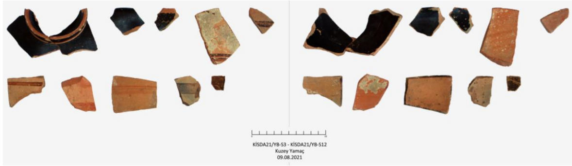
Fig. 9. Yılanıcı Burnu Kuzey Yamaç Buluntusu Seramiklerden Örnekler

Yılanıcı Burnu Mevkii'ndeki yerleşim yarımadasının doğusuna doğru uzanmaktadır. Günümüzde plaj olarak kullanılan bölümde yapılan incelemeler sırasında sahil kenarına yakın toprak kesitlerinde çok sayıda seramik parçası tespit edilmiştir. Seramik parçalarının önemli bir bölümü Roma Dönemi'ne tarihlendirilmiştir. Söz konusu toprak kesitlerinde az sayıda MÖ 6.-4. yüzyıl arasına tarihlendirebileceğimiz seramik parçaları da bulunmaktadır. Yine yarımadanın güneybatısında yapılan incelemeler