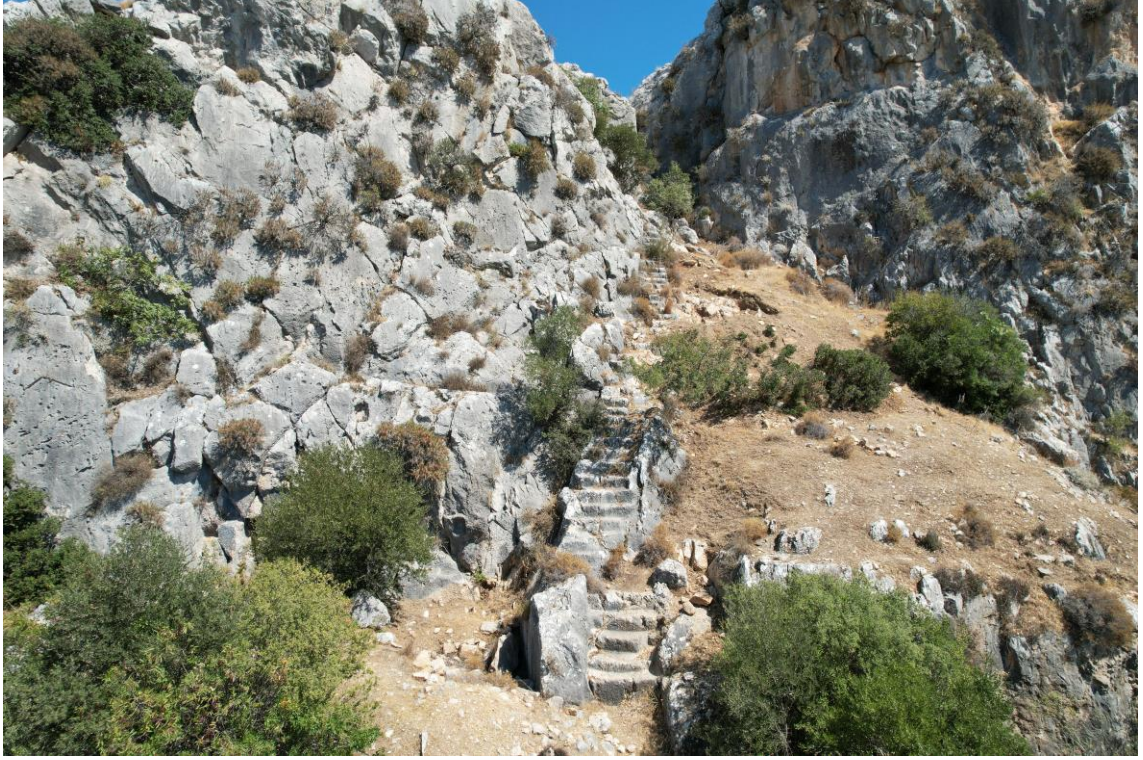
Fig. 20. Merdivenden Genel Görüntü

Araziyi batı yönünden sınırlayan kayalık alanın doğusunda MÖ 13. yüzyıla tarihlendirilen seramik parçaları bulunmuştur. Seramik buluntuları yerleşimin en azından Son Tunç Çağı'ndan itibaren iskân gördüğünü kanıtlar niteliktedir. Kırkayak Merdiven Tepesi ve çevresinde yapılan incelemelerde Son Tunç Çağı, Erken Demir Çağı ve MÖ 6.-5. yüzyıl arasına tarihlendirilen seramik parçaları bulunmuştur (Fig. 21). Söz konusu seramiklerin önemli bir bölümünü MÖ 6.-5. yüzyıl arasına tarihlendirilen parçalar oluşturmaktadır. Kırkayak Merdiven Tepesi'nde geçmişte gerçekleştirilen araştırmalarda en erken Hellenistik Dönem buluntuları ile karşılaşıldığı anlaşılmaktadır. 2021 yılı çalışmaları buluntuları yerleşimdeki iskanı bilinenden çok daha erkene çekmesi bakımından oldukça önemlidir 30 .