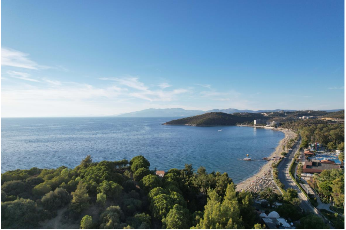
Fig. 14. Pygela Antik Kenti'nin Kurulu Olduđu Arazinin Genel Gornş