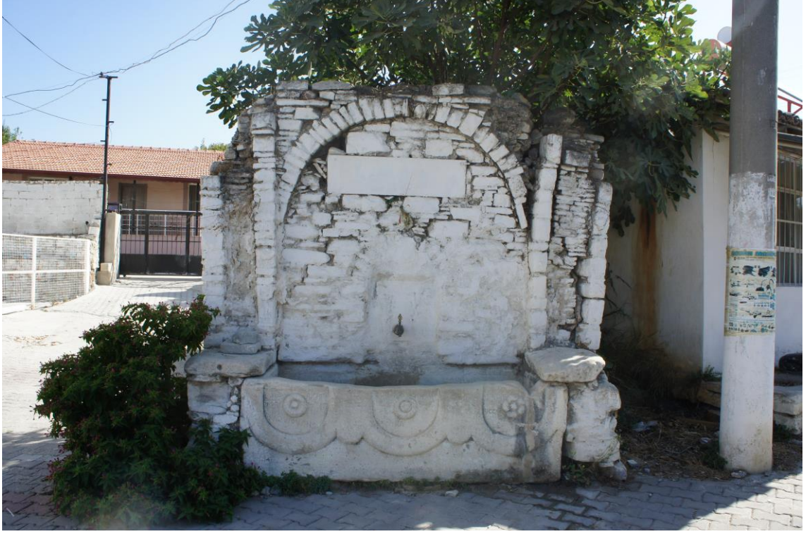
Fig. 3. Soğucak Mahallesi Meydanındaki Çeşmenin Genel Görünüşü