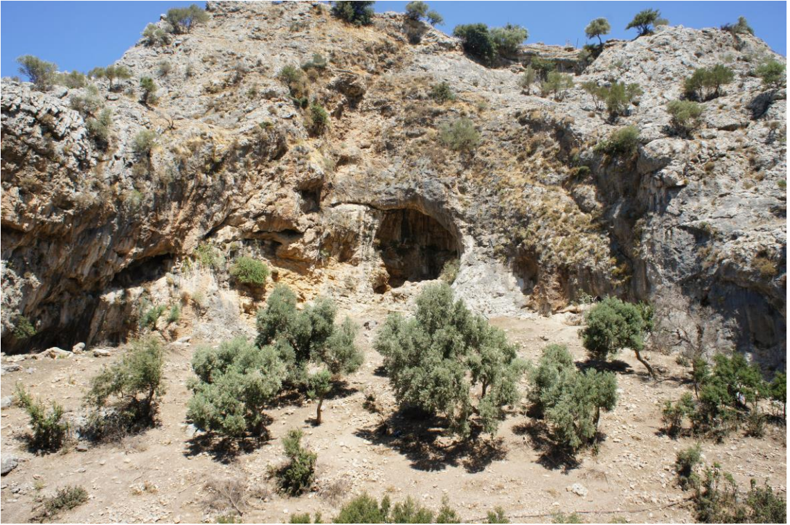
Fig. 25. Atburgazı Lamba Tepe Mevkii 2021 Yılı AraŖtırma Alanının Genel GörünüŖü