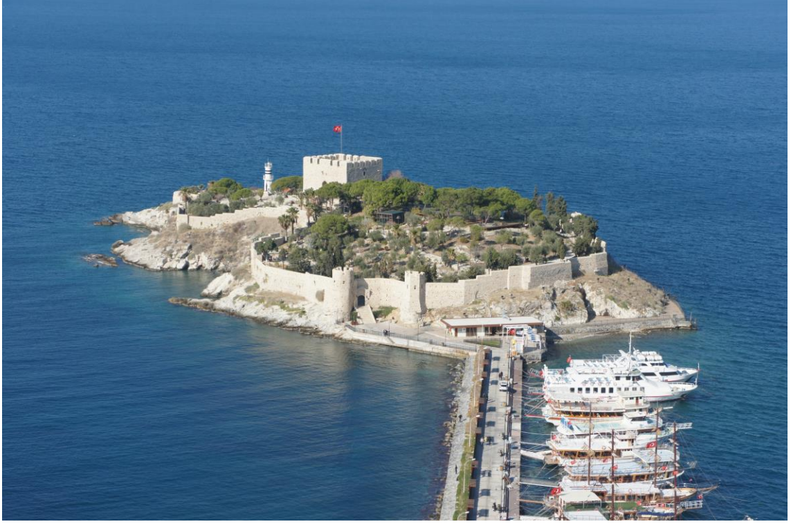
Fig. 11. Güvercinada Kalesi'nin Genel Görünüşü