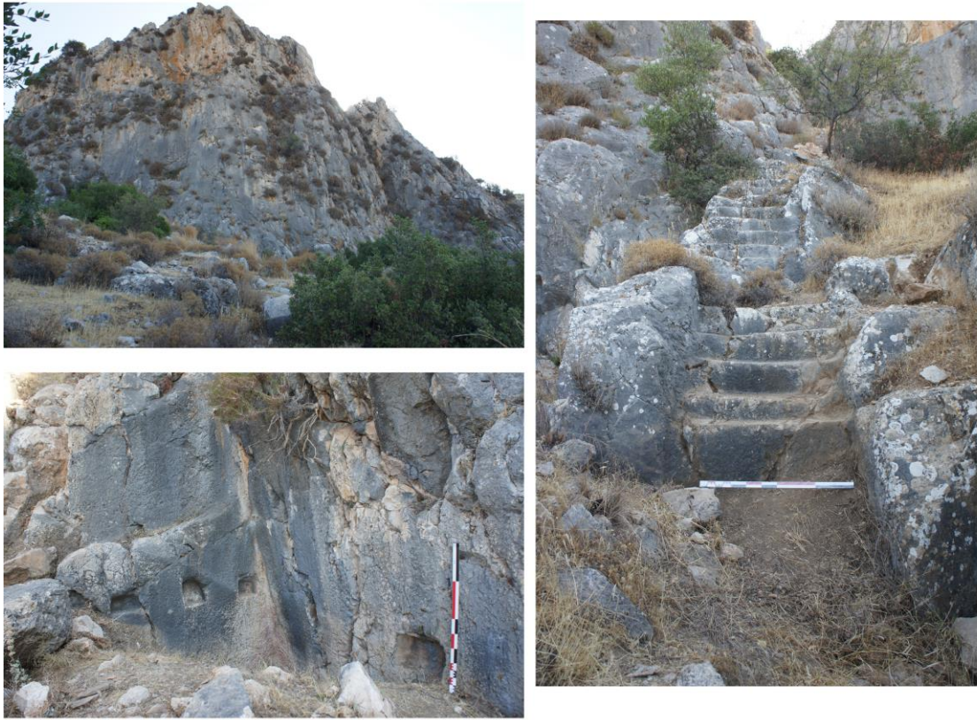
Fig. 19. Kırkayak Merdiven Tepesi'nden Genel ve Detay Görüntüler

batısında ana kaya oyularak mekanlar oluşturulduğu tespit edilmiştir. Bu bölümde üç farklı mekânın olduğu anlaşılmaktadır. M1 ve M3 olarak adlandırılan mekanların arkasında ana kaya üzerinde ahşap hatıl yuvalarının girmesi için alanlar oluşturulmuştur. Mekanların içerisinde nişler yer almaktadır. Söz konusu nişlerin konumu kayalık alanın batısının bir açık hava kutsal alanı olarak kullanıldığını kanıtlar niteliktedir. Batıdaki kayalık alanın ortasına yakın bir noktada kayalığın zirvesine ulaşmak için kullanılan ana kayaya oyularak yapılmış merdiven kalıntıları yer almaktadır (Fig. 20). Yöre halkı merdiven kalıntıları nedeniyle alanı “Kırkayak Merdiven Tepesi” olarak adlandırmıştır. Merdiven kalıntılarının kuzeyindeki kayalık alanda da nişli mekanların olduğu anlaşılmaktadır. Arazinin merdivenle çıkılan bölümünde üç farklı seviyedeki tepe üzerinde mekanların olduğu tespit edilmiştir. Arazinin batı eteğinde ve zirvedeki kayalık alanların çevresinde Hellenistik Dönem’e tarihlendirilen bosajlı duvarlar tespit edilmiştir. Söz konusu duvarlar alanın Hellenistik Dönem’de bir garnizon olarak kullanıldığını kanıtlar niteliktedir. Bölgede geçmiş yıllarda incelemeler gerçekleştiren araştırmacılar da bu duruma dikkat çekmişlerdir 29 .