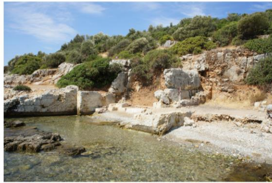
Fig. 15. Pygela Antik Kenti'nin Kurulu Olduđu Arazi ve Limandan Gorntler