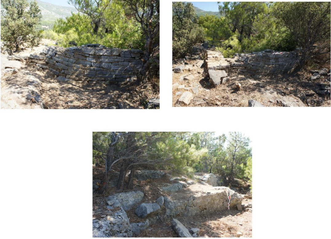
Fig. 27. Thebai Akropol Tepesi Mimari Yapı Kalıntılarında Görüntüler

tarihlendirebileceğimiz seramik parçaları bulunmuştur. Yine aynı alanda sikke 39 ve pişmiş toprak ağırlık buluntuları tespit edilmiştir (Fig. 28).