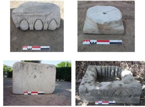
Fig. 2. Soğucak Mahallesi'nde tespit edilen mimari parçalardan örnekler