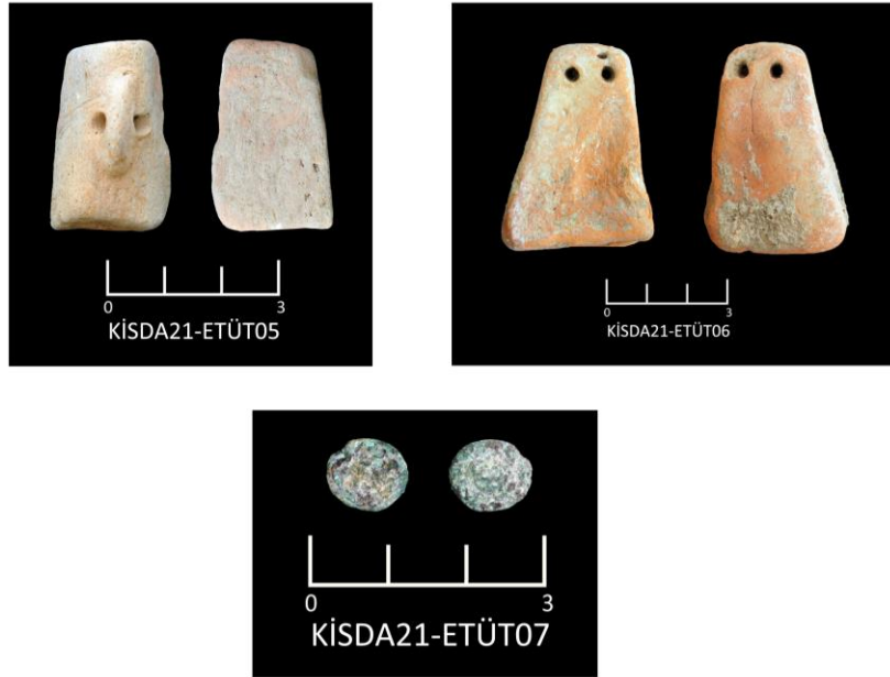
Fig. 28. Thebai Buluntusu Eserler