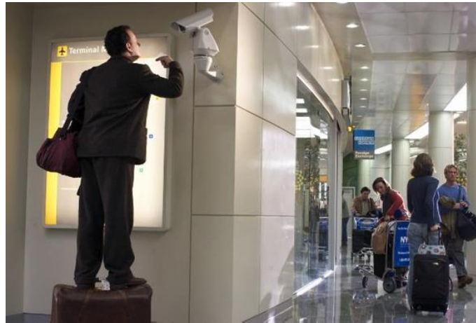
Şekil 9. Havalimanında Görülmek (Guttridge & Sharman, 2022)

Yok-yerde oluşan yakın çevredeki boyut sorunları da filmde dikkati çeken bir diğer unsurdur. İnsani eylemlerin gerçekleştirilmesinin yanında kontrolün ve güvenliğin de sürekli sağlanmaya çalışıldığı mekanlarda görmek ve görülmek önemli bir sorun haline gelmiştir. Bu tür mekanlarda yerin belirleyiciliğinin ortadan kalkmasıyla ‘güvenlik’ diğer tüm bileşenlerden daha önemli hale gelmiştir (Foucault, 1995). Bu durumda mekânın kullanıcı güvenlik unsurunu kullanarak mekanla ilişki kurmaya başlamış, güvenlik unsurları mekanla kullanıcı arasında bir iletişim aracına dönüşmüştür. (Bkz: Şekil 9, Şekil 10).