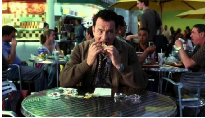
Şekil 7. Havalimanında Yemek Yeme (Kılıç, 2020)

kalkmasıyla birlikte fiziksel konfor koşullarının tekrar sorgulandığı söylenebilir. Tüm bu çevresel şartlar altında fiziksel konforun sağlanmasında etkili olan faktör, hız ve harekete bağlı zamansızlık probleminden kaynaklanmaktadır. Zaman problemi aşıldığında mekânda ergonomik kriterlere verilen önemin arttığı, filmde elde edilen görsellerde gözlemlenmiştir (Bkz: Şekil 7, Şekil 8)