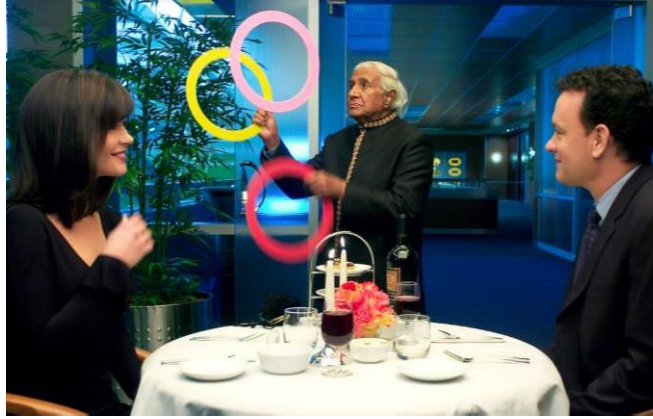
Şekil 8. Havalimanında Yemek Yeme Eyleminin Gelişimi (Amblin Partners, 2023)

Yok-yerde oluşan yakın çevredeki boyut sorunları da filmde dikkati çeken bir diğer unsurdur. İnsani eylemlerin gerçekleştirilmesinin yanında kontrolün ve güvenliğin de sürekli sağlanmaya çalışıldığı mekanlarda görmek ve görülmek önemli bir sorun haline gelmiştir. Bu tür mekanlarda yerin belirleyiciliğinin ortadan kalkmasıyla ‘güvenlik’ diğer tüm bileşenlerden daha önemli hale gelmiştir (Foucault, 1995). Bu durumda mekânın kullanıcı güvenlik unsurunu kullanarak mekanla ilişki kurmaya başlamış, güvenlik unsurları mekanla kullanıcı arasında bir iletişim aracına dönüşmüştür. (Bkz: Şekil 9, Şekil 10).