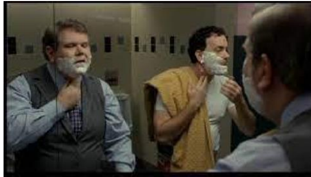
Şekil 5. Havalimanında Kişisel Bakım (Telerama, 2013)

Yok-yerde ergonomik ilkelerin değerlendirilmesi için yapılan gözlem sonucunda terminal binasının tamamen işlevselliğe yönelik olarak hareket/hız önceliğine göre tasarlandığı söylenebilir. Kullanıcıların havalimanı dahilinde eylemlerinin programlandığı, güvenlik amacıyla sürekli gözlemlendiği ve belirli bir mekân organizasyonu dahilinde sürekli hareket halinde olmalarının sağlandığı görülmüştür. (Filmin büyük çoğunluğu Montréal-Mirabel Uluslararası Havalimanı'nda çekilmiştir. Ancak filmde mekânın New York'un John F. Kennedy Havalimanı olduğu belirtilmektedir.) Bu durumda fiziksel konfor koşullarını tam olarak sağlanamadığı gibi mekân-kullanıcı uyumundan da söz edilememektedir. Öyle ki transit olarak geçmek için tasarlanan mekânda (filmde belirtildiği üzere New York'un John F. Kennedy Havaalanı) 'durmak' zorunda olan kullanıcının insani ihtiyaçlarından biri olan dinlenmek için bile mekânı yeniden düzenlemesi gerekmiştir. Çünkü yok-yerde yatmak normatif kullanıcılar için tasarlanmış bir eylem değildir. Bununla birlikte kişisel bakım ve temizlik için de benzer sınırlamalar getiren düzenlemelerin yapıldığı ancak bu sınırların mekânın kullanım süresi arttıkça aşıldığı söylenebilir. (Bkz: Şekil 5, Şekil 6)