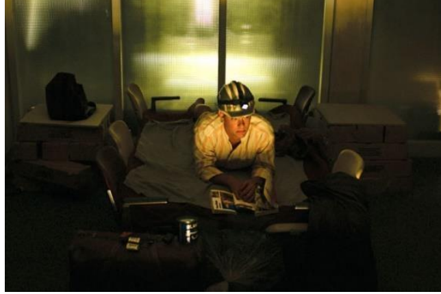
Şekil 4. Havalimanında Mekân Kurma (Ziza, 2015)

Yok-yerde ergonomik ilkelerin değerlendirilmesi için yapılan gözlem sonucunda terminal binasının tamamen işlevselliğe yönelik olarak hareket/hız önceliğine göre tasarlandığı söylenebilir. Kullanıcıların havalimanı dahilinde eylemlerinin programlandığı, güvenlik amacıyla sürekli gözlemlendiği ve belirli bir mekân organizasyonu dahilinde sürekli hareket halinde olmalarının sağlandığı görülmüştür. (Filmin büyük çoğunluğu Montréal-Mirabel Uluslararası Havalimanı'nda çekilmiştir. Ancak filmde mekânın New York'un John F. Kennedy Havalimanı olduğu belirtilmektedir.) Bu durumda fiziksel konfor koşullarını tam olarak sağlanamadığı gibi mekân-kullanıcı uyumundan da söz edilememektedir. Öyle ki transit olarak geçmek için tasarlanan mekânda (filmde belirtildiği üzere New York'un John F. Kennedy Havaalanı) 'durmak' zorunda olan kullanıcının insani ihtiyaçlarından biri olan dinlenmek için bile mekânı yeniden düzenlemesi gerekmiştir. Çünkü yok-yerde yatmak normatif kullanıcılar için tasarlanmış bir eylem değildir. Bununla birlikte kişisel bakım ve temizlik için de benzer sınırlamalar getiren düzenlemelerin yapıldığı ancak bu sınırların mekânın kullanım süresi arttıkça aşıldığı söylenebilir. (Bkz: Şekil 5, Şekil 6)