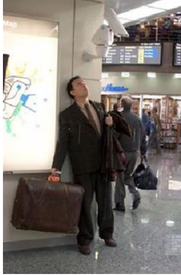
Şekil 10. Havalimanında Görülmemek (Guttridge & Sharman, 2022)

Yok-yerler, post-modernizmin mimari gerçekliğidir. Yok-yerler, içinden geçilen, deneyimlenen, fonksiyonlarını yerine getiren ancak bağ kurulamayan, benimsenmeyen mekanlardır. Anonim olarak nitelendirilebilecek bu mekanlarda karmaşa, kaos, hız, hareket vazgeçilmez unsurlardır. Bununla birlikte, yok-yerler, diğer tüm mekanlardan çok daha organize, kuralcı, sistematik ve güvenlidirler. Bu ikilik durumu, kullanıcıların bireysel ölçekte kimliklerini ortaya koymaya engel olurken, günlük yaşantılarını da kolaylaştırmak yerine zorlaştırmaktadır. Yok-yerlerin 21.yy'ın temel konusu olan tüketim unsuru üzerinden kurgulanması sonucu ortaya çıkan bu kimliksizlik durumu, merkezden insani değerlerin uzaklaşmasıyla ergonomik kriterler bakımından olduğu kadar insani ihtiyaçlar bakımından da yetersizliklere neden olmaktadır (Lefebvre, 1996). Bu durum yok-yerlerin benimsenmemesiyle birlikte birlikte tarihsellikten kopmasına ve bir ürün ya da nesne gibi hızla tüketilmesine yol açmaktadır (Urry, 1999).