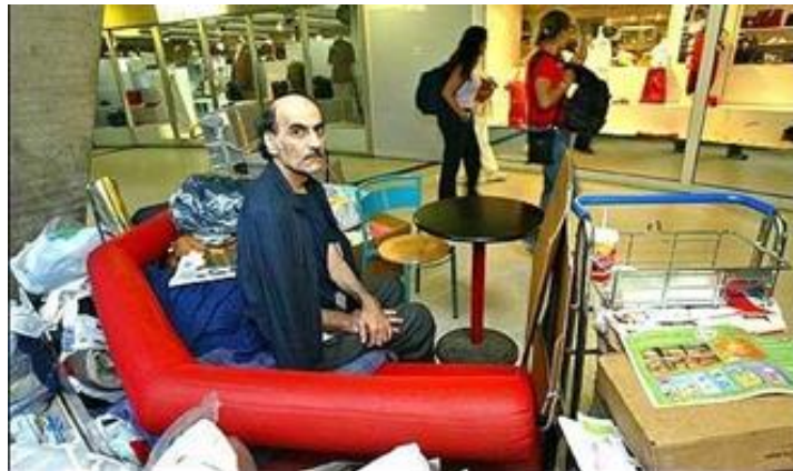
Şekil 2. Mehran Karimi Nasseri'nin havalimanındaki görüntüsü

Terminal filminde, yersiz-mekânsız/evsiz-vatansız (Kraozya isimli bir ülke gerçekte bulunmamaktadır) bir insanın üst- modernite mekanlarından biri olarak kabul edilen New York'un John F. Kennedy Havalimanında yaşantısını sürdürme çabası, günlük yaşam pratikleri üzerinden anlatılmaktadır. Yok-yer olarak nitelendirilen havalimanında bir insanın yer kurma potansiyeli, filmde konu olarak