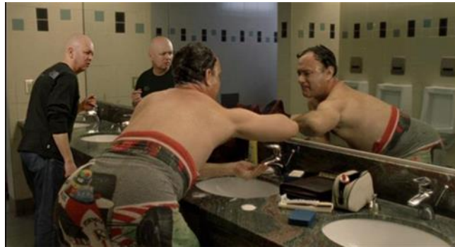
Şekil 6. Bakım Eyleminin Gelişimi (Guttridge & Sharman, 2022)

Kullanıcıların yaşantılarını sürdürülebilirlik için beslenme gibi temel ihtiyaçlarını karşıladıktan sonra eylemlerini geliştirmek için mekân tasarımına aykırı yeni düzenlemeler yaptıklarından söz edilebilir. Bu durumda, yemek yeme ihtiyacının giderilmesi için tasarlanan bir mekânın ergonomik özellikler bakımından optimum değerlerde olması yeterli olurken, hız/hareket şartının ortadan