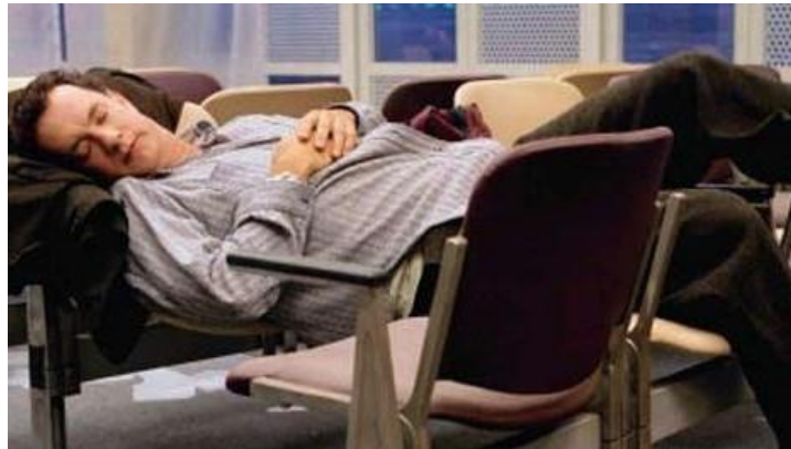
Şekil 3. Havalimanında Yatma Eylemi (Telarama, 2013)

Yapılan araştırma sırasında 'The Terminal' (Terminal) filminden elde edilen görsellere ait gözlemsel sonuçlar, teorik altyapıya uygun biçimde içerik analizi yöntemiyle değerlendirilmiştir. Bu değerlendirme neticesinde; yok-yerlerin 'yer' olarak nitelendirilmelerinin kullanıcıların katılımı doğrultusunda mümkün olduğu anlaşılmıştır. Kullanıcıların bu dönüşümü sağlamak için ergonomik ilkeleri yeniden kullandıkları gözlemlenmiş, bununla birlikte merkezi insan olan yapıların yere dönüşme potansiyellerinin daha yüksek olduğu anlaşılmıştır. Bu bağlamda mekânsal deneyim arttıkça aidiyet hissinin de artarak mekân kurma pratiklerinin profesyonelleştiği söylenebilir. (Bkz: Şekil 3, Şekil 4).