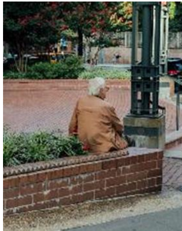
Şekil 4. New York’ta çiçeklik kenarlarına oturmanın engellenmesi (New York Times, 2019)

Tutunmak, oturmak gibi eylemlere, yaş almış bireylerin daha fazla ihtiyaç duyduğu söylenebilir. Yaş ilerledikçe gelişen sağlık sorunlarına paralel olarak fiziksel aktivitenin kısıtlanması, yaşlı bireylerin -engellilerle benzer biçimlerde- kentsel mimari mekânda desteklenmesini gerektirmektedir. Kentsel mekanların yaşlıların kullanımına uygun olarak yeniden düşünülmesi, Yaşlı Dostu Şehirler ve Topluluklar (Age-Friendly Cities and Communities (AFCC)) oluşumu dahilinde gelişmekte olan bir anlayıştır. Dünya Sağlık Örgütü’nün uygulamaları dahilinde ‘aktif yaşlanma’ olarak tanımlanan ileri yaştaki bireylerin toplumsal hayata katılmasına dair uygulamalar, ülkelerin sosyal politika stratejileri dahilinde oldukça detaylı olarak tanımlanmasına rağmen mimari mekân uygulama örneklerinde yeterli düzeye ulaşamadıkları anlaşılmaktadır. Bu bağlamda, teorik olarak mimari mekâna yerleştirilmesi gerektiği düşünülen mekân ve mobilya örneklerinin, tekrar düşünülerek detaylı olarak çalışılması gerekmektedir. Görsellerden de anlaşılacağı üzere, dışlayıcı mimarlık uygulamaları ‘kötü tasarım’ olarak kabul edilebilir nitelikler taşımaktadırlar (Bkz: Şekil 4, şekil 5). Ancak bu örnekleri sadece kötü tasarım olarak nitelendirmek, tasarım anlayışının altında yatan düşüncenin görmezden gelinmesine neden olacaktır.