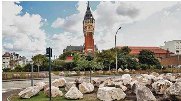
Şekil 1. Paris’te mülteci ve evsizlerin kamusal alanları işgalini engellemek için yerleştirilen taşlar (Yeni Şafak, 2022)

Yapılan araştırma sonucunda elde edilen görsellere ait gözlemsel sonuçlar, teorik altyapıya uygun biçimde içerik analizi yöntemiyle değerlendirilmiştir. Bu değerlendirme sonucunda dışlayıcı mimari’ (exclusionary architecture), ‘hasmane mimari’ (hostile architecture), ‘korumaya yönelik kentsel mimari’ (defensive urban architecture), ‘çevresel tasarımla suçun önlenmesi’ (crime prevention through environmental design-CPTED) ve ‘disiplinci mimari’ (disciplinary architecture) olarak nitelendirilebilecek uygulamaların kapitalistleşmiş toplumlarda yaygın olarak kentsel mimari mekânında uygulandığı anlaşılmıştır. Dışlayıcı mimari mekân düzenlemelerinin, ülkelerin politik tutumlarına göre farklılık gösterirken; temelde ırk, etnik köken gibi farklılıklara göre şekillendirildiği söylenebilir. Bu bağlamda yaş ve cinsiyet ayrımcılığının kentsel mimari mekân ve mobilya tasarımlarında ilk bakışta fark edilmediği söylenebilir. Bununla birlikte, çeşitli nedenlerle kasti amaçlarla geliştirilen orantısız uygulamaların kapitalist ülkelerde yaygınlaşmaya devam ettiği de unutulmamalıdır. Paris, Londra, New York gibi metropollerde kapsayıcı mimari uygulamaların aksine dışlayıcı mimarlık uygulamalarının mültecilerin ve evsizlerin meydana getirdiği problemlere karşı bir önlem olarak kullanıldığı söylenebilir. Örneklerden de anlaşılacağı üzere mimari uygulamalar, siyasi erkin izlediği politikalara göre çeşitlenerek farklılaşmaktadır. (Bkz: Şekil 1, Şekil 2).