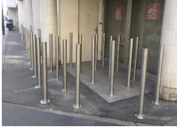
Şekil 7. Kontrolsüz giriş-çıkışı engelleyen bariyerler (Buckle, 2014)

Bu tür, kullanıcı bakımından elverişsiz mimari uygulamaların yaygınlaşması ve kilitli bank örneğinde olduğu gibi kabul edilemez bir düzeye gelmesi üzerine (Bkz: Şekil 7), 2008'de Alman heykeltıraş Fabian Brunsing, ticarileştirilmiş kamusal alanlara karşı bir sanatsal protesto biçimi olarak The Pay & Sit bankını tasarlamıştır (Brunsing, 2014). İronik bir biçimde para atıldığında küçük çıkıntılar içeri girmesiyle birlikte 'belirli bir süre' oturmaya izin veren bank tasarımı, gelecekte dışlayıcı mimarlık örneklerinin kapitalist düzen ve neo-liberal politikalar dahilinde uç örneklerini görebileceğimize dair bir uyarı niteliği taşımaktadır. (Bkz: Şekil 8)