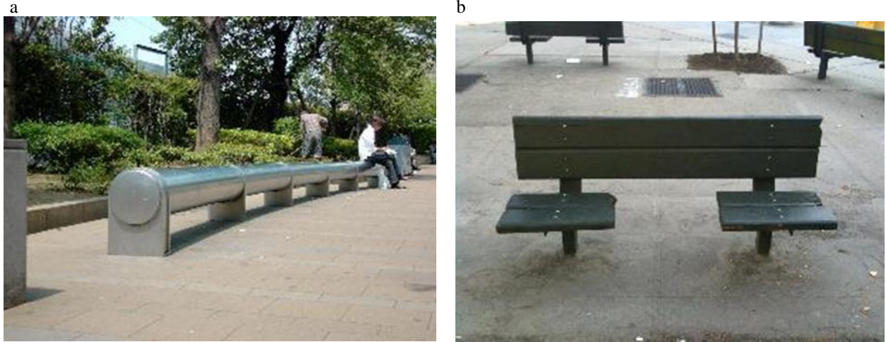
Şekil 6. (a) Japonya'da oturmaya elverişli olmayan banklar (Ruetas, 2022) (b) New York'ta sosyalleşmeye elverişli olmayan banklar (Sociology, 2017)

Araştırma sırasında bulunan pek çok örnekte, mimari uygulamaların yaşlıların fiziksel yetersizliğini arttırmanın yanında sosyalleşmelerini de engelledikleri görülmüştür. Bu bakımdan yaşlı bireylerin sosyalleşme mekanları olarak kabul edilebilecek olan kamusal alanlarda fiziksel çevrenin yaşlılara uygun olarak düzenlenmemesi sonucunda sosyal gereksinimlerin de karşılanmadığı anlaşılmıştır (Bkz: Şekil 6). Bu durum, yaşlı bireylerin kendi konfor alanları içine hapsolmalarına neden olmaktadır.