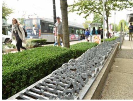
Şekil 3. Vancouver’da oturmaya engellemek için yerleştirilen çıkıntılar (Mussett, 2019)

Mülteciler ve/veya evsizlerle ilgili nispeten daha az sorunu olan ülkelerde de benzer uygulamalar görülmektedir. Bu durum dışlayıcı mimarlık uygulamalarının arka planında, kapitalist düzene uyum sağlayamayan yaş almış bireylerin kentsel yaşamdan uzaklaştırılması anlayışının yaygınlaştığı düşündürmektedir. Örneğin, Kanada Vancouver’da da benzer uygulamaları görülmesi, ırk ve cinsiyetin ötesinde farklı ancak etkili bir ayrımcılık biçimiyle karşı karşıya olduğumuzu göstermektedir (Bkz: Şekil 3).