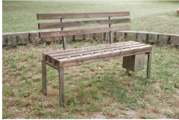
Şekil 8. The Pay & Sit (Öde ve Otur) Bankı (Brunsing, 2014)

Bu tür, kullanıcı bakımından elverişsiz mimari uygulamaların yaygınlaşması ve kilitli bank örneğinde olduğu gibi kabul edilemez bir düzeye gelmesi üzerine (Bkz: Şekil 7), 2008'de Alman heykeltıraş Fabian Brunsing, ticarileştirilmiş kamusal alanlara karşı bir sanatsal protesto biçimi olarak The Pay & Sit bankını tasarlamıştır (Brunsing, 2014). İronik bir biçimde para atıldığında küçük çıkıntılar içeri girmesiyle birlikte 'belirli bir süre' oturmaya izin veren bank tasarımı, gelecekte dışlayıcı mimarlık örneklerinin kapitalist düzen ve neo-liberal politikalar dahilinde uç örneklerini görebileceğimize dair bir uyarı niteliği taşımaktadır. (Bkz: Şekil 8)