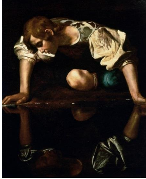
Resim 3. Michelangelo Merisi da Caravaggio , Su Kaynağındaki Narkissos, 1597, Tuval Üzerine Yağlıboya, 110x92 cm. Roma Ulusal Antik Sanat Galerisi ( https://tr.m.wikipedia.org , 2022).

(Maniyerist) dönemi ressamlarından Abraham Bloemaert (1566-1651) Narkissos'u göl kıyısına yeni gelmiş ve su içmek için eğildiği esnada suda yansımını ilk gördüğü anı resmetmiştir. Resim hikâyede anlatıldığı gibi ormanlık bir alanda göl kenarında betimlenmiştir. Yine 16. yüzyılda Dirk van Baburen (1595-1624) Narkissos konusunu çalışmıştır. Baburen hikâyenin doğa betiminin dışında bir mekân ile kendi yorumunu katmıştır. Baburen Narkissos'u bir çeşmenin yanında eğilirken resmetmiştir. Bu resimde Narkissos kendi yansımını çeşmenin su havuzu içerisinde görmüş ve kendini seyre dalmış bir şekilde betimlenmiştir.