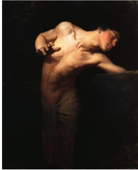
Resim 4. Gyula Benczur, Narkissos, 1881, Tuval Üzerine Yağlıboya, 110x115 cm. Macaristan Ulusal Galerisi ( https://tr.m.wikipedia.org ).

Michelangelo Merisi da Caravaggio (1571-1610) 'Su Kaynağındaki Narkissos' adlı eserini Barok üslupla yapmıştır. Caravaggio'nun yapmış olduğu resimde (Resim 3.) Narkissos hikâyede betimlendiği haliyle gölün kıyısında elleri üzerine eğilmiş vaziyette suda kendi yansımını izlerken görülmektedir. Sanatçı, Narkissos ve onun suda kendi yansımını seyre dalmasını, elleri üzerine dayanıp göle doğru uzanarak betimlemesi ile güçlü bir simetri sağlar. Eser kompozisyon ve renk dengesi barok üsluba uygun olarak tasarlanmıştır. Kompozisyonda figür statik olsa da vücut hatlarına hareket verilmiş ve renk olarak da açık- koyu kontrastı ile figür ön plana alınmıştır.