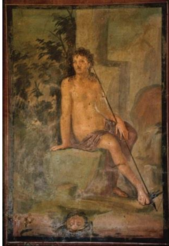
Resim 1. Anonim, Narcissus, M.S. 62, Fresko. (Valladeres, 2011, s. 381).

Narkissos miti binlerce yıl anlatılmış, çoğu zaman da görsel sanatların, resmin konusu olmuş ve öykü resimlerde temsil edilmiştir. Valladares'a göre (2011: 381-391) Narkissos öyküsünü temsil eden ilk örnekler M. S. 1. yüzyılda Roma duvar resimlerinde yer almaktadır (Resim 1). Bu resimler Roma döneminden kalma Quartio Octavius Evi'nin duvarlarında bulunmaktadır. Narkissos hikayesini temsilen yapılan resimler Quartio Octavius Evi'nde bir grup resim içerisinde yer alır.