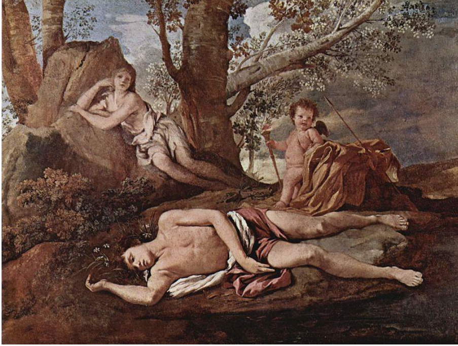
Resim 2. Nicolas Poussin, Eko ve Narkissos, 1629-1630, Tuval Üzerine Yağlıboya, 74x 100 cm. Louvre Müzesi Paris. ( https://en.wikipedia.org , 2022).