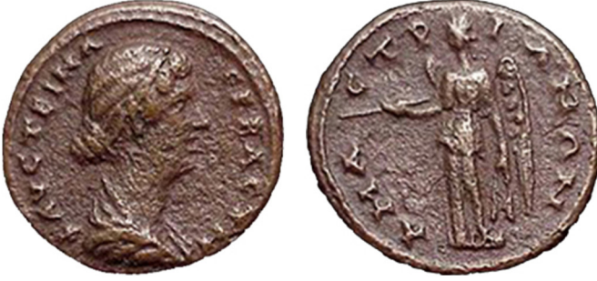
Fig. 11: Amastris sikkesi, II. Faustina adına 73 .

Amastris'in MS 2. yüzyıla 74 ait, Marcus Aurelius 75 , II. Faustina 76 , Caracalla 77 ile Gangra-Germanikopolis'in Septimius Severus 78 adına basılan sikkelerin arka yüzünde bu tasvir yer almaktadır.