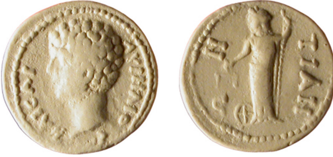
Fig. 9: Tieion/Tium sikkesi, Marcus Aurelius adına 69 .

If. Terazili ve Asal 68 : Paphlagonia Bölgesi'nde sadece tek bir kentin sikkeleri üzerinde görülmektedir. Sikkeler üzerinde görülen bu tipte Nemesis, bir elinde terazi, diğer elinde ise uzun bir asa tutmaktadır. Ayakları yanında ise tekerlek yer almaktadır (Fig. 9).