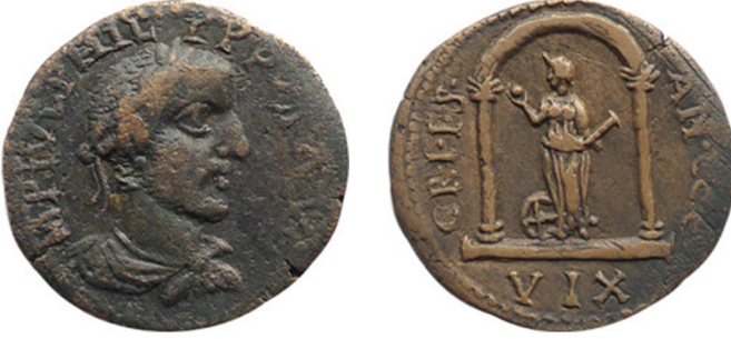
Fig. 14: Sinope sikkesi, I. Philippus Dönemi 92 .

III.b. Küreli ve Cetvelli/Kılıçlı: Paphlagonia Bölgesi'nde sadece tek bir kentin sikkeleri üzerinde görülmektedir. Sikkeler üzerinde görülen bu tipte Nemesis, iki sütunlu tapınak içinde chiton giymiş ayakta heykel şeklinde, sol elinde cetvel veya kınında kılıç, sağ elinde ise küre tutmaktadır. Ayakları yanında ise tekerlek yer almaktadır (Fig. 14).