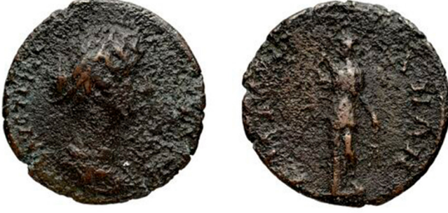
Fig. 5: Amastris sikkesi, II. Faustina adına 50 .

Amastris'in II. Faustina 51 ; Sinope'nin I. Maximinus 52 ; Tieion/Tium'un Iulia Domna 53 adına basılan sikkelerin arka yüzünde bu tasvir yer almaktadır.