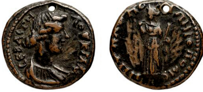
Fig. 4: Pompeiopolis sikkesi, Lucilla adına 33 .

Amastris'in III. Gordianus 34 ; Ionopolis/Abonoteikhos'un Antoninus Pius 35 ; Pompeiopolis'in Lucilla 36 ; Sinope'nin Domitianus 37 , Traianus 38 , Iulia Domna 39 , I. Maximinus 40 , Otacilla Severa 41 ; Tieion/Tium'un Antoninus Pius 42 , Marcus Aurelius 43 , Caracalla 44 , Iulia Cornella Paula 45 , III. Gordianus 46 , I. Philippus 47 , Hostilianus 48 ve Volusianus 49 adına basılan sikkelerin arka yüzünde bu tasvir bulunmaktadır.