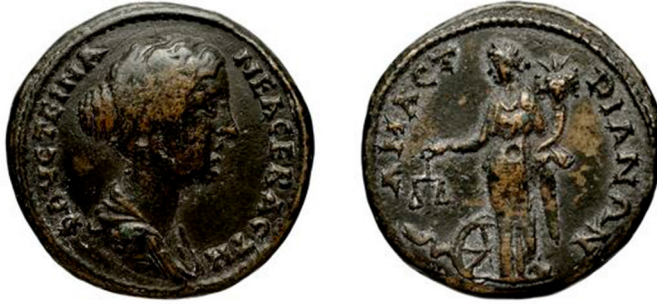
Fig. 7: Amastris sikkesi, II. Faustina adına 59 .

I.d. Terazili ve Bereket Boynuzlu 58 : Paphlagonia Bölgesi'ndeki üç kentin sikkeleri üzerinde görülmektedir. Sikkeler üzerinde görülen bu tipte Nemesis, bir elinde terazi, diğer elinde ise bereket boynuzu tutmaktadır. Ayakları yanında tekerlek ile bazen Isis'in yılanı yer almaktadır (Fig. 7).