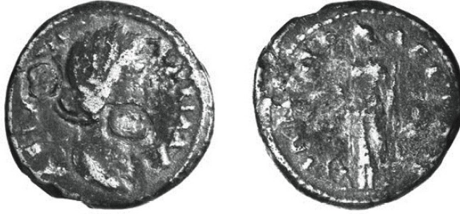
Fig. 10: Ionopolis-Abonoteikhos sikkesi, Lucilla adına 71 .

I.g. Paterali ve Cetvelli: Paphlagonia Bölgesi'nde sadece tek bir kentin sikkeleri üzerinde görülmektedir. Sikkeler üzerinde görülen bu tipte Nemesis, bir elinde patera, diğer elinde ise cetvel tutmaktadır. Ayakları yanında tekerlek bulunmaktadır (Fig. 10).