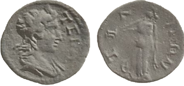
Fig. 6: Tieion/Tium sikkesi, MS 3. yüzyıl tarihli Teios adına 54 .

I.c. Dizginli ve Cetvelli: Paphlagonia Bölgesi'ndeki üç kentin sikkeleri üzerinde görülmektedir. Sikkeler üzerinde görülen bu tipte Nemesis, bir elinde cetvel, diğer elinde dizgin tutmaktadır. Ayakları yanında tekerlek yer almaktadır (Fig. 6).