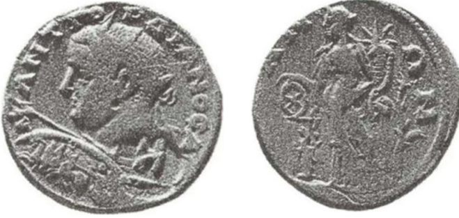
Fig. 8: Tieion/Tium sikkesi, III. Gordianus Dönemi 63 .

Tieion/Tium'un III. Gordianus 64 , Tranquillina 65 , Traianus Decius 66 ve MS 3. yüzyıl tarihli Teios'a 67 ait sikkelerin arka yüzünde bu tasvir bulunmaktadır.