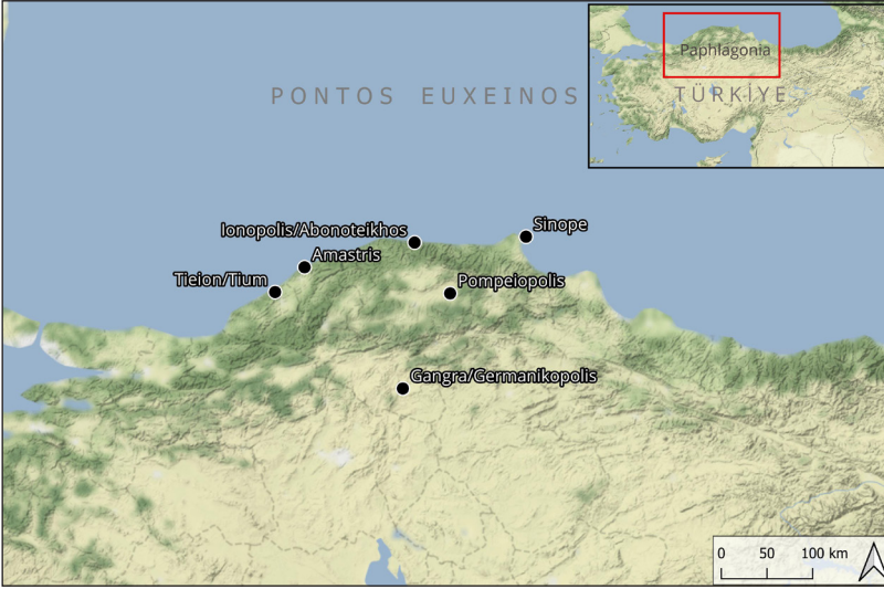
Fig. 2: Paphlagonia Bölgesi'nde Nemesis tasvirli sikke basan kentler.

nemden önce bu bölgenin sikkeleri üzerinde yer almaz. Paphlagonia Bölgesi'ndeki Nemesis tasvirleri Ionopolis/Abonoteikhos, Amastris, Gangra/Germanikopolis, Pompeiopolis, Sinope ve Tieion/Tium kenti olmak üzere toplam 6 kentin sikkeleri üzerinde görülmektedir (Fig. 2).