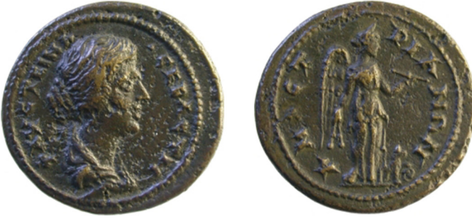
Fig. 12: Amastris sikkesi, II. Faustina adına 79 .

II.b. Cetvelli, Dizginli ve Griffon ile: Paphlagonia Bölgesi'nde sadece tek bir kentin sikkeleri üzerinde görülmektedir. Sikkeler üzerinde görülen bu tipte Nemesis, kanatlı bir şekilde tasvir edilmiş ve bir elinde cetvel, diğer elinde ise dizgin tutmaktadır. Ayakları yanında ise, bir ayağını (ön pati, pençe) tekerlek üzerine koymuş bazen oturur şekilde bazen de ayakta Griffon yer almaktadır (Fig. 12).