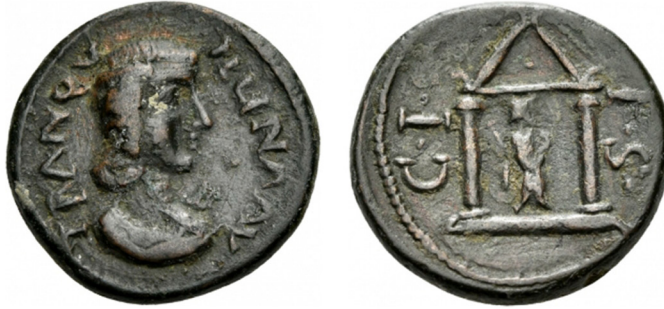
Fig. 13: Sinope sikkesi, Tranquillina adına 82 .

III.a. Cetvelli: Paphlagonia Bölgesi'nde sadece tek bir kentin sikkeleri üzerinde görülmektedir. Sikkeler üzerinde görülen bu tipte Nemesis, iki sütunlu tapınak içinde chiton giymiş ayakta heykel şeklinde, bir elinde cetvel tutmakta, ayakları yanında ise tekerlek yer almaktadır (Fig. 13).