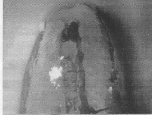
Resim 1. Kanal patı kullanılmadan devamlı ısıyla obtürasyon tekniğiyle doldurulan örnek (X 6).

2.91 mm'lik sızıntı ile 1. Grup'da diğer iki gruba göre eşleştirilmiş t testinde istatistiksel olarak anlamlı bir fark görüldü (p<0.05). Ortalama 0.72 mm'lik bir sızıntı görülen 2. Grup (Resim 2) ile, yine ortalama 0.61 mm'lik bir apikal sızıntı oluşan 3. Grup (Resim 3) arasında anlamlı bir fark olmadığı gözlemlendi.