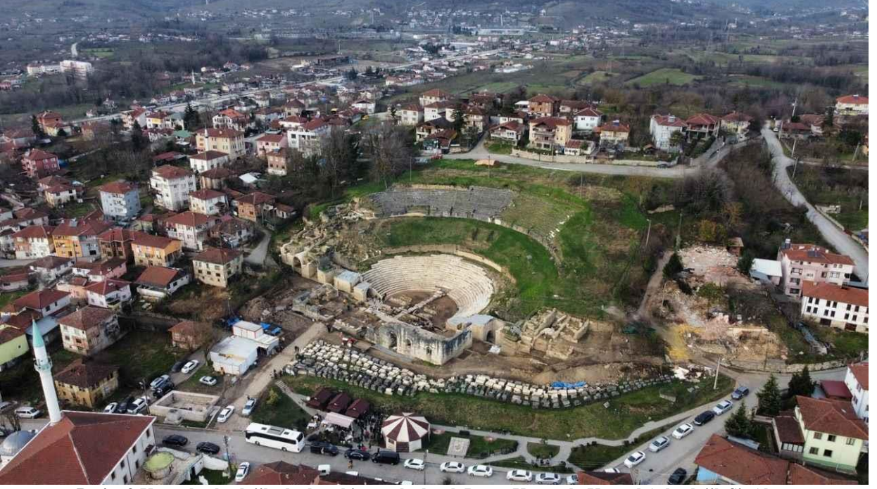
Resim 3-Kentsel arkeolojik alanlara bir örnek olarak Düzce Konuralp Kentsel Arkeolojik Sit Alanı (URL 3).