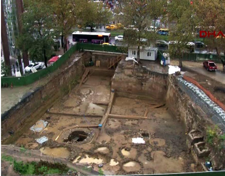
Resim 2- İstanbul'da Beşiktaş metro inşaatında kentsel alanda ortaya çıkan arkeolojik kalıntılar URL 5).