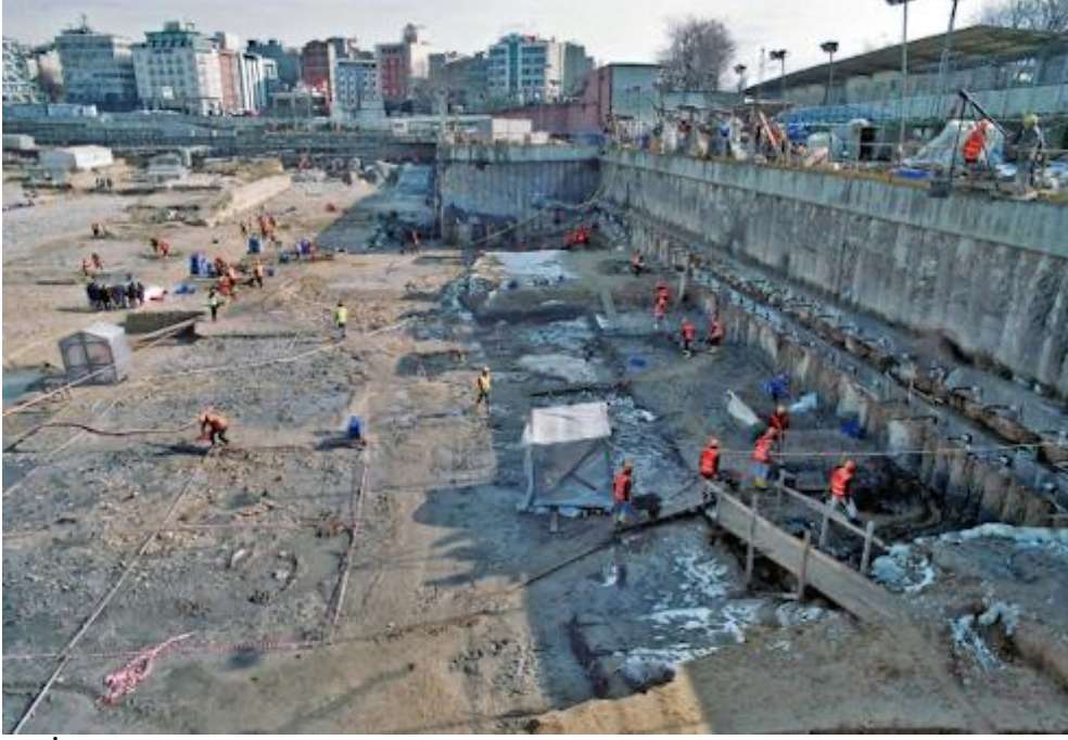
Resim 1- İstanbul'da Marmaray Metro inşaatı yapılırken kentsel alanda ortaya çıkan arkeolojik kalıntılar (URL 5).

Kentsel arkeolojik alanlara ilişkin verilebilecek bazı örnekler;