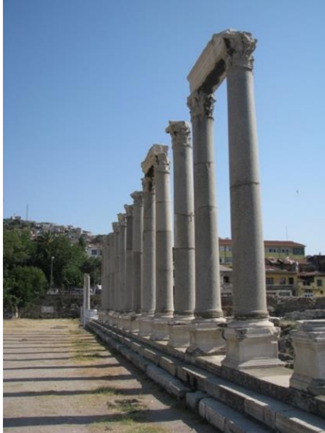
Resim 4-İzmir Agora Ören yeri Kent içinde kalan Arkeolojik sit alanı (URL 4).