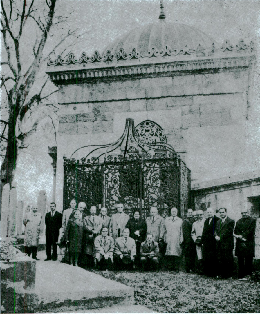
Türk Tarih Kurumu üyeleri Mustafa Reşit Paşa'nın türbesi önünde