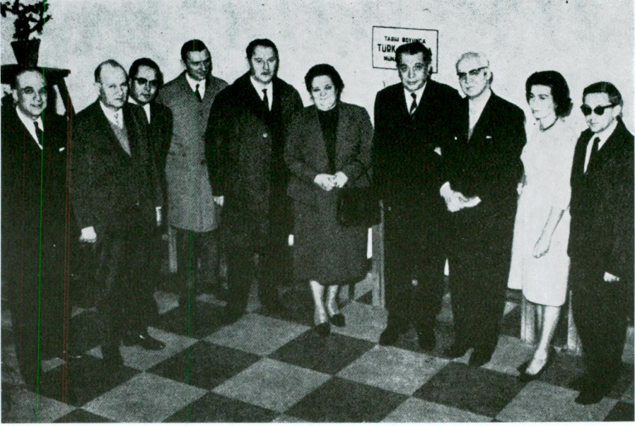
Türkiye - Polonya Siyasal İlişkileri Sergisini gezen Polonya Büyük Elçisi Kurum üyeleri ile