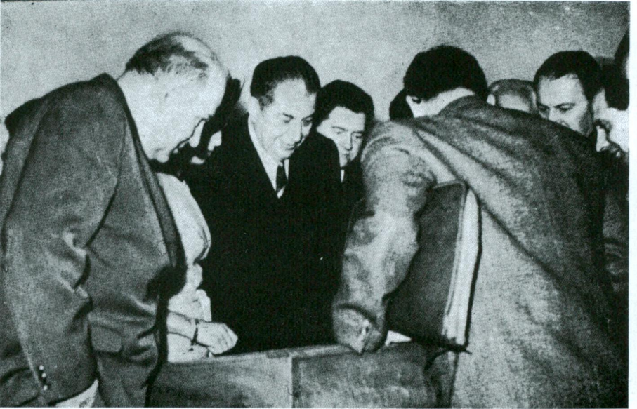
Türkiye - Polonya Siyasal İlişkileri Sergisi