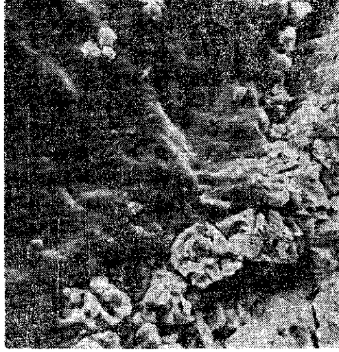
Resim 5. Dentin kanallarının doğal boyutlarını koruduğu ve dentinde asit sızması olmadığı daha büyük büyütme ile de gözlenmektedir (2000 Büyütme).