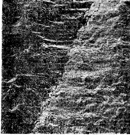
Resim 1. Likit şekilde asit uygulanan dişlerde minerin yanısıra dentinin de sızan asit ile dağlandığı gözlenmiştir (200 Büyütme).