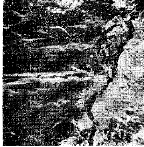
Resim 4. Minede meydana gelen dađlamanın dentinde oluşmadığı ve dentinin doğal yapısını koruduđu gözlenmektedir (1000 Büyütme).