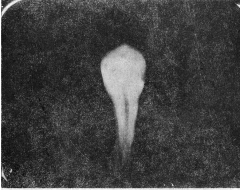
RESİM 4 : Isopast'ın daimi 1. küçük azı dişteki Class II kaviteye uygulandığındaki radyografik görüntüsü.