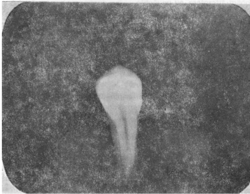
RESİM 3 : Express'in daimi 1. küçük azı dişteki Class II kaviteye uygulandığındaki radyografik görüntüsü.