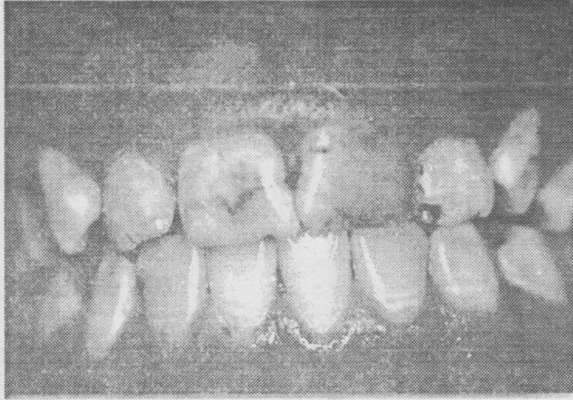
Resim 1: Ön dişlerdeki tetrasiklin renklenmesi.

3 ay, 6 ay, 1 yıllık kontrollerde yapılan değerlendirmelerde tutuculuk, yumuşak doku uyumu ve periodontal sağlığın uyumlu olduğu gözlemlendi.