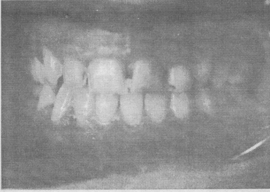
Resim 2: Ön dişlerdeki laminate veneer preparasyonları.