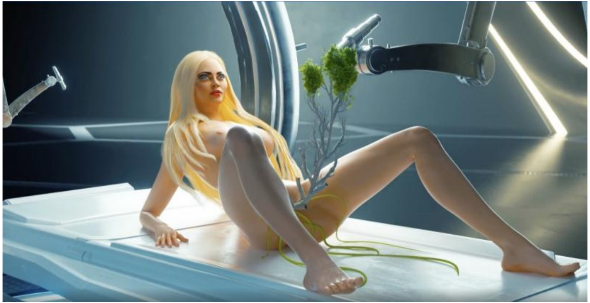
Şekil 3. Doğanın Annesi (Ciccone, 2022)