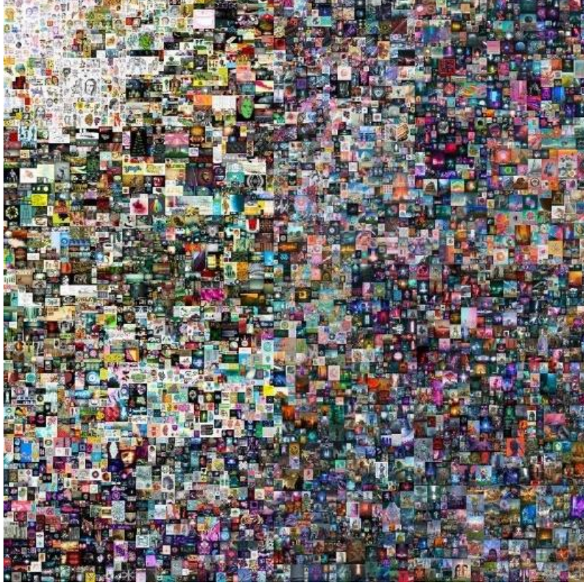
Şekil 4. Everydays: The First 5000 Days (Winkelmann, 2021)

NFT kullanılarak en yüksek tutara satılan çalışma Beeple olarak bilinen Mike Winkelmann'ın 'The First 5000 Days' eseridir. 11 Mart 2021' de 69,346,250.00 dolar fiyat ile satılmıştır. Eser 5000 gün boyunca yapılan eskiz çizimler ve Cinema 4D programı kullanılarak yapılan görsellerden oluşmaktadır. (Doğan vd., 2022)