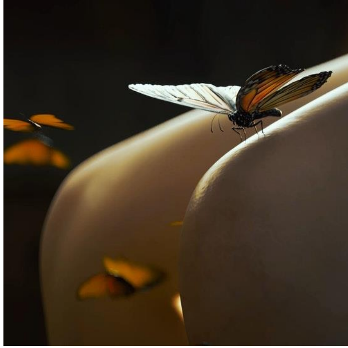
Şekil 2. Evrimin Anası (Ciccone, 2022)