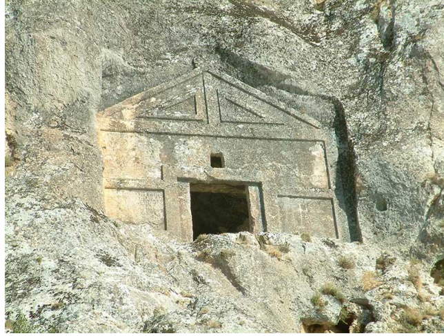
Şekil 1. Kaya Mezarları (Anonim, 2015)

değildir. Bugün mezarlıklar, kent halkının çok az sıklıkla ziyaret ettiği ve genel olarak defin sahalarının bulunduğu yerler biçiminde algılanır (Odabaş vd., 1994).