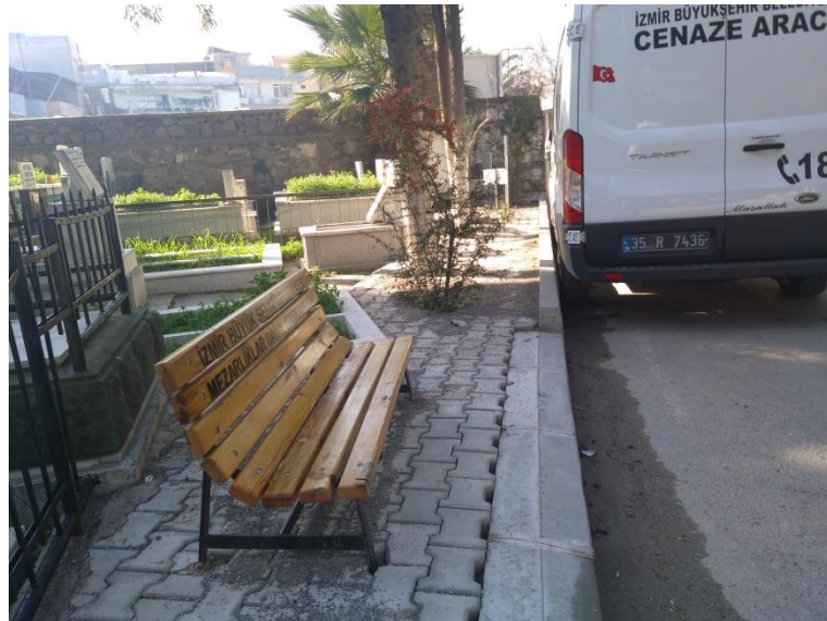
Şekil 9. Yaya yolu üzerine konumlandırılmış oturma bankı

Mezarlıklarda en fazla yer alan donatı çeşmelerdir. Çoğunlukla mezar sahipleri tarafından farklı tiplerde ve malzeme ile yaptırılan çeşmeler estetik bakımdan sıkıntı yaratmakta ayrıca gelişmiş güzel konumlandırıldığı için fonksiyonel açıdan yetersiz kalmaktadır.