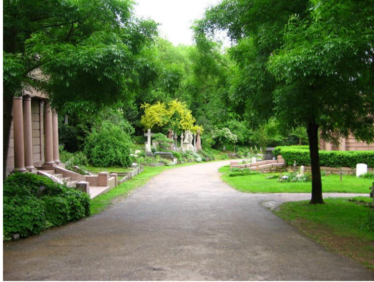
Şekil 2. Highgate Mezarlığı, Londra/İngiltere

İngiliz mezarlıklarında kendine özgü karakteriyle üç biçimlendirme elemanı taş, ağaç ve çim alan kullanımına dikkat edildiği gözlenmektedir (Şekil 2). Fransa’da da mezarlıkların manzaraya hâkim yere yerlere kurulması gelenek haline gelmiştir. Ayrıca mezarlığın etrafının bir duvarla çevrenmesi yavaş yavaş kalkmaktadır (Aktan, 1999).