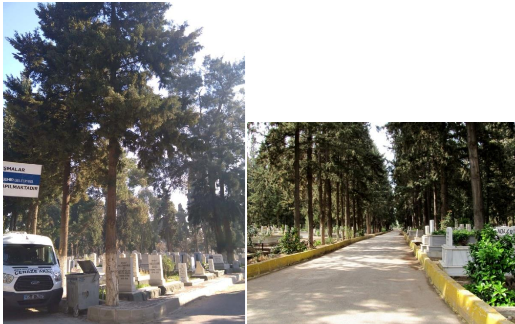
Şekil 10. Alle perspektifi oluşturmuş ağaçlar

Alan; yeşil alan açısından irdelendiğinde nispeten yoğun bir yeşil dokuya sahip olduğu gözlenmektedir. Alan içerisinde birçok yapraklı ve ibrelili ağaç türleri yer almaktadır ama yaygın olarak Servi ( Cupressus sempervirens ) ağaçları yoğun olarak bulunmaktadır (Şekil 10), bunun yanında sedir türleri ( Cedrus sp. ) çam türleri ( Pinus sp. ), mazı türlerinin ( Thuja sp. ) yer aldığı alanda yapraklı ağaç olarak kavak, çınarlara ve okaliptüslere yer verilmiştir.