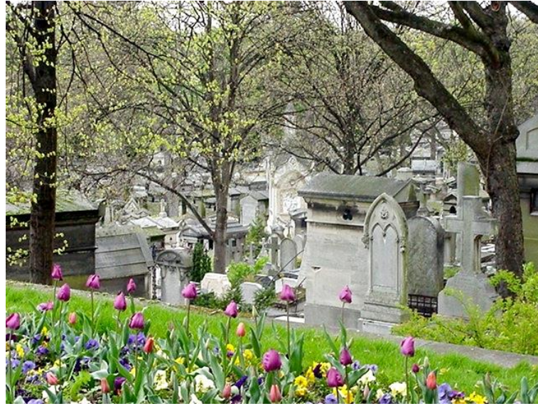
Şekil 4. Pere Lachaise Mezarlığı / Paris

süslenmiş, sanat eserlerinin ve heykellerin yer aldığı mezarlık bir açık hava müzesi havası yaratmaktadır (Şekil 4).