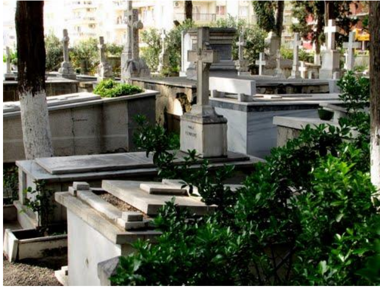
Şekil 6. Hristiyan Mezarlığı

Soğukkuyu Mezarlığı geçmişten günümüze kadar büyüyerek genişlemiş ve bugünkü halini almıştır şu anki durumunda mezarlık 58 adaya bölünmüş olup yaklaşık 100 dönümlük alana sahiptir. Ayrıca bu adalarda bazıları büyüklüklerine göre kendi içinde de kısımlara bölünebilmektedir ve bu adalar ve kısımlarda parsellere bölünerek mezar yerlerini oluşturmaktadır. Adalarının tamamına yakın bölümünde mezar içi yollar bulunmamasından dolayı sirkülasyon ada etrafındaki araç yollarından sağlanmaktadır.