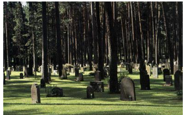
Şekil 3. Green-Wood Mezarlığı / Brooklyn, NY/AB, Stockholm Woodland Mezarlığı / Stockholm, İsveç

Avrupa’da asırlardır süregelen geleneklerdeki değişikliklerle bugün mezarlıklar yerleşim alanları dışında, mezarların geniş yeşil alanlarda özgürce konumlandığı “memorial parklar” olarak tasarlanmaktadır. Paris’te bulunan Pere Lachaise Mezarlığı sanki bir bahçe, park gibi çiçeklerle