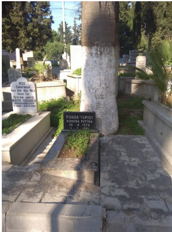
Şekil 7. Düzensiz parsel aralıkları

Adalar içerisinde farklı büyüklükte, sayı ve şekillerde tahsislerin yapıldığı görülmektedir. Mezarlar adalar içerisine rast gele serpiştirilmiş görüntüsü vermektedir. Mezarlar birbirilerinin önüne ve arkasına düzensiz yerleştirilmiş, bazı noktalarda yer edinebilme adına sıfır noktasına kadar sıkıştırılmış, mezarlar iç içe karışmış haldedir (Şekil 7).