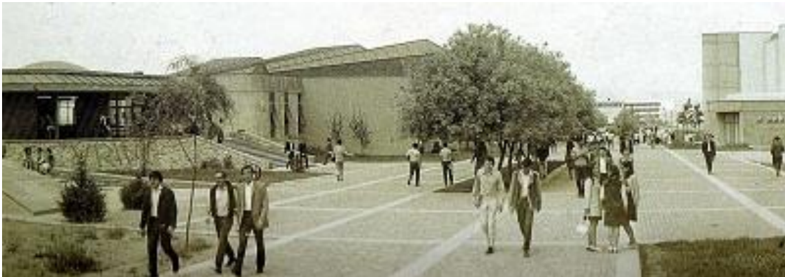
Şekil 3. ODTÜ Kampüsü ( Erişim tarihi: 17.01.2017) (URL-3)

ODTÜ'den sonra yarışmayla yapılan ilk mimarlık fakültesi olmasıyla da mimarlık ortamında önemli bir yere sahiptir.