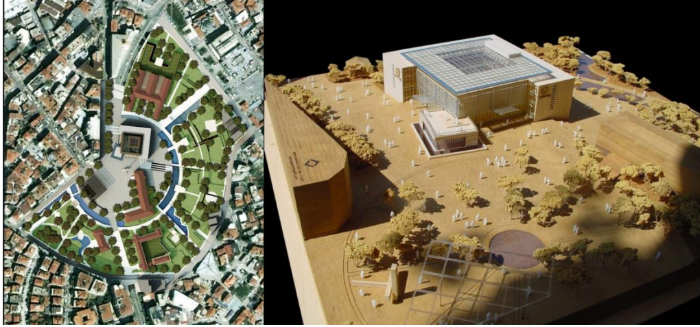
Şekil 2. Birinci Proje (Y.Mimar Yavuz Selim Sepin ve ekibinin hazırlamış olduğu proje; proje revize edilerek uygulanmıştır.) (URL-2)

Yine 2009 yılında Denizli Valiliği tarafından Denizli Hükümet Konağı Mimari Projesi ve Yakın Çevresi Kentsel Tasarım Yarışması ilan edilmiş ve yaklaşık 53.000m 2 (Şekil 2.) alanın çevresindeki odak noktaları dikkate alınarak bu alanın şehrin gündüz ve gece kullanımını sağlayacak meydan ve bununla birlikte yönetim ve kültür hizmetleri verilebilecek bir kentsel tasarımı da hedefleyen hükümet konağı projesi elde etmek hedeflenmiştir. Birinci ödülün Sepin Mimarlık'a verildiği projenin yakın çevresini ve kent merkezini tetikleyecek, yeni açılımlara olanak verecek ve toplayıcı bir kamusal alan yaratan bir proje olduğu jürinin raporunda görülmektedir.