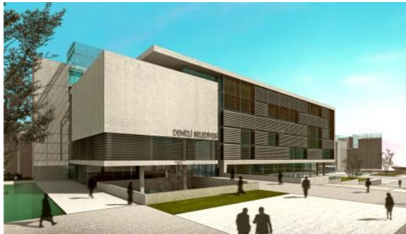
Şekil 1. Birinci Proje (Seden Cinasal Avcı ve Bilge Gülen'den oluşan ekip; Proje uygulanmamıştır.) (URL-1)

Kent merkezinde ilk olarak Denizli Belediye'sinin 2009 yılında Denizli Belediyesi Hizmet Binası ve Çevresi Mimari Proje Yarışması açılmış ve birinciliği Seden Cinasal Avcı ve Bilge Gülen'den oluşan ekip kazanmıştır.