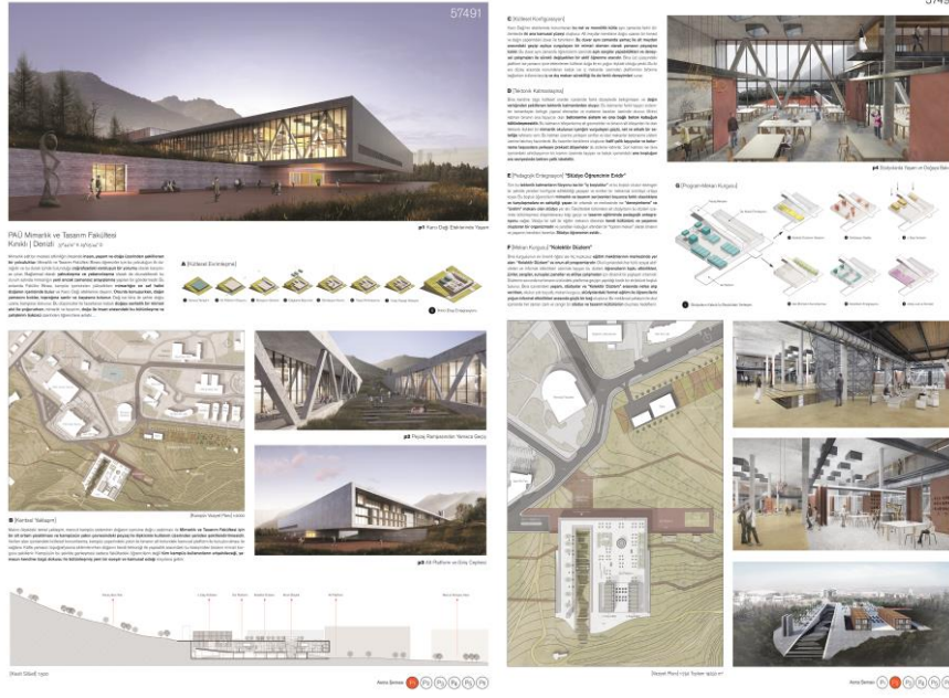
Şekil 5. Birincilik ödüllü projenin paftaları (Anonim, 2017).

Jüri üyelerinden Tülin Hadi, birinci olan projenin kendi içinde kurduğu dünyada sarmalama, ölçeğe getirme, kampüsün içinden alıp tabiata doğru insanı yönlendirme gibi bir yol izlediği için bu projenin seçildiğini belirtmiştir. Bunlarla birlikte kampüs yaşantısına getirdiği yeni bir yön, mimarlık eğitimine getireceği mekansal çözümlerle birlikte değerlendirilmiştir.