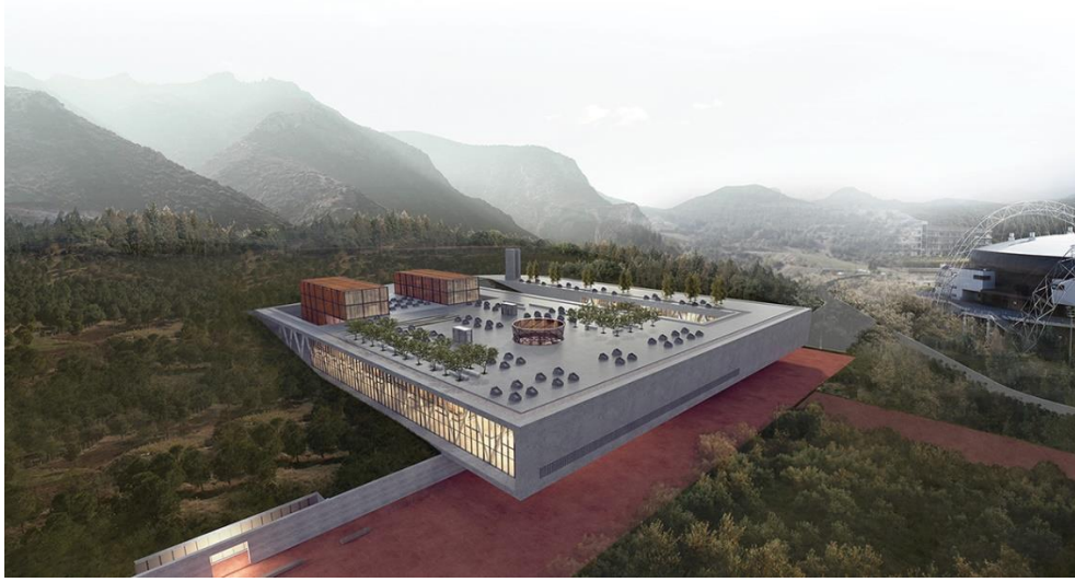
Şekil 4. Birincilik Ödülü Alan Proje (URL-5)

1. Ödül: Deniz Aslan, Ozan Önder Özener, Özlem Ünkap, Tuğçe Alkaş, Barış Can Cüce, Çağlar Yılmaz, Erenalp Büyüktopçu