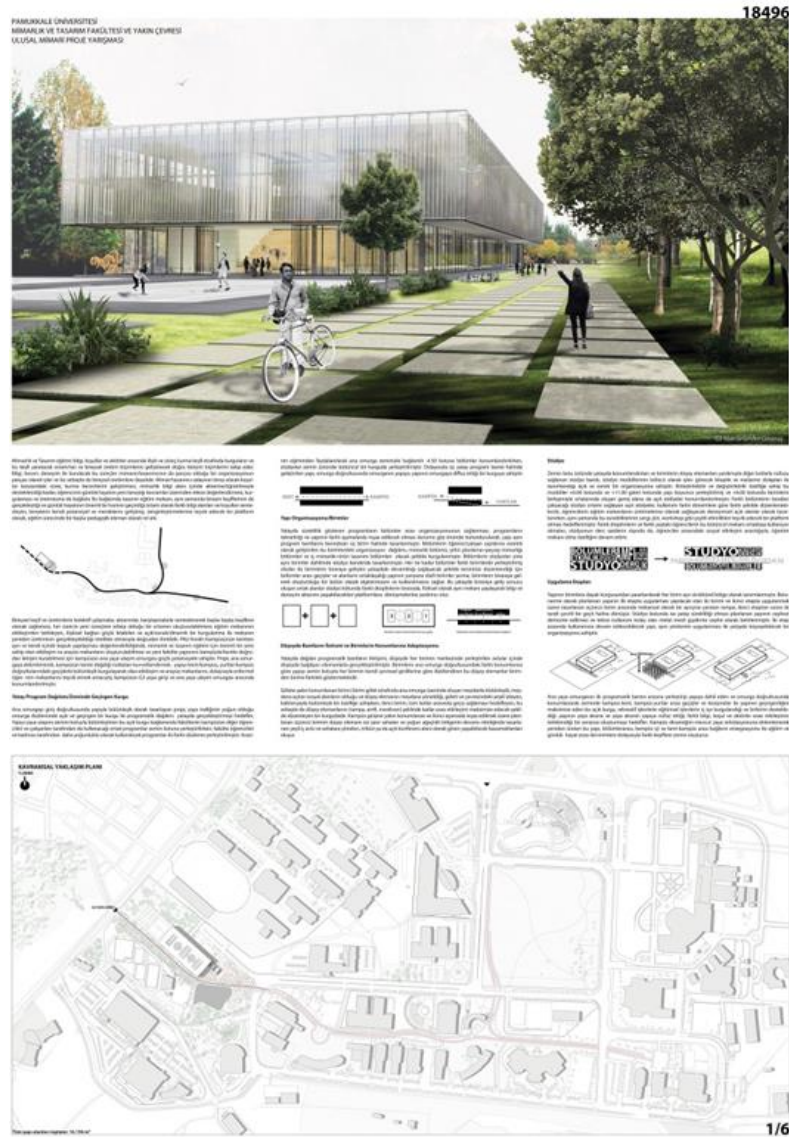
Şekil 6. İkincilik ödülü alan projenin paftaları (Anonim, 2017).