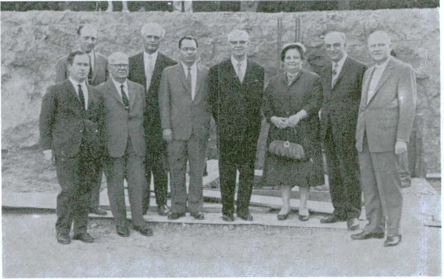
Res. 6 — Türk Tarih Kurumu üyelerinden bir kısmı yapı yerinde.