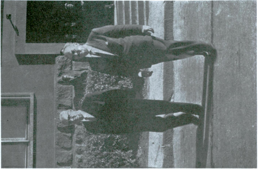
Res. 1 — Millî Eğitim Bakanı Dr. İbrahim Öktem ve T. T. K. Başkanı Ord. Prof. Dr. Ş. A. Kansu yapı alanına gelirken