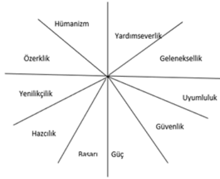
Şekil 1: Değerler Arasındaki İlişki Modeli (Schwartz, 1992: 14)

Değerlerin dairesel dağılım üzerindeki oranının artması uyumluluğun düşmesini ve çatışmanın artmasını göstermektedir. Orijine zıt yönde bulunan değer tiplerinin yüksek oranda çatıştığı kabul edilmektedir (Schwartz, 1992: 14). Bu durum değer tipleri arasındaki ilişkiyi ortaya koymaktadır.