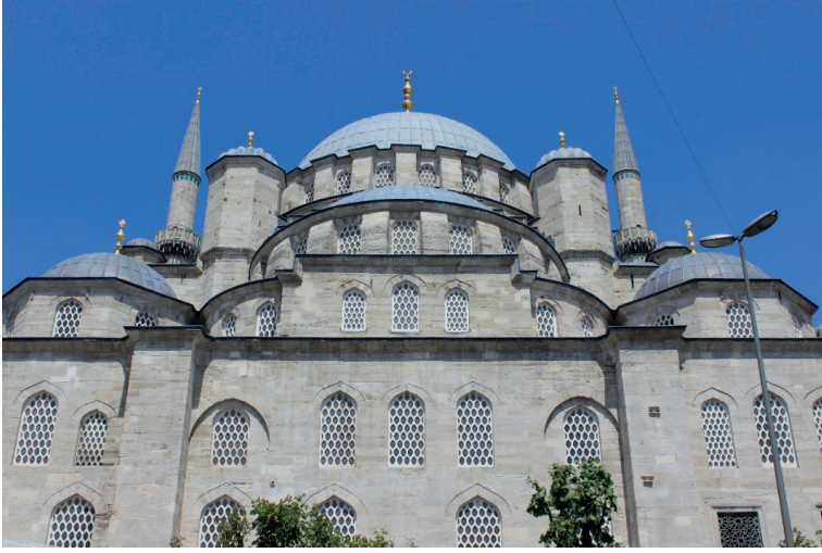
Görsel 5: Yeni Camii kible cephesi (Aysu Ateş, 2022).