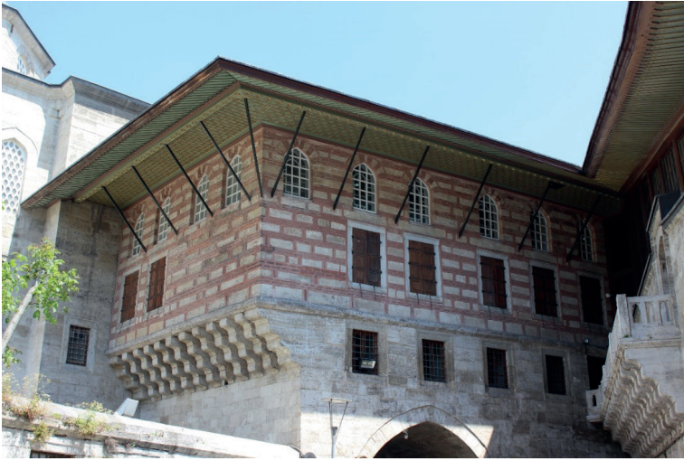
Görsel 6: Yeni Camii Hünkâr Kasrı.

Çalışma kapsamında başkent İstanbul'daki yapı faaliyetleri incelenen Mustafa Ağa bin Abdülmennan'ın kendisi ile özdeşleşen başkent dışındaki önemli eserleri ise Hadice Turhan Sultan'ın emri üzerine Çanakkale'de inşa edilen Seddülbahir ve Kumkale'dir. Çanakkale'nin karşılıklı iki kıyısında yer alan kalelerin inşasına 1658 yılında başladığı anlaşılr. Çanakkale'den gelen ve İstanbul'u tehdit eden Venedik saldırılarını önlemek üzere inşa edilen kalelere dair vakâyinâmelerde, Batılı seyyahların eserlerinde, Osmanlı arşiv belgelerinde ve Hadice Turhan