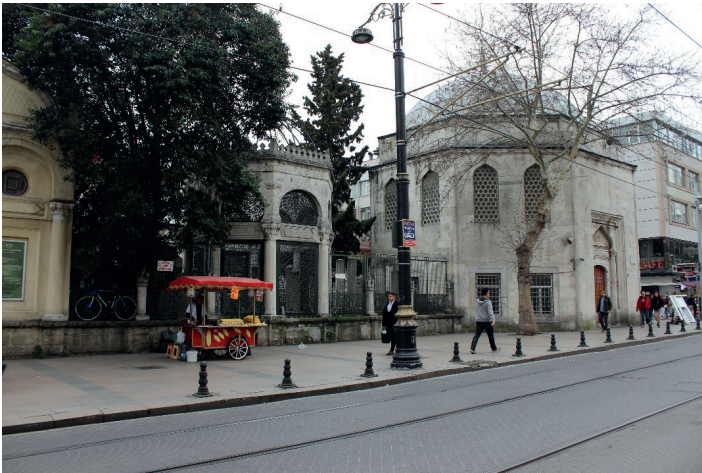
Görsel 3: Köprülü Külliyesi'nin Divanyolu üzerinden görünümü (Aysu Ateş, 2022).

Divanyolu üzerinde yer alan Köprülü Külliyesi, medrese merkezli ve küçük ölçekli külliyeler arasında anılmakla birlikte, külliye kurgusunda bir takım yenilikler dikkat çeker ( G3 ). Klasik düzende medrese kurgusu yerine, medresenin dershane birimi, ana yapı külesinden koparılacak sekizgen planlı inşa edilmiş ve medrese hücreleri "L" biçimli iki kol halinde, dershane/mescid'den ayrı olarak konumlanmıştır. 64 Diğer taraftan XIX. yüzyılda büyük ölçüde değişikliğe uğrayan külliye'nin, inşa edilmesinin ardından sonraki tarihlerde açık türbeye dönüştürülen 65 ve günümüzde oryantalist mimari öğeler içeren türbesi de oldukça dikkat çekicidir.