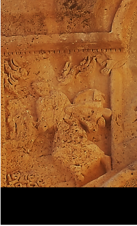
Şekil 4. Mağara mezar girişinde bulunan melek rölyefi