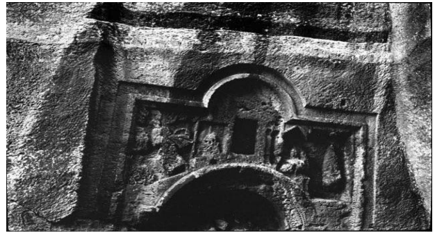
Şekil 3. Dara'da mağara mezar girişi (G. Bell Arşivi-1911)