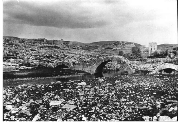
Şekil 2. Daraçay, köprü ve kilise kulesi