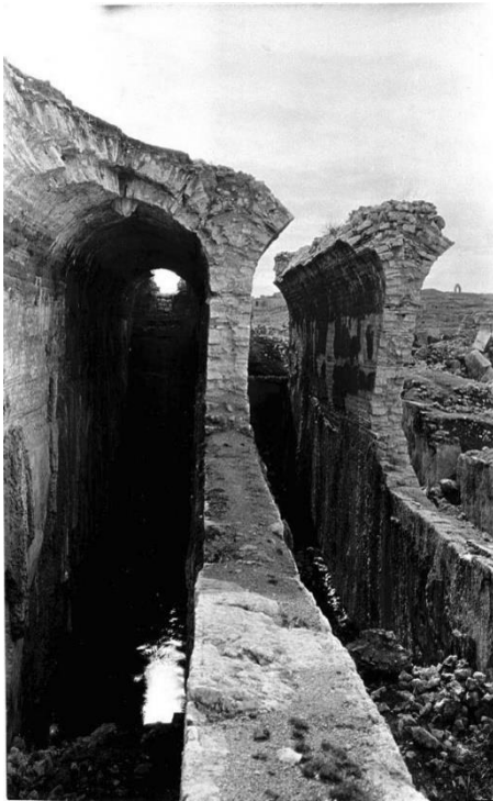
Şekil 5. Roma su sarnıçları