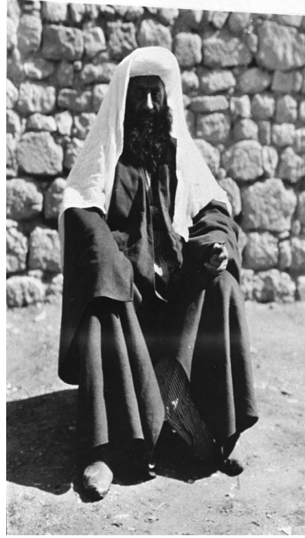
Şekil 6. Kürt Şeyh Muhammed Said