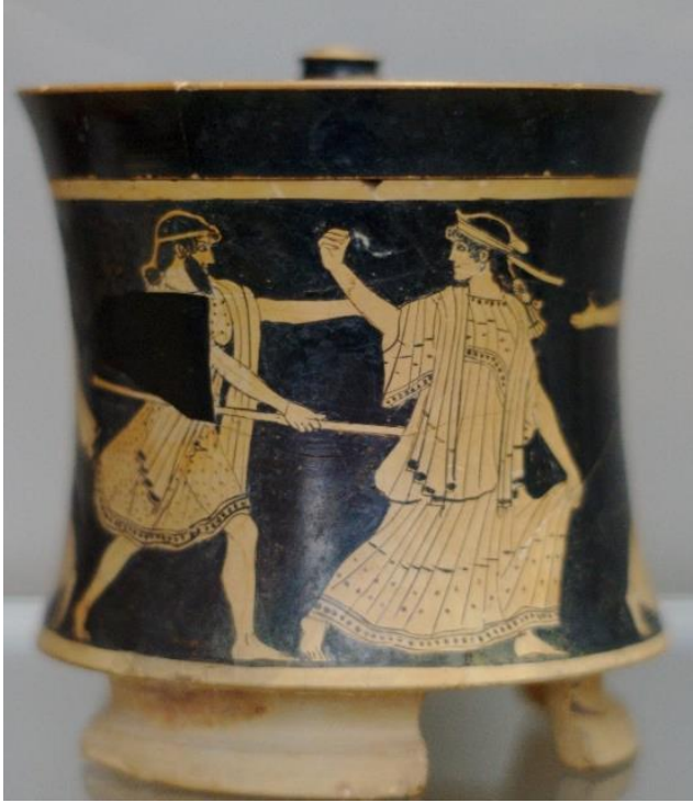
Figür 1 Zeus'un Asopos'un Kazı Aigina'yı Kaçırışı, Attika Kırmızı Figür, Pyxis, MÖ 470-460, Cambridge Fitzwilliam Müzesi Koleksiyonu https://en.wikipedia.org/wiki/Aegina_(mythology)#/media/File:Pyxis_of_Zeus_and_Aigina.jpg 06.07.2022)