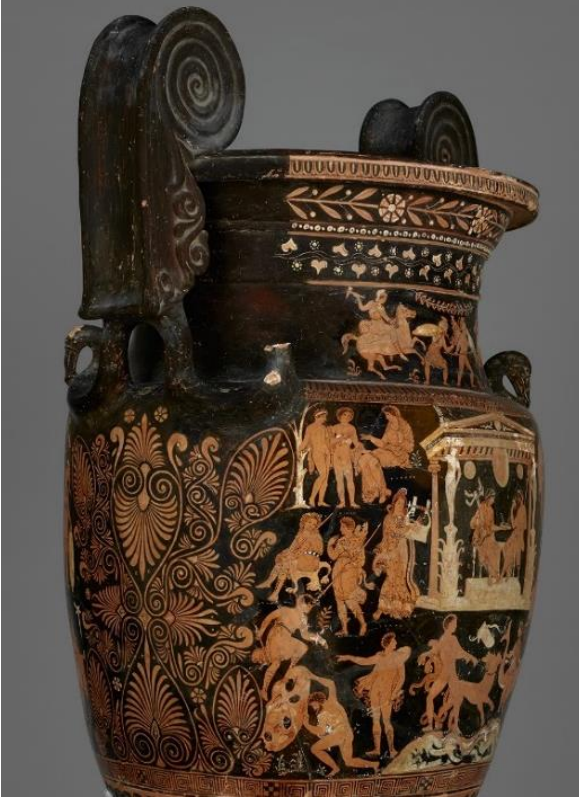
Figür 3 Sisyphos'un Cezası, Altamura'dan Krater, MÖ 350, Napoli Arkeoloji Müzesi ( https://blogs.getty.edu/iris/thinking-about-sisyphus-or-the-afterlife-with-some-rock-n-roll/ 06.07.2022)