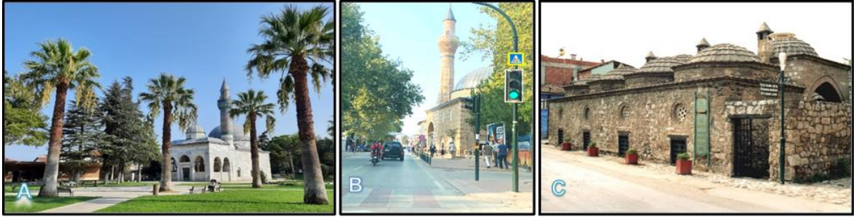
Şekil 4. A: İznik Yeşil Cami (Bursa, 2022)

B: Mahmut Çelebi Cami (Orjinal 2022), C: Süleyman Paşa Medresesi (Orijinal, 2018)