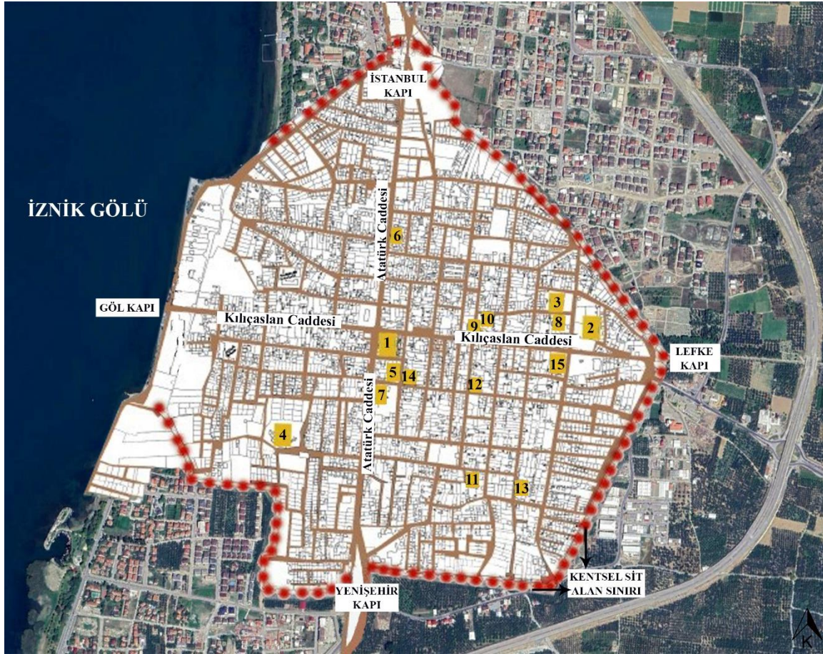
Şekil 2. İznik kentindeki kültür varlıkları ve konumları (1) Ayasofya Cami 2) Yeşil Cami 3) İznik Müzesi 4) Antik Roma Tiyatrosu 5) II. Murat Hamamı 6) I. Murat Hamamı 7) Mahmut Çelebi Cami 8) Şeyh Kudbuddin Cami 9) Hacı Özbek Cami 10) Eşref Rumi Camii 11) Yakup Çelebi Cami 12) Süleyman Paşa Cami 13) Vaftizhane 14) Çini Fırınları 15) Geleneksel Mimari Örneği) (Cengiz&Cengiz,2016’ dan geliştirilerek)

Kentin geçirdiği gelişim sürecinde, farklı dönemlerde ev sahipliği yaptığı uygarlıklar etkili olmuştur. Antik Çağ’da Bithynia sınırları içerisinde yer alan ve erken yerleşim izleri Prehistorik dönemlere kadar uzanan İznik (French, 1967); Klasik Dönem, Hellenistik Dönem, Roma İmparatorluk Dönemi, Bizans Dönemi, Selçuklu Dönemi ve Osmanlı Dönemi olmak üzere farklı devirler geçirmiş, söz konusu dönemlerde kent; Helikore, Antigonía, Nikaia, Nikaieon, Neikaia ve İsnikean isimleriyle anılmıştır (Artuk, 1960; Merkelbach, 1985; Şahin, 1987; Şahin, 2004; Cengiz&Cengiz, 2016; Şahin&Altın, 2018; Altın, 2020).