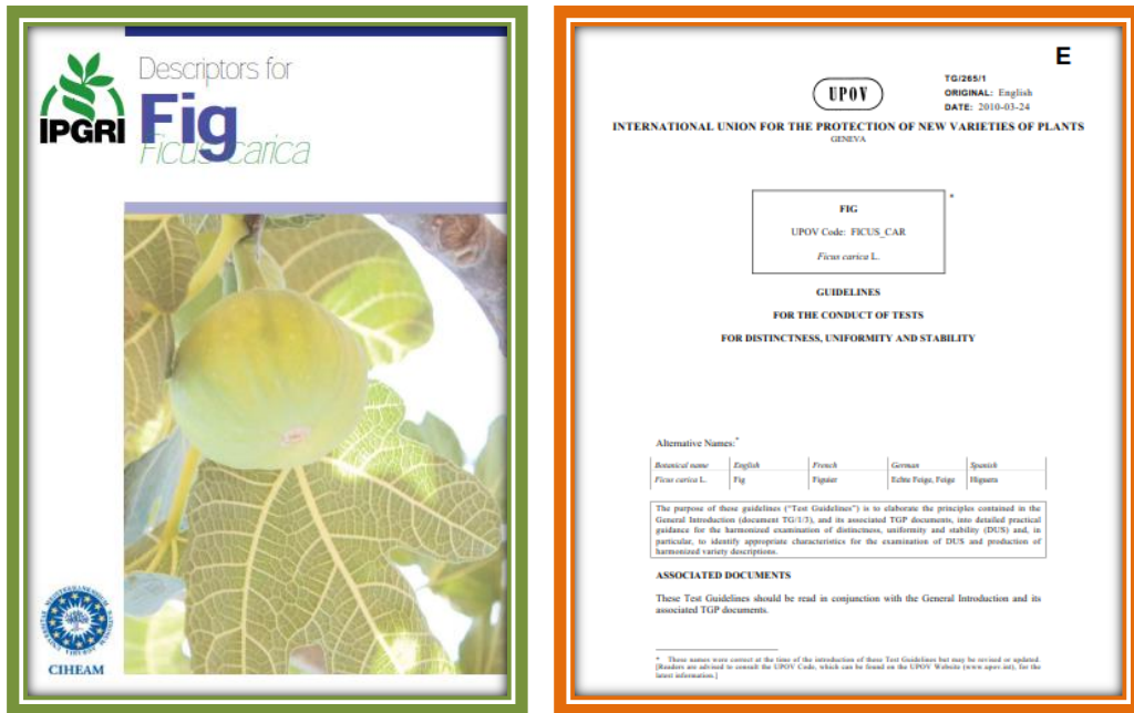
Şekil 2. İncir için kullanılan çeşit tanımlayıcıları (çeşit özellik belgeleri)

Dünya’da ve Türkiye’de incir üzerine yapılan çalışmalar daha çok koruma (gelecek nesillere aktarım, süreklilik ve adaptasyon), toplama (zenginleştirme), seleksiyon (doğadan ve ıslah çalışmaları) ve karakterizasyona (morfolojik ölçüm, pomolojik analiz, fenolojik gözlem vb.) dayalı çalışmalar olup, benzer metodlar kullanılarak yapılmaktadır. Çeşit tanımlamalarında; IPGRI (Uluslararası Bitki Genetik Kaynakları Enstitüsü), UPOV (Uluslararası Yeni Bitki Çeşitlerini Koruma Birliği Konseyi) tarafından (Şekil 2) düzenlenen incir için çeşit özellik belgeleri kriterleri kullanılmaktadır. Bu kriterler, ülkelere bazı küçük modifikasyonlarla geliştirilerek, uyarlanarak kullanılmaktadır. Dişi incir biyoçeşitliliğinin sürdürülebilirliğinin sağlanmasına yönelik yapılan bu çalışmaların dökümantasyonu, yapılacak olan ıslah ve diğer Ar-Ge çalışmalarına da kaynak teşkil etmesi açısından önem taşımaktadır. Bazı güncel Dünya ve Türkiye incir genetik çeşitlilik çalışmalarını içeren özet bilgiler, genelde yıllara göre düzenlenerek aşağıda verilmiştir.