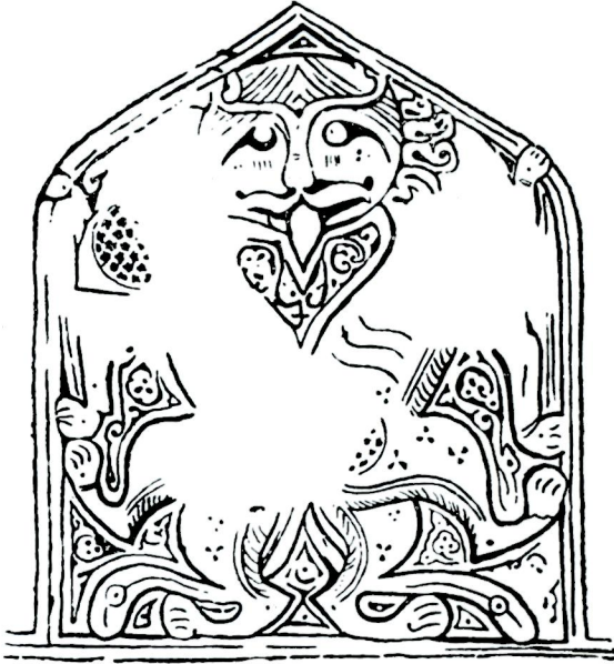
Res. 3 = Abb. 3 — Ars Islamica, V. P II. fig. 14