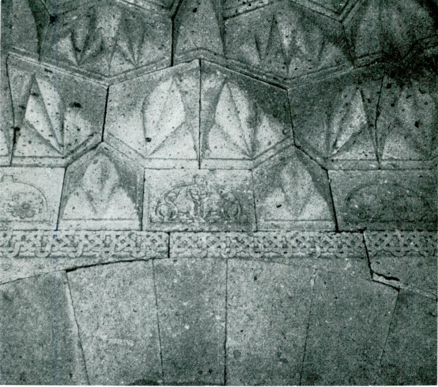
Res. 1 = Abb. 1 — Alay Han portalindeki kabartma