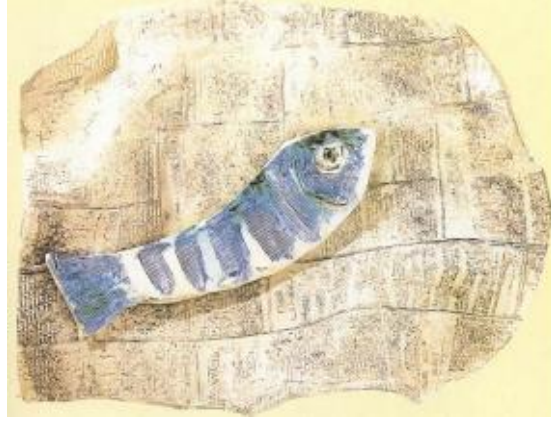
Görsel 2 Gazete üzerindeki balık, 1957'ler, Nice komünist gazetesi, 'La Patriote' a alınan kalıba basılmış ve boyalı seramikler (Herscher, 2002:145).