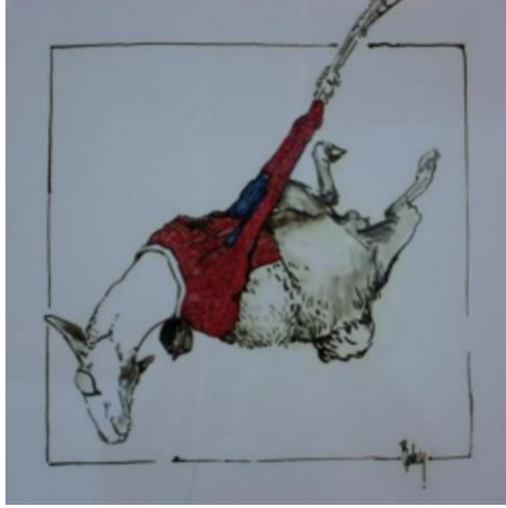
Görsel 10 (Örümcek Adam, 40x40cm, Sıraltı Dekor, (A. Baha Örken)

Genellikle siyah astar ve çamurun kendi rengini tercih etmektedir. Bunun nedeni çizgi film ve romanlardaki gibi bir görünüm elde etmek için yaptığını söylemiştir (Örken, 2010).