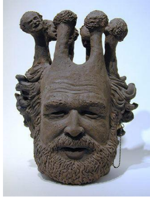
Görsel 6 (Robert Arneson'a ait seramik heykel)

Arneson 1960'lerden başlayarak, geleneksel fonksiyonel öğelerin üretimini terk ederek, çatışmacı ifadeler yapmak için gündelik nesnelere kullanmaya başlamıştır. Yeni hareket Funk Art olarak adlandırılan, seramik Funk hareketinin babası olarak kabul edilir. Seramik çalışmalarında, Görsel 6'da verilen çalışması ile sürrealist yaklaşım net bir şekilde görülmektedir.