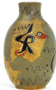
Görsel 3 (Joan Miro,1941)

1940'ların başlarında kil ile tanışan sanatçı, modellemeyi ve şekillendirmeyi denemeye başladığında, diğer sanat formlarında asla mümkün bulamayacağı, sanatçı ile eser arasındaki kişisel bağlantıdan zevk aldığını çabucak fark etmiştir. Sanatçı, sürrealist fikirlerini özgürce formlara yansıtarak, Görsel 3'te verilen kalıcı eserler bırakmıştır.