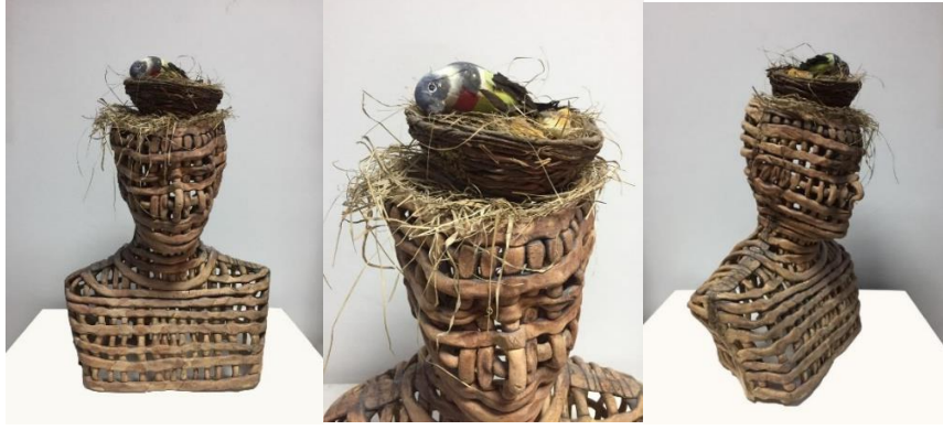
Görsel 12 (Kuş Beyinli, 38x50 cm, Karışık Teknik, (Nurettin Gülaçtı, 2009)

Bu çalışmada, halk arasında belki de kızgınlık halinde kullanılan “kuş beyinli” deyiminden esinlenerek, kuş kafesi şeklinde insan büstü yaparak, kafa kısmında çalılık ve kuş figürü ile kuş beyinli insana gönderme yapmaktadır.