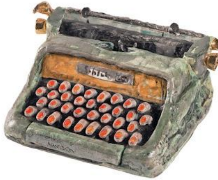
Görsel 7 (Robert Arneson, Typewriter, 1965)

Robert Arneson Sürrealist eğilim gösteren seramik sanatçısıdır. Görsel 7'de verilen çalışması figür bakımından oldukça zengin, formun bütünüyle dikkat çektiği görülmektedir. İnsanın tek bir yüzünün olmadığı ve aynı zamanda birçok düşünceyi barındırdığını figürlerin etkisi ile estetik bir halde gözler önüne sunmuştur.