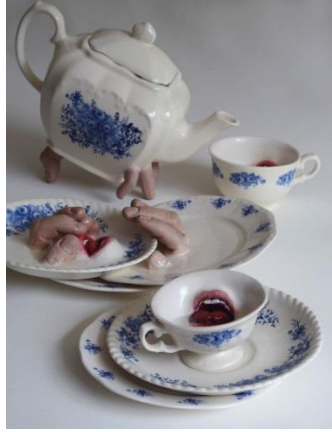
Görsel 8 (Ronit Baranga, Sabah Kahvaltısı, 2014. Özel Koleksiyon, FRONTIER, 14th Biennial of Ceramics, (Andenne. Belçika, 2015)