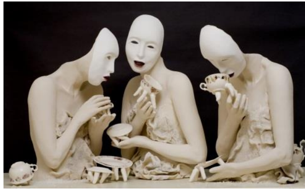
Görsel 9 (Çay Partisi, Ronit Baranga, 2007)

Üç cansız maskeli figür bir çay içme töreni için bir araya getirilir. Figürlerden kaçarak uzaklaşmaya çalışan, boş bardak ve tabakları kullanarak vücutlarına yiyecek sokmaya çalışırlar. Maskelerin insan ağzı vardır, bu da figür ile aralarında kopmaz bir bağ oluşturarak maskenin vücutla bütünleşmesine neden olur (Baranga, 2007).