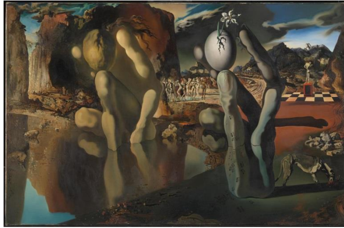
Görsel 1 (Metamorphosis of Narcissus 1937 by Salvador Dali, Tate Modern)

Sürrealizm akımı Sigmund Freud tarafından çıkarılmış, Andre Breton tarafından ise 1924'te yayımlanmıştır. Plastik sanatları, edebiyatı, sinemayı ve tiyatroyu aynı ölçüde etkilemiş ve büyük ölçüde bu etkilerini koruyan sürrealizm, fikir ve sanat dünyasına tanıtılmıştır. Dadaizm ve metafizik gibi sanat anlayışları sürrealizmin öncüsü sayılmaktadır. Sürrealist sanatçıların esas ilgilendikleri bilinçaltıdır.