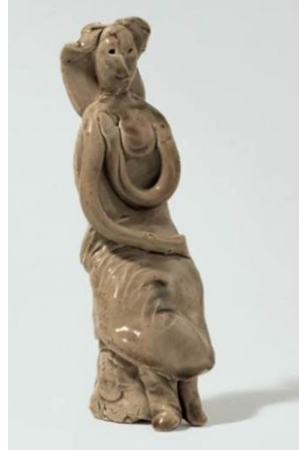
Görsel 4 (Pablo Picasso. Oturan Kadın. Vallauris, 1947)

Modern sanat tarihinde nadir görülen türden bir yer edinmiş olan Pablo Picasso yaşamı boyunca politik, yenilikçi, kübist gibi birçok sıfatla anılsa da o azimle çizgisinde ilerleyerek gelmiş geçmiş en ünlü ressam olarak anılmayı başarmıştır (Şenol, 2015).