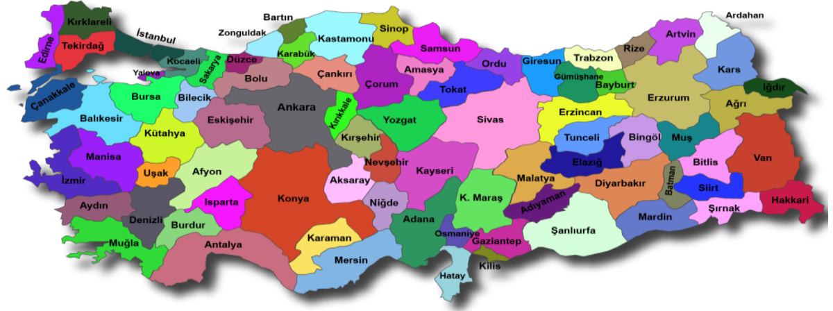
Şekil 3: Düzey 3 Grubu Verileri

Şekil 2’de Düzey 2 grubunda olan 26 İBB’nin Türkiye haritası üzerinde dağılımı verilmiştir. Türkiye’de sosyal, ekonomik ve coğrafi bakımdan benzer özellik taşıyan iller beraber değerlendirilmiş olup, 26 kalkınma ajansı kurularak benzer özellikli illerin aynı çatı altında toplanması ve bu illerde kalkınma politikaları oluşturulması sağlanmıştır.