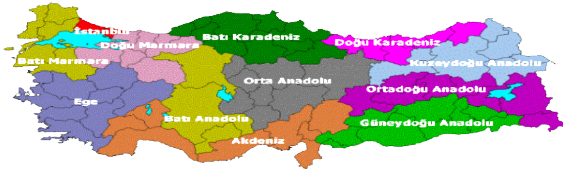
Şekil 1: Düzyey 1 Grubu Verileri

Türkiye, idari yapılanma olarak 81 ile ayrılmış ve demografik araştırmalar içinde 5 bölge olarak belirlenmiştir. Bu ayrımlar ülkenin farklı yöreleri arasındaki demografik, ekonomik, kültürel ve toplumsal farklılık incelenmesinde çokça kullanılmıştır. Bu beş bölge birbirine komşu olan ve Batı, Orta, Kuzey, Güney ve Doğu bölgeleri olarak tanımlanmıştır.7 coğrafi bölgeden oluşan Türkiye 22 Eylül 2002 tarih ve 2002/4720 no’lu kanun gereğince, Avrupa Birliği için daha detaylı veri akışı sağlamak amacıyla Eurostat (Avrupa Birliği İstatistik Ofisi) tarafından 1970’li yıllarında kurulan ve bölgesel istatistik toplayan, bölgesel politika geliştiren ve sosyal-ekonomik analizler yapan İstatistik Bölge Birimleri Sınıflandırmasına dahil olmuştur. Devlet Planlama Teşkilatı ve Türkiye İstatistik Enstitüsü tarafından bu kapsamda 3 farklı düzeyde İBBS bölgesi oluşturulmuştur (Yılmaz vd., 2007; DPT, 2006). İBB sınıflandırması ile “Düzyey 3” olarak iller belirlenmişken; sosyal, ekonomik ve coğrafi olarak benzer olan komşu iller ise nüfus büyüklükleri ve bölgesel kalkınma planları göz önüne alınarak “Düzyey 1” ve “Düzyey 2” olarak sınıflandırılmıştır.