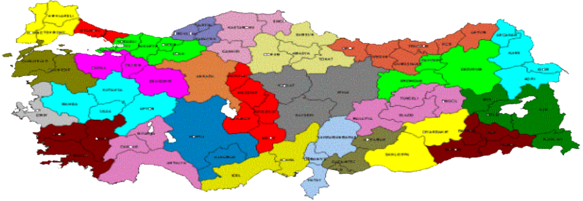
Şekil 2: Düzey 2 Grubu Verileri