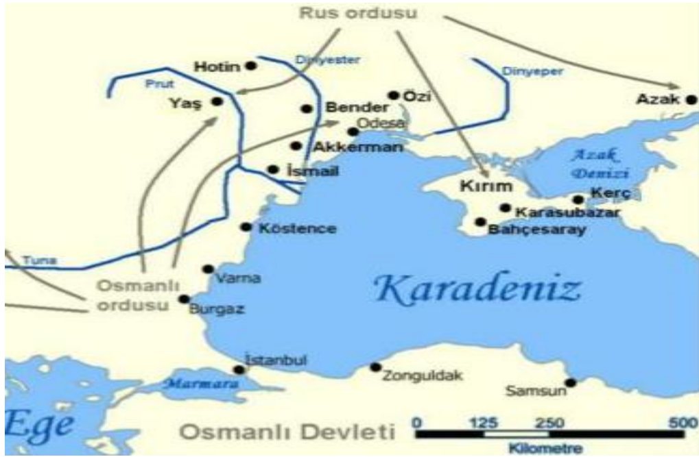
Harita.1. 1768-1774 Savaşının Cepheleri

Bu savaşta Rusların Osmanlı toprakların Kafkas ve Kuzey Karadeniz'den saldırıcağılardı. Lakin Ruslar için en önemli cephe Kuzey Karadeniz cephesiydi. Sultan III. Mustafa savaş hazırlıklarının önemli bir kısmını bu cephede yoğunlaştırdı. Bu cephede Başta Özi olmak üzere Bender, Hotin gibi kaleler stratejik bir öneme sahipti. Bu kalelerde zaman kaybedilmeden gerekli istihkâm faaliyetlerine başlandı.