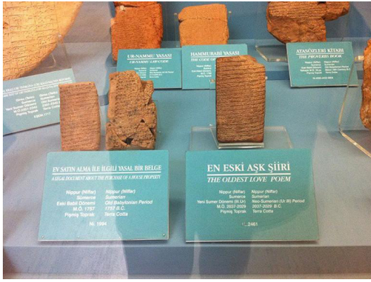
Resim 1. 4500 yıllık Sümerlilere ait kil tablet, ileti, aşk mektubu. İstanbul Arkeoloji Müzesi.

Araştırmalarda bir pul büyüklüğünden, 25x30 santimetre büyüklüğüne kadar ileti-tabletlere rastlanmaktadır. Son yüzyılda Kültepe’de yapılan kazılarda yirmi beş binden fazla tablet bulunmuştur. Bunlar ticari antlaşmalar, iş mektupları, gümrükten mal kaçırma hileleri, kaynana kavgaları gibi içeriklere sahiptir. Kıskaçlıklar, evlenme kayıtları da önemli bir yer tutmaktadır. Ayrıca mektubu zarflamak ya da kaplama ihtiyacı bu döneme aittir. Günümüz alışkanlığında zarf, mektup içeriği görülmesin diye kullanılmaktadır, oysa Sümerlerde kil tablet yine daha ince bir kil ile kaplanır ve ileti zarfın üzerine aynı şekilde yazılırdı. Onların okunma, deşifre olma gibi koricuları yoktur. Sadece kırılması hâlinde yedekleme ihtiyaçları vardır.