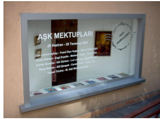
Resim 2. Teşvikiye Sanat Galerisi’nde düzenlenen aşk mektupları sergisi, Haziran 2005.

Daha önce de tarifini yaptığımız nesne: “bir şeye yarayan şey” (Barthes, 1993) olarak kayda geçmiştir. Burada bu şeyin, yani aşk nesnesi olan ileti veya mektubu, bir de sanat nesnesi, tasarım nesnesi olarak irdelemek gerekiyor. Barthes (1993), nesne için “görülme bekleyen şeydir” diye de eklemiştir. Görünür olan alt tarafı katlanmış bir kağıt parçası formındadır. Öğrencilerin yaptıkları çalışmada üretilen şeyler sadece bu göstergeler değildir. İçlerinde üç boyutlu işler, videolar, ve kağıt, tuval kullanılarak üretilmiş olanlar vardır ve bunlar bir galeride sergilenmek için hazırlanmıştır.