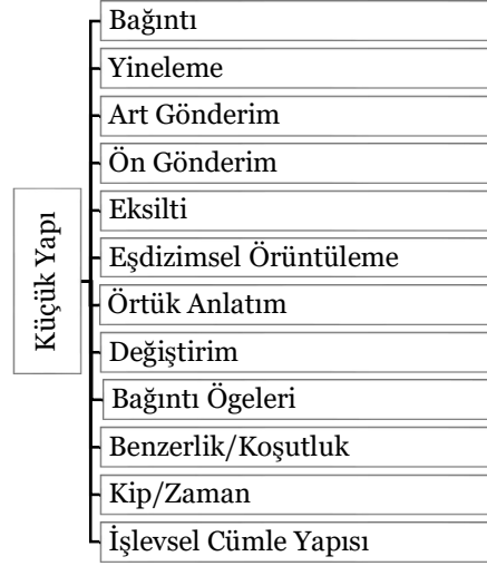
Görsel 1. Küçük yapı unsurları

Dil bilgisel bağlaşıklık, Halliday-Hasan (1976) ve Beaugrande-Dressler'e (1981) göre; "gönderim, değiştirim, eksilti, bağlaçlar, koşutluk, zaman ve görünüş, işlevsel tümce yapısı (devrik tümce)" gibi dil düzenekleri ile sağlanır. Aynı, benzer ve zıt anlamlı sözcüklerin kullanımı veya alt-üst anlamlılık ilişkisi bulunan sözcüklerin kullanımı ile metinde sağlanan bağdaştırma yolu, sözcüksel bağlaşıklık (lexical cohesion) olarak bilinmektedir. Metin içinde geçen sözcüklerin aynı, eş anlamlı veya yakın anlamlı sözcüklerle, üst terim-altanlamlılık ilişkisi içeren sözcüklerle ya da aynı kavram alanından sözcükler kullanılarak yinelemesi ile oluşturulur (Akt. Dilidüzgün, 2008).