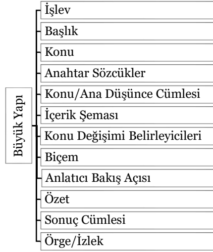
Görsel 2. Büyük yapı unsurları

Üst yapı bölümünde ise metinler; ton, tip ve türlerine göre sınıflandırılmıştır. Metnin tonu; yazarın okuyucuda üzüntü, heyecan, sevinç, coşku gibi ruhsal etkiler oluşturmak için kullandığı özelliklerdir. Metnin genel özelliğini, daha genel metin ulamlarını belirten metnin tipi; yazarın niyetine (metnin işlevine) ve yazarın metni düzenleyişine bağlıdır (Günay, 2007; İltar & Açık, 2019, s.318).