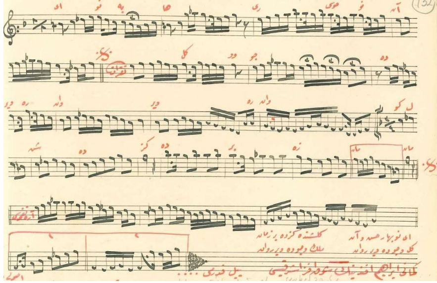
Görsel 3. “Ey nevbahâr-ı hüsn-ü ân” isimli eserin bir bölümü. (Kaynak: Türkiye Diyanet Vakfı, İslam Araştırmaları Merkezi, Cüneyd Kosal Türk Musikisi Arşivi).

Abdülaziz Han'ın bu eseri ile ilgili olarak, “nağmelerinde görülen düzen ve yenilikle meyanına rastlayan bir mısramında usûl değiştirilmesi ile ruhu okşayan bir etki veren bestekârın, yüksek değer sahibi olduğunu musiki tabiatının gerçekten şahane tabirine layık olduğunu” belirtmektedir. Eserin notaları Görsel 3. de görüldüğü gibidir.