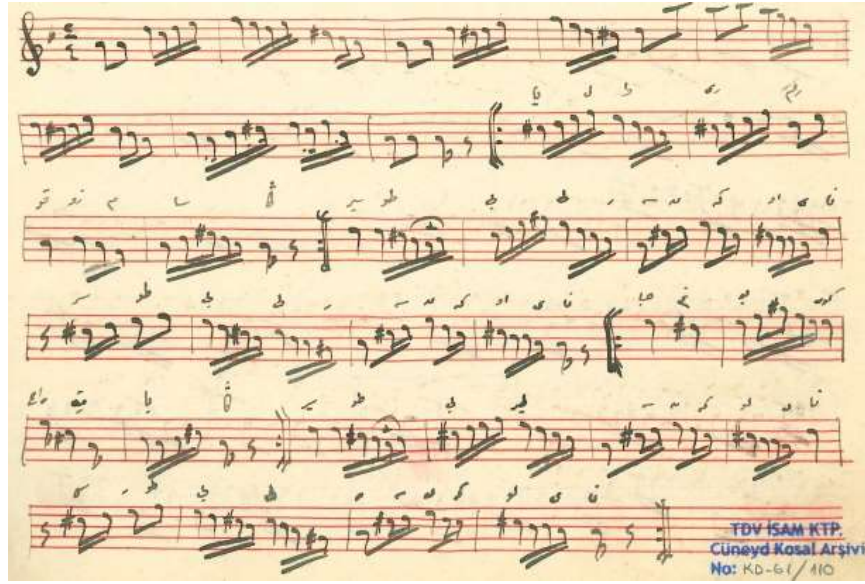
Görsel 5. “Yalvarırım kuzum sana” isimli eserin notaları..

Rauf Yekta Bey'in bahsettięi bu eserlerin dıřında, günümüze kadar geöen süreç içerisinde Sultan Abdülaziz'e ait olduęu tespit edilen başka eserler de bulunmaktadır. Bu alıřmada elde edilen bilgiler çerçevesinde, Sultan Abdülaziz'e atfedilen tüm eserler ařaęıdaki tabloda görüldüęü gibidir.