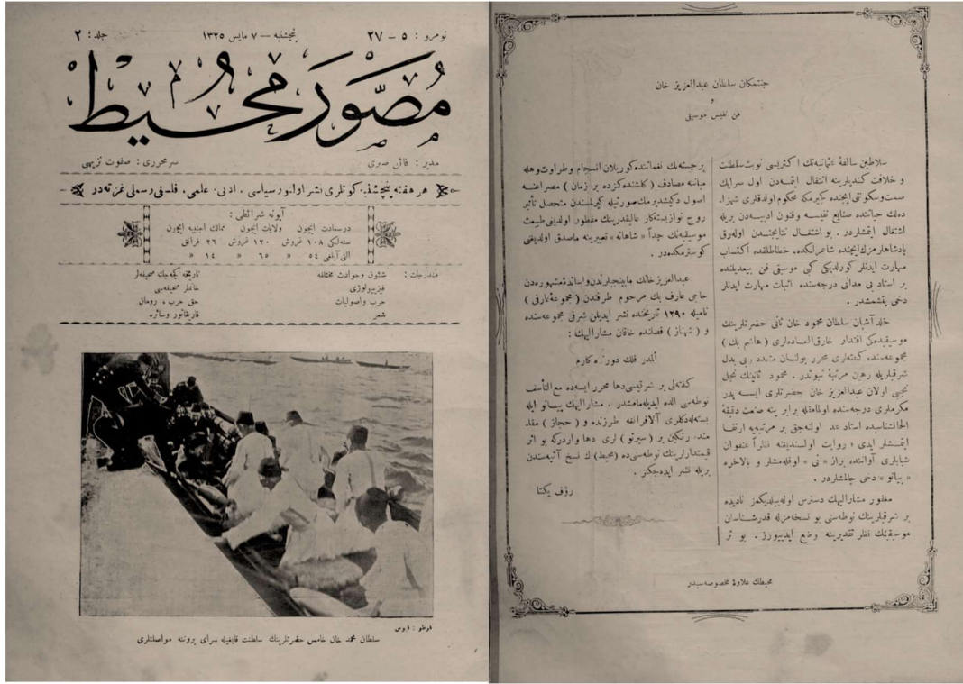
Görsel 1. Musavver Muhit dergisinde yayımlanan “Cennet Mekân Sultan Abdülaziz Han ve Fenn-i Nefis-i Musiki” adlı makalenin esas metni.