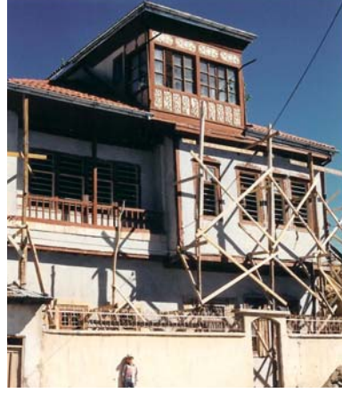
Foto.1- Bayburt geleneksel evlerinin ön cephesinde köşk katı biçimlenmesi (Kavalalılar Evi Ön Cephe Görünüşü)

görmek mümkündür. Çoğunlukla üst katın üzerinde konumlanan köşk odası, nadir örneklerde giriş katın üzerinde yer alır (Sami Ozan evi).