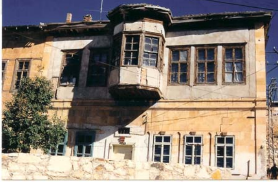
Foto. 2- Bayburt evlerinde farklı çıkma örneği (Fehmi Sekmenli Evi Ön Cephe Görünüşü)