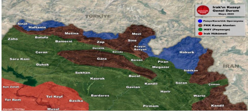
Şekil-2: TSK'nın icra ettiği Kararlılık ve Peñçe Harekâtları Sonrası Son Durum

( https://www.diplomatikstrateji.com/irakin-kuzeyi-sondurum-haritasi-timeline/ )