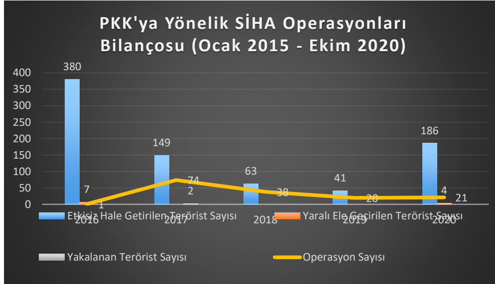
Grafik-3: 2015-2020 Yılları Arasında PKK'ya Yönelik Düzenlenen Operasyon Sonuçları