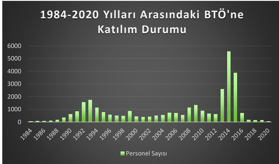
Grafik-1: 1984 – 2020 Yılları Arasındaki BTÖ'ne Katılım Durumu

Aslında sürecin uygulamaya geçmesine dair daha net bir tarih olarak belirtilmek gerekirse, çözüm süreci için Nevruz kutlamalarının yapıldığı 21 Mart’ın 2013 gayriresmî başlangıç olarak kabul bulmuştur (Köse, 2017, s.18). Bu dönem PKK ve Türk Silahlı Kuvvetleri arasında bir nevi çatışmasızlık dönemi olarak geçmiştir. Fakat PKK bu dönemi lehine kullanıp özellikle Kuzey Irak’taki sınıra yakın tepelere mağaralar inşa etmiş ve inşa ettiği bu mağaralara silah ve mühimmat yığınaklanması yapmıştır. Ayrıca bu dönemde örgüte katılımı da çok ciddi bir artış olmuştur. Grafik-1’de terör örgütü 1984-2020 yılları arası katılım miktarları gösterilmiştir.