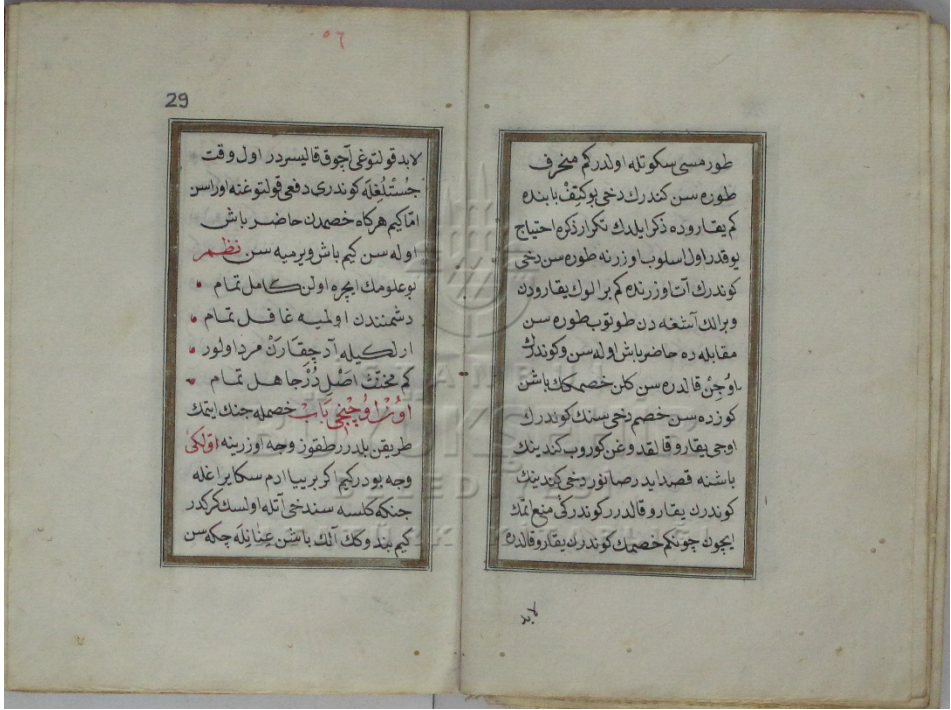
Ek-2: Matrakçı Nasuh: Tuhfetü'l-Gûzat