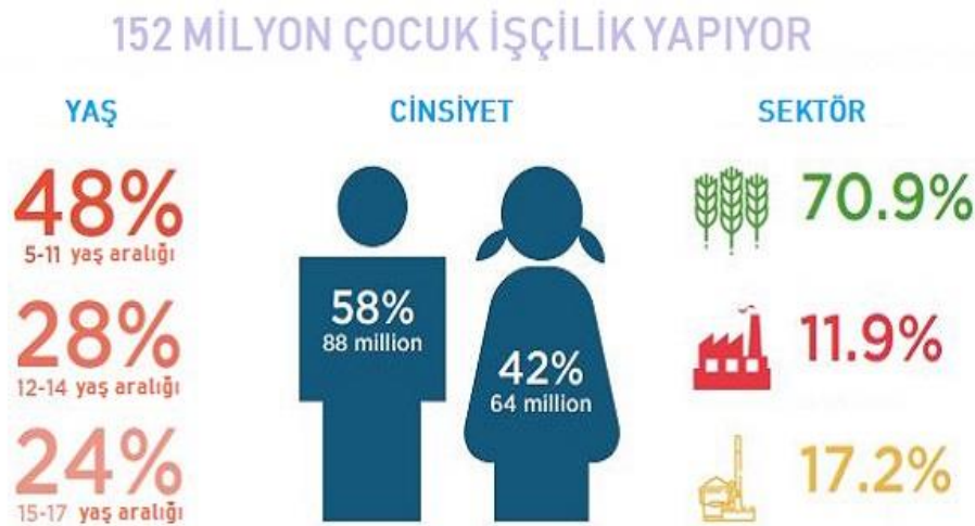
Şekil 2: Dünyada Çalışan Çocukların 2012-2016 Yıllarında Yaşa, Cinsiyete ve Sektörlere Göre Dağılımı

ILO'nun 2012-2016 Çocuk İşçiliği ile Mücadele Programı (International Programme on the Elimination of Child Labour [IPEC]) raporuna göre dünyada 152 milyon çocuk işçi bulunmaktadır ve bunların 73 milyonu tehlikeli işlerde çalışmaktadır. Çocuk işçiliği Afrika'da %19,6, Amerika'da %5,3, Arap ülkelerinde %2,9, Asya ve Pasifik'te %7,4, Avrupa ve Orta Asya'da %4,1 olarak görülmektedir. Bu çocuk işçilerin %48'i 5-11 yaş, %28'i 12-14 yaş ve %24'ü 15-17 yaş grubundadır. Dünyada çalışan çocukların 88 milyonu erkek, 64 milyonu kızdır. Çocukların %70,9'u tarım, %11,9'u sanayi, %17,2'si hizmet sektöründe çalışmaktadır (ILO, 2017).