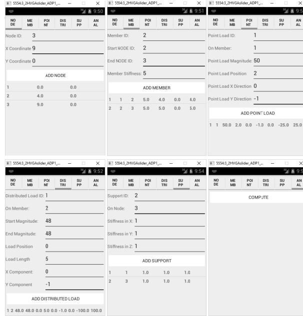
Şekil 3. Android uygulamasının veri giriş ekran çıktıları

İş iskelesinin sonlu elemanlar yöntemi ile analizi durumunda 144x144 boyutunda matris tersinin hesaplanması gerekecektir. Açılı ve sonlu eleman yöntemleri tarafından oluşturulan katsayı matrisleri seyrek matristir. Seyrek matrislerin nümerik çözümü göreceli olarak daha kolay olmakla birlikte çözüm için gereken tekrar sayısı ve hesap yükü matris boyutuna oranla üstel biçimde artmaktadır [5]. Gauss Yöntemi ile doğrusal denklem sisteminin çözümü O(n^3) aritmetik karmaşıklığa sahiptir. Bu durumda sonlu elemanlar yöntemi açılı yöntemine göre yaklaşık 20 kat daha fazla hesap yükü getirmektedir. Buna ek olarak katsayıların bellekte tutulması için Açılı Yöntemine göre yaklaşık 9 kat daha fazla belleğe ihtiyaç duyulmaktadır. Bellek ve işlemci gücü ihtiyacı masaüstü ve dizüstü bilgisayarlar için ihmal edilebilir olmakla birlikte elde taşınabilir cihazlar için önemlidir.