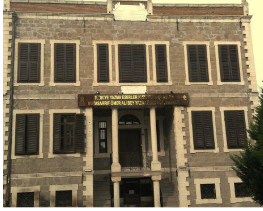
Resim 1: Balıkesir Ziraat Bankası'na ait ilk binanın günümüzdeki görüntüsünden Kaynak: (URL-2).

1990: 108-109). Cumhuriyetin ilanı sonrasında Ziraat Bankası aynı binada hizmet vermeye devam etmiştir. Bu bina, günümüzde Mutasarrıf Ömer Ali Bey Yazma Eser Kütüphanesi olarak hizmet vermektedir.