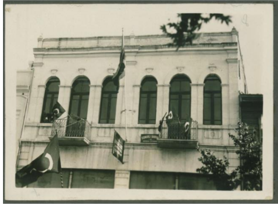
Resim 2: Balıkesir Osmanlı Bankası'na ait binanın 1930 yılına ait görüntüsünden

Osmanlı Bankası, Türk bankacılık tarihinin uzun ömürlü bankalarından biri olarak değerlendirilebilir, önce ticari banka olarak faaliyete geçen Osmanlı Bankası daha sonra devlet bünyesinde merkez bankası görevini üstlenmiştir. Balıkesir'de de Ziraat Bankası'nın ardından 1910 yılında kurulan ikinci bankadır. (Apak ve Tay, 2012: 63-64, 103). Osmanlı Bankası Balıkesir'de kuruluş yıllarından itibaren başlayarak hizmetlerini yaygınlaştırmış, cumhuriyet sürecinde de bankanın faaliyetlerine devam ettiği anlaşılmaktadır. Yaptığımız araştırma doğrultusunda bu binanın Balıkesir Anafartalar Caddesi üzerinde yer aldığı kanaatine varmış bulunmaktayız.