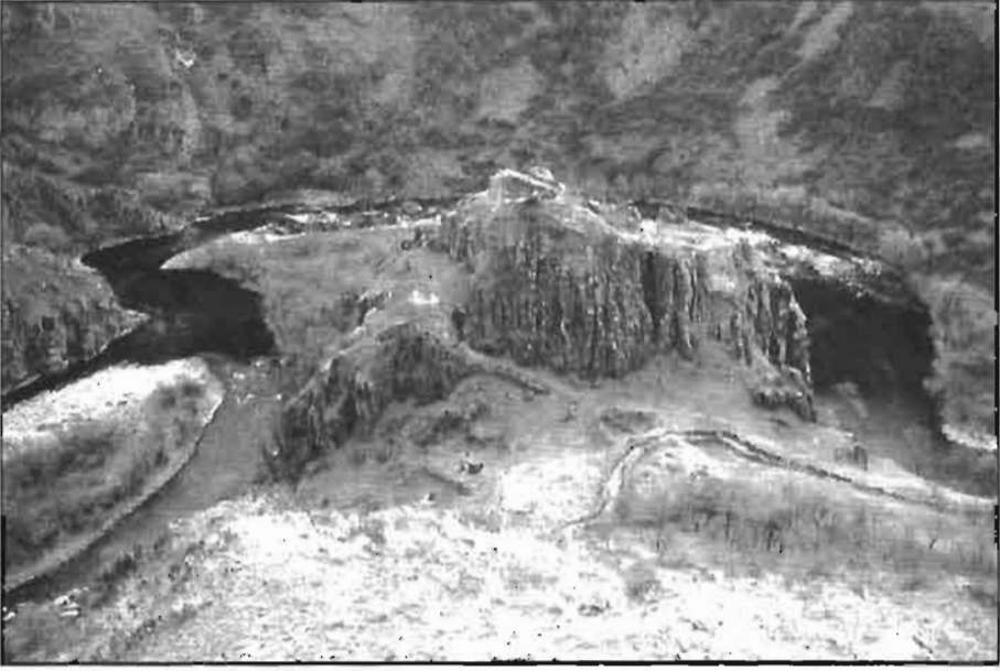
Resim -1 Kurtkale'den Genel Görünüm