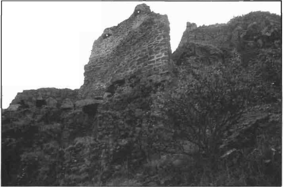
Resim -4 Kurtkale Girişteki Üçgen Mazgal Siperleri