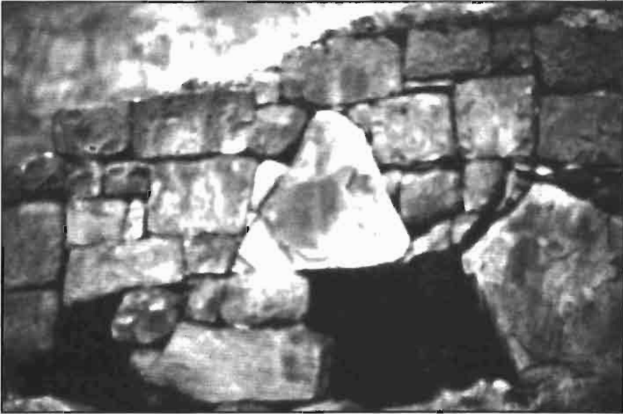
Resim -2 Kurtkale-Girişin Solunda Kurt Figürü