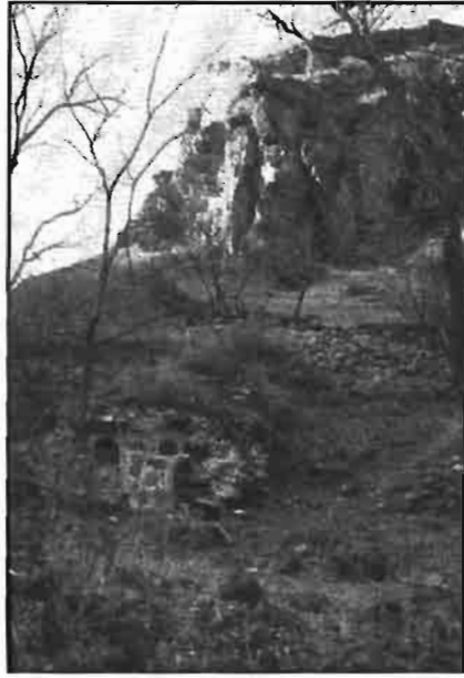
Resim -8 Güneydeki Hamam Kalıntısı