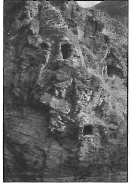
Resim -5 Kurtkale Gizli Su Tünelleri