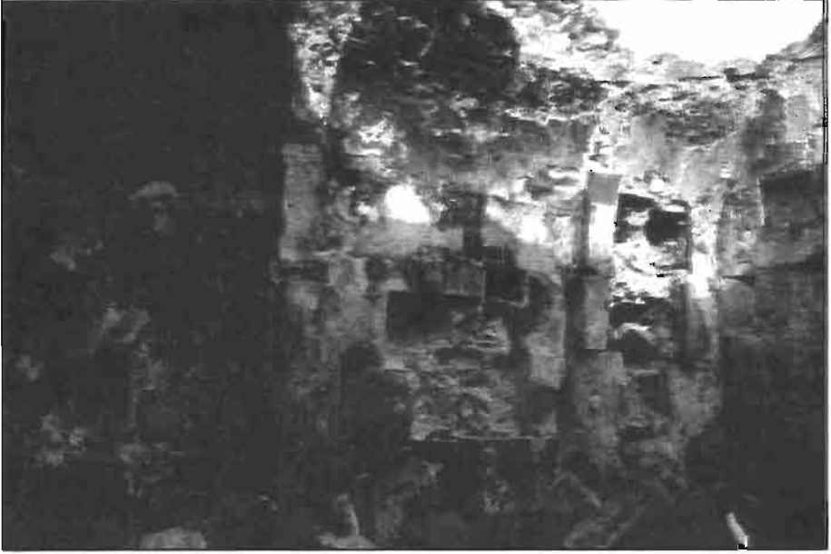
Resim -6 Kurtkale Şapelden