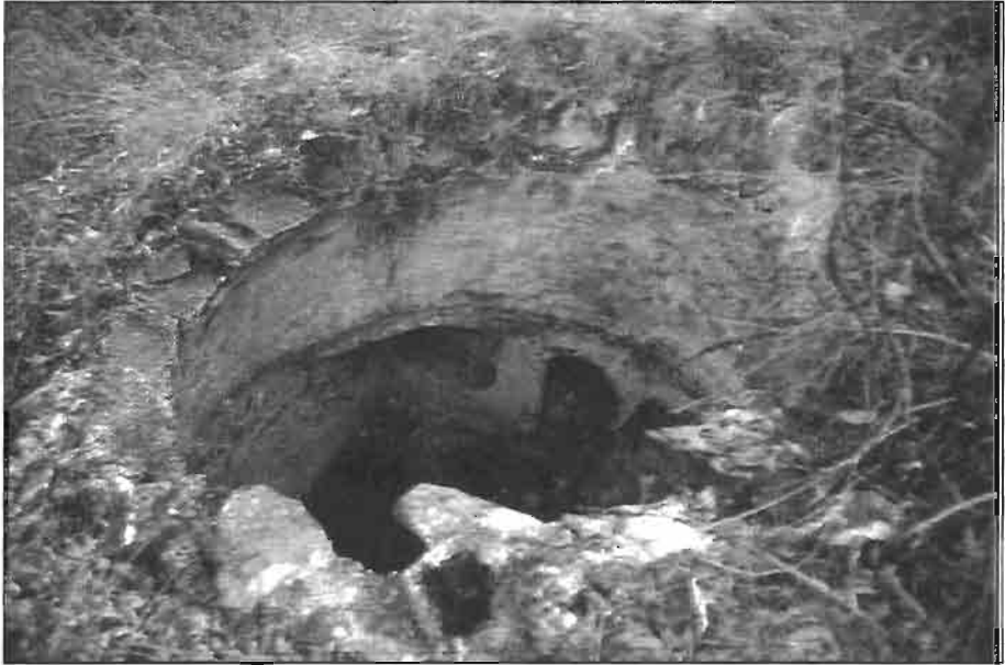
Resim -7 Kurtkale Güney Eteğindeki Hamam Kalıntısı