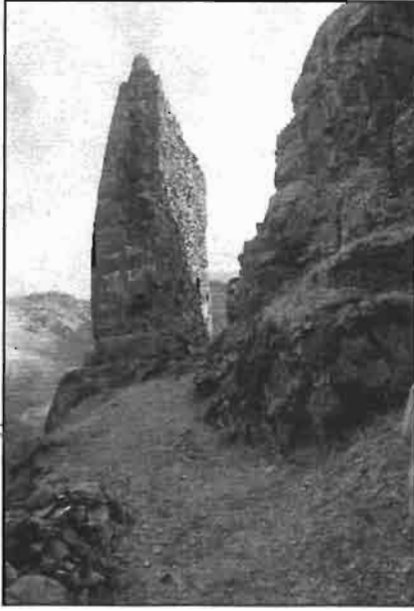
Resim -3 Kurtkale Kuzeydeki Giriş