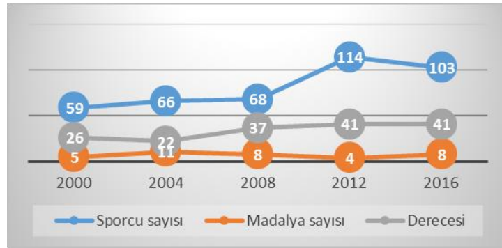
Grafik 1. Türkiye'nin son 5 olimpiyattaki müsabık sporcu katılım sayısı, madalya ve derece durumu

Madalya sayısı değil dereceyi dikkate alırsak Türkiye son iki olimpiyatta aynı dereceyi yapmıştır. Rio 2016'da 2000, 2004 ve 2008 olimpiyatlarına göre başarısızdır (Grafik 1).